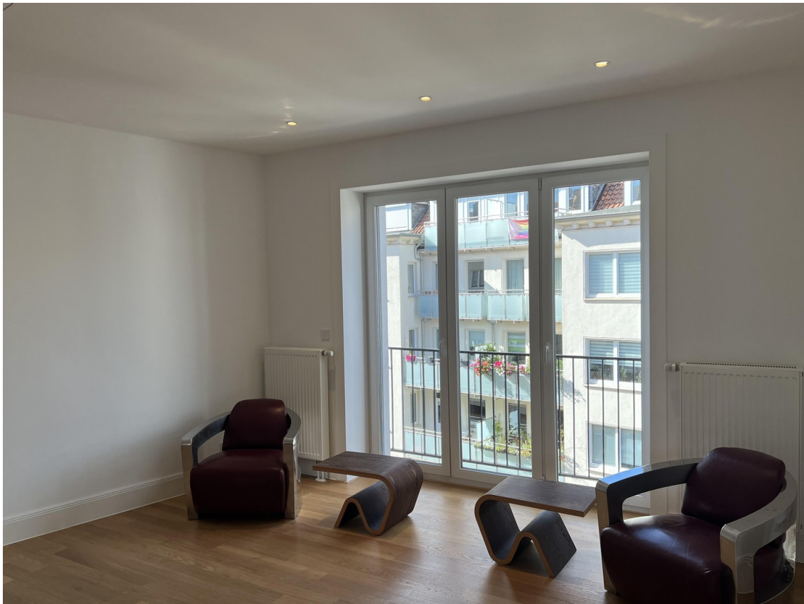
Beispiel Foto Wohnzimmer