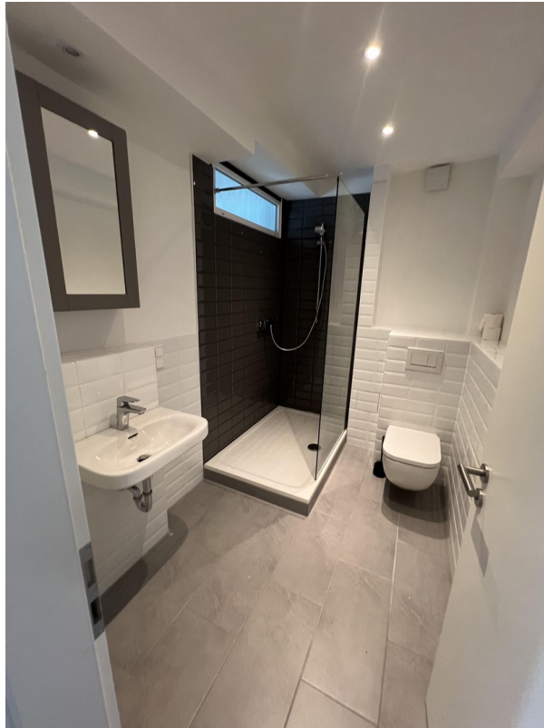
Beispiel Foto Badezimmer