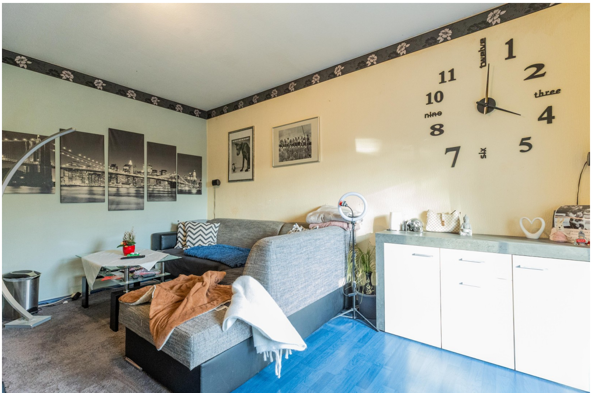
Wohnung links Wohnzimmer