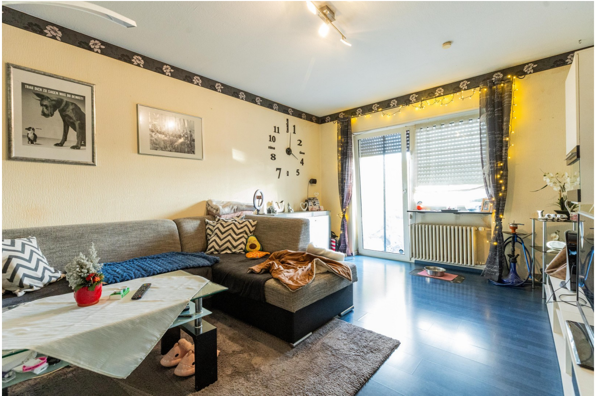
Wohnz. links Ausgang Terrasse