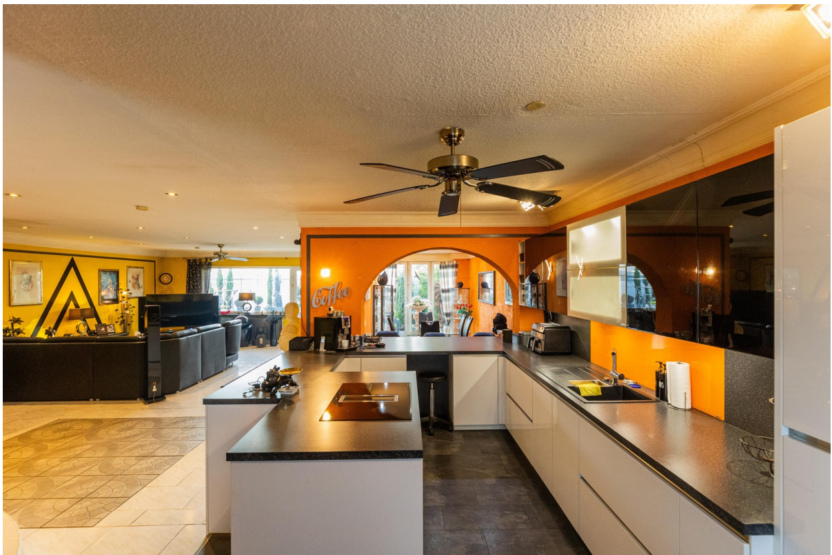
Küche Blick Wohnzimmer Esszi.