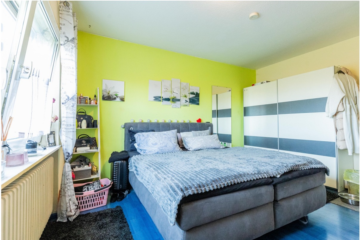
Schlafzimmer Wohnung Links