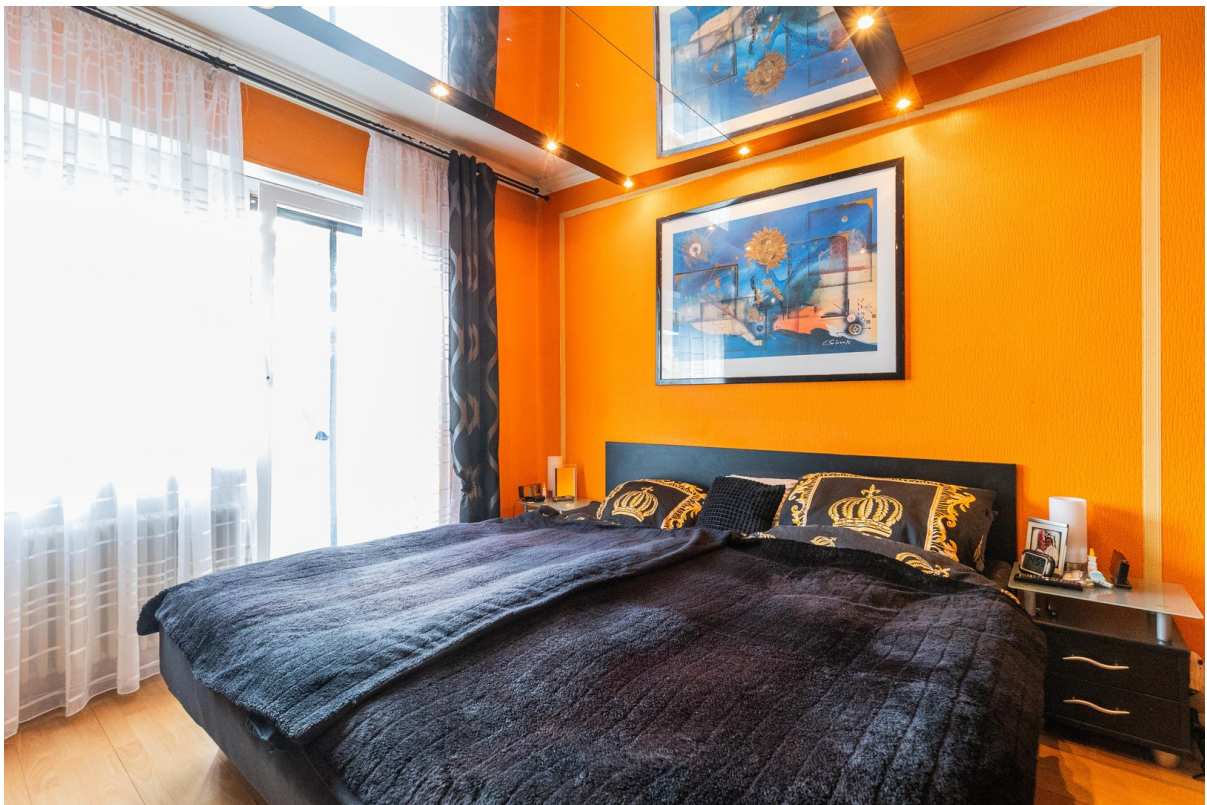
Schlafzimmer Ausg. Terrasse