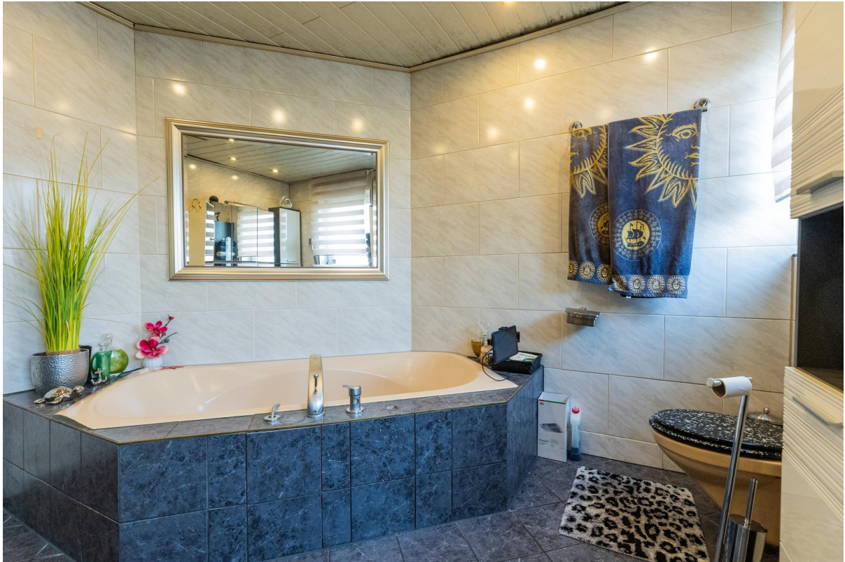
Bad rechte Wohnung