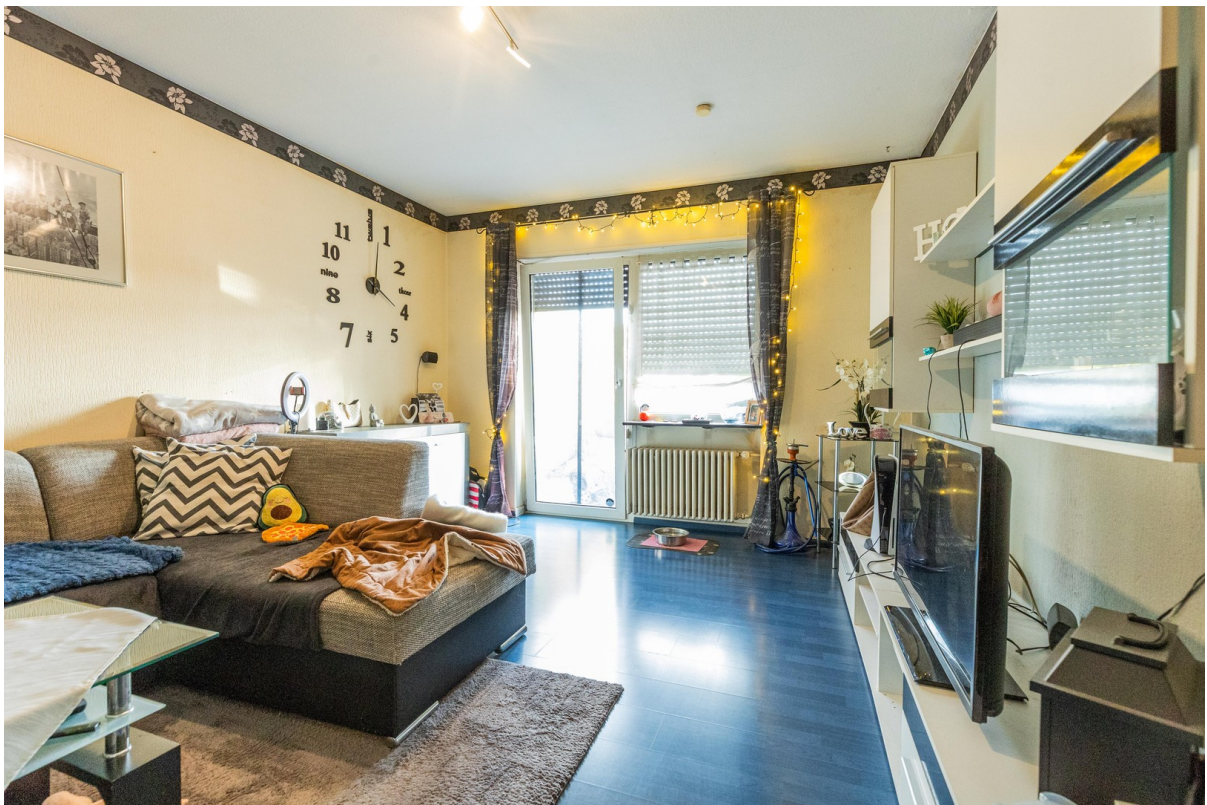
Wohnzimmer linke Wohnung