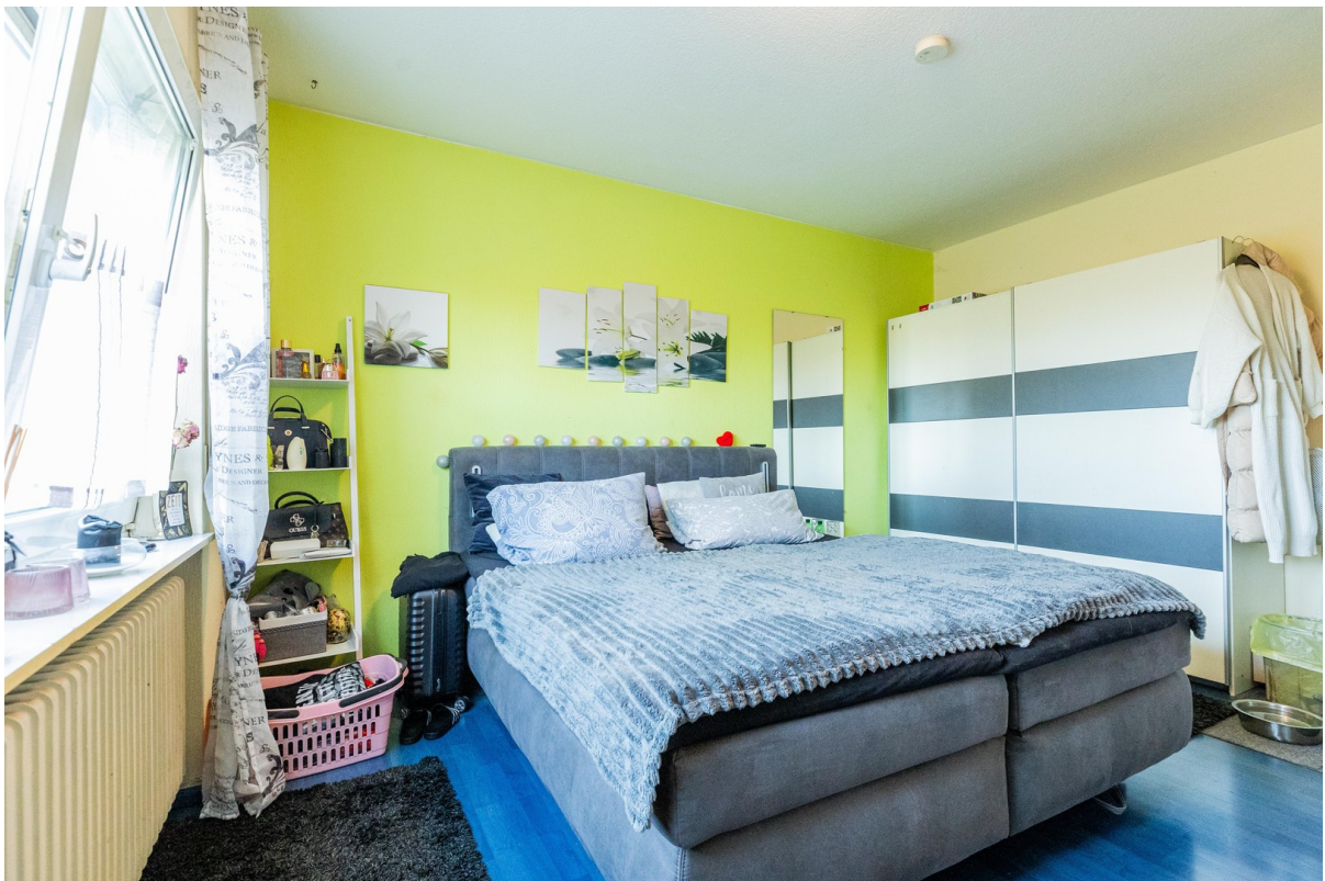
Schlafzimmer linke Wohnung