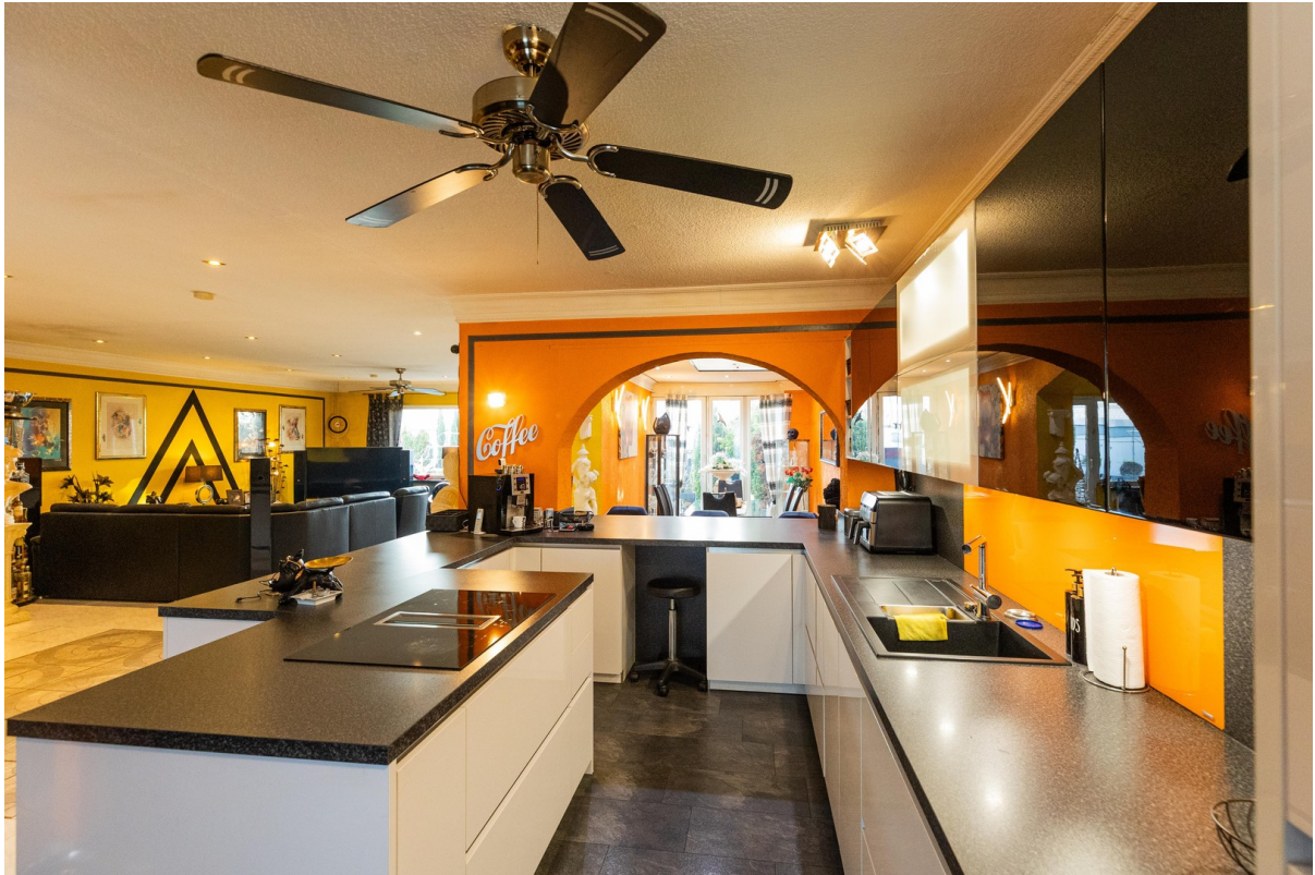
O Küche Blick in Wohn u.Esszi