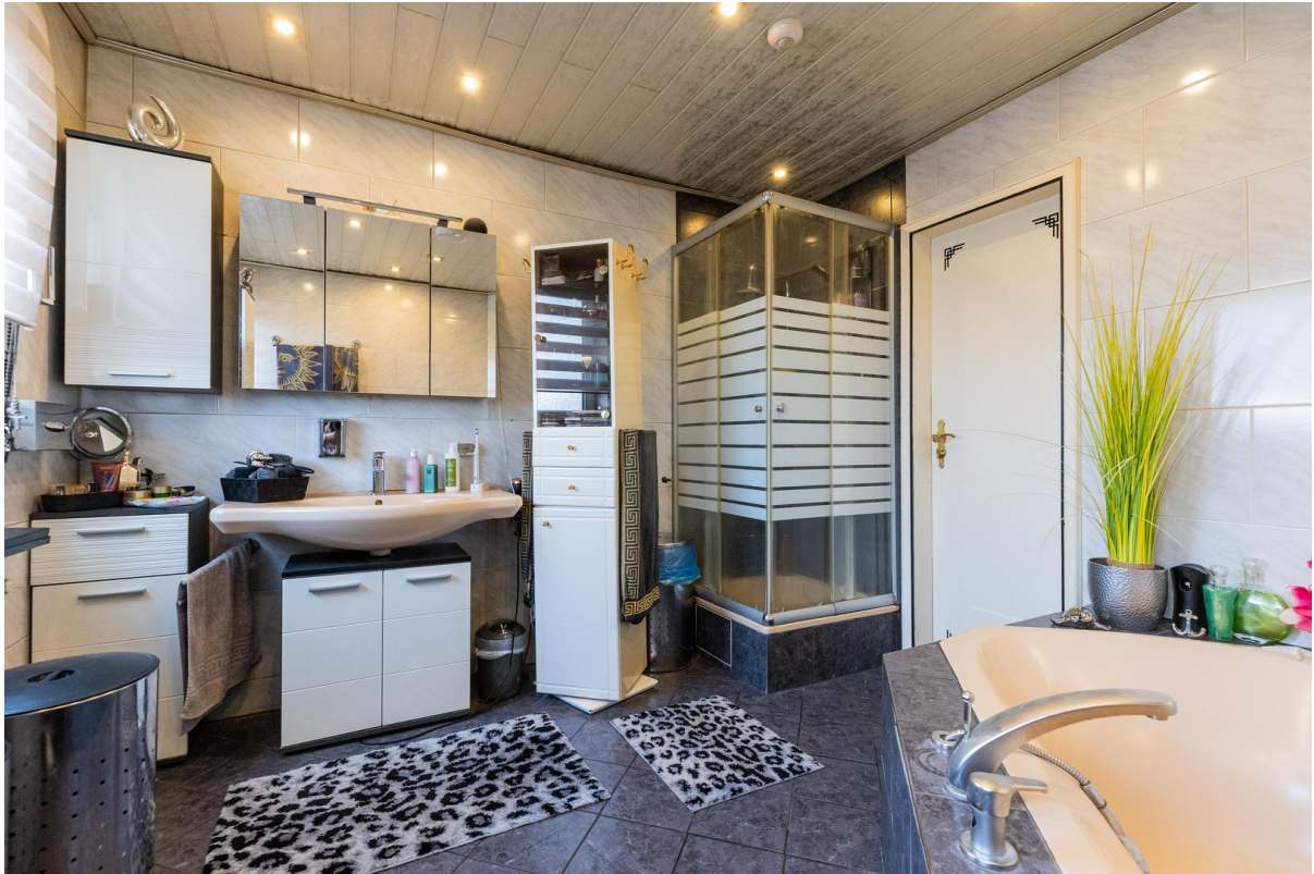
Bad rechte Wohnung