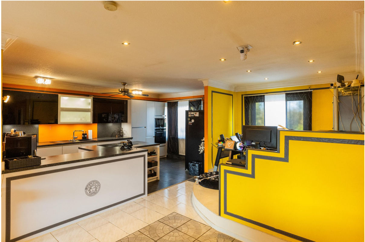
Blick in Küche u. H Office