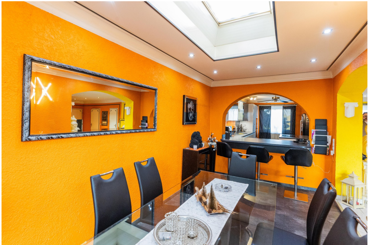
Esszimmer Blick in Küche