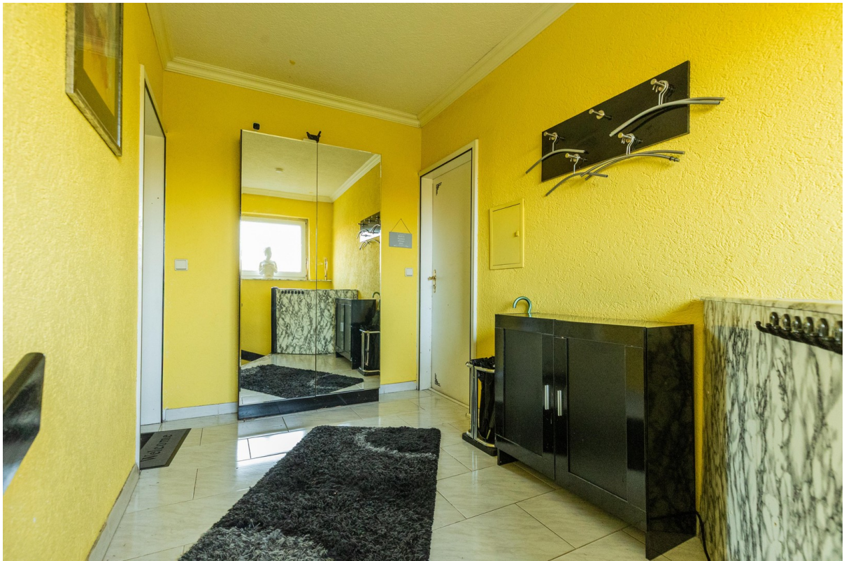
Flur Eingang Links u. Rechts