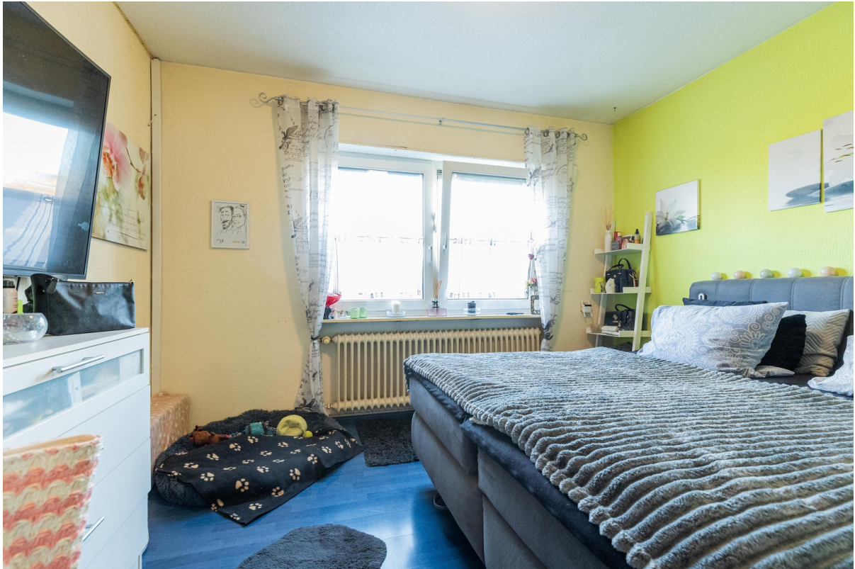
Schlafzimmer linke Wohnung