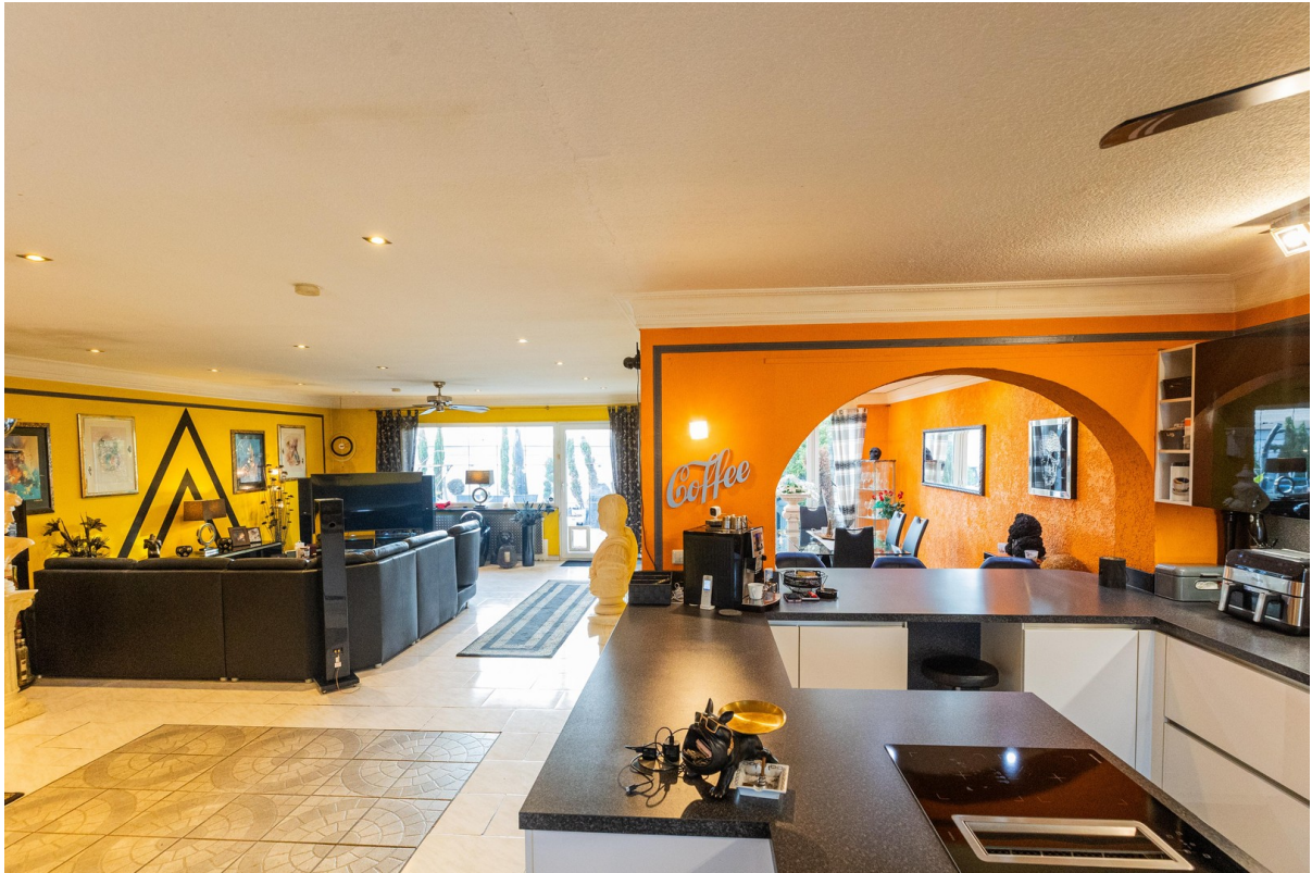
Von Küche in Wohn u Esszimmer