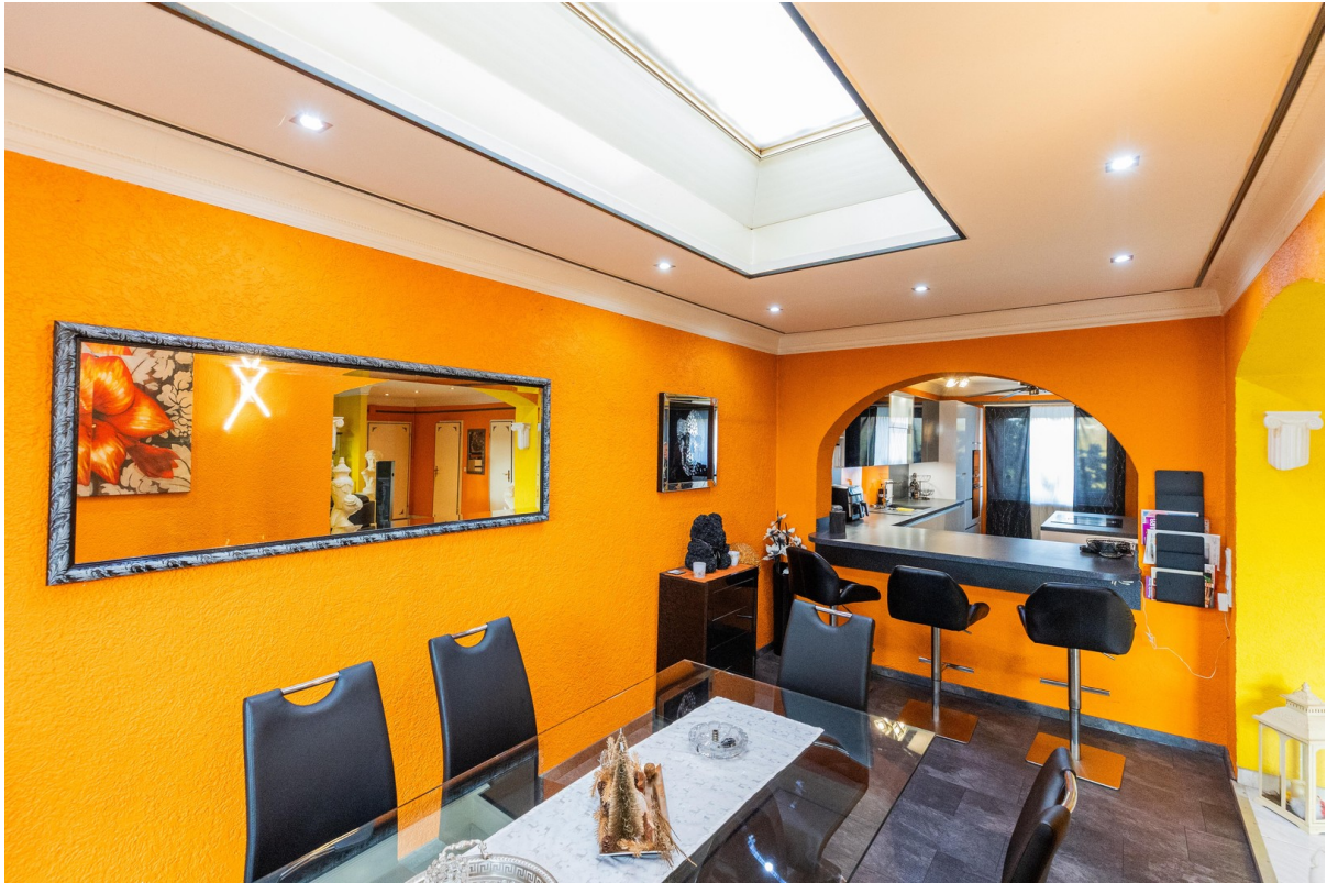
Esszimmer Blick in Küche