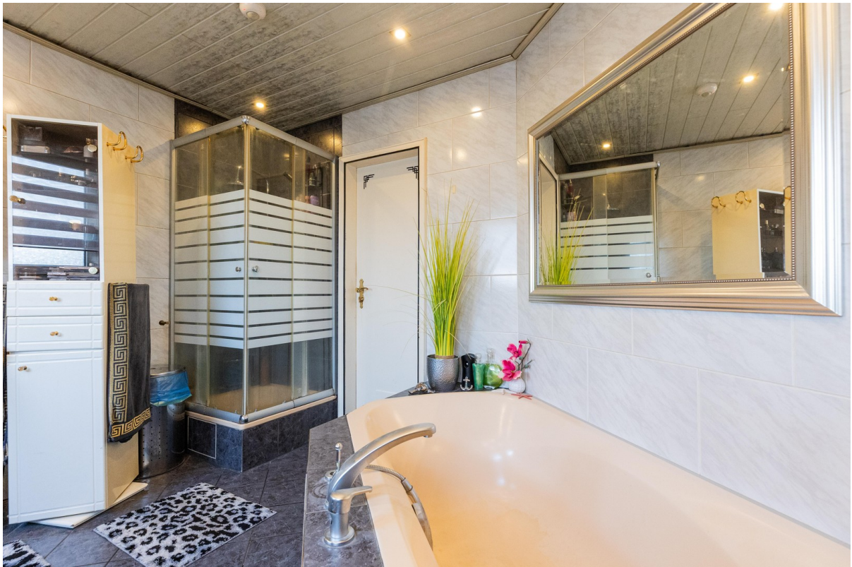
Bad rechte Wohnung