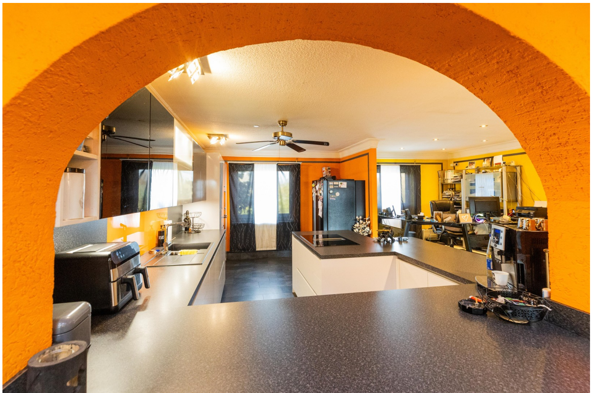
Blick in Küche