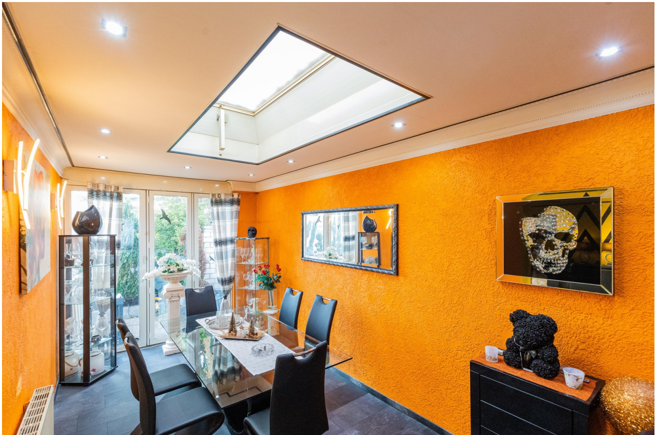
Esszimmer Ausgang Terrasse