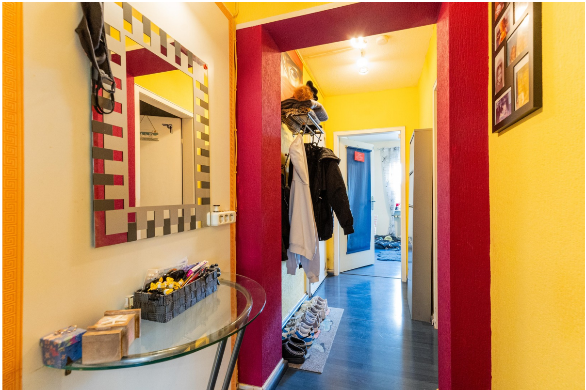
Flur linke Wohnung