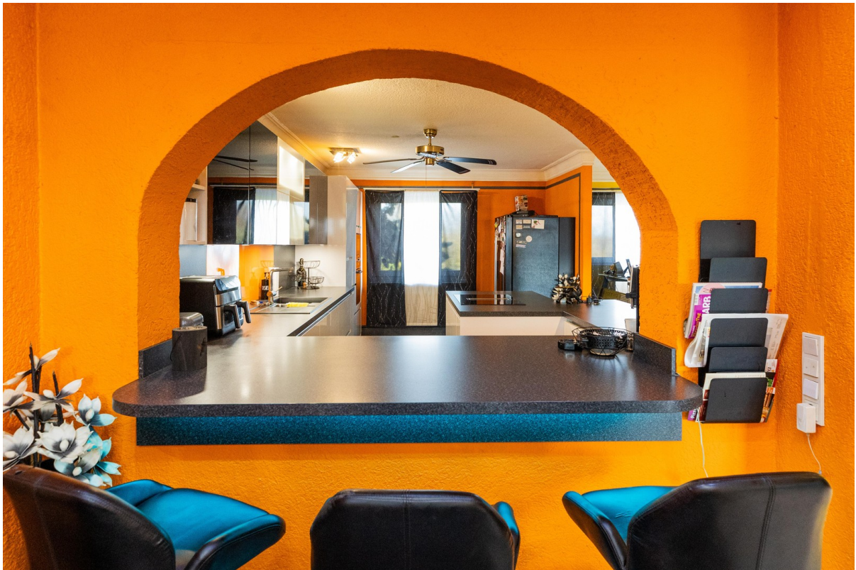
Esszimmer Theke Blick in Küche