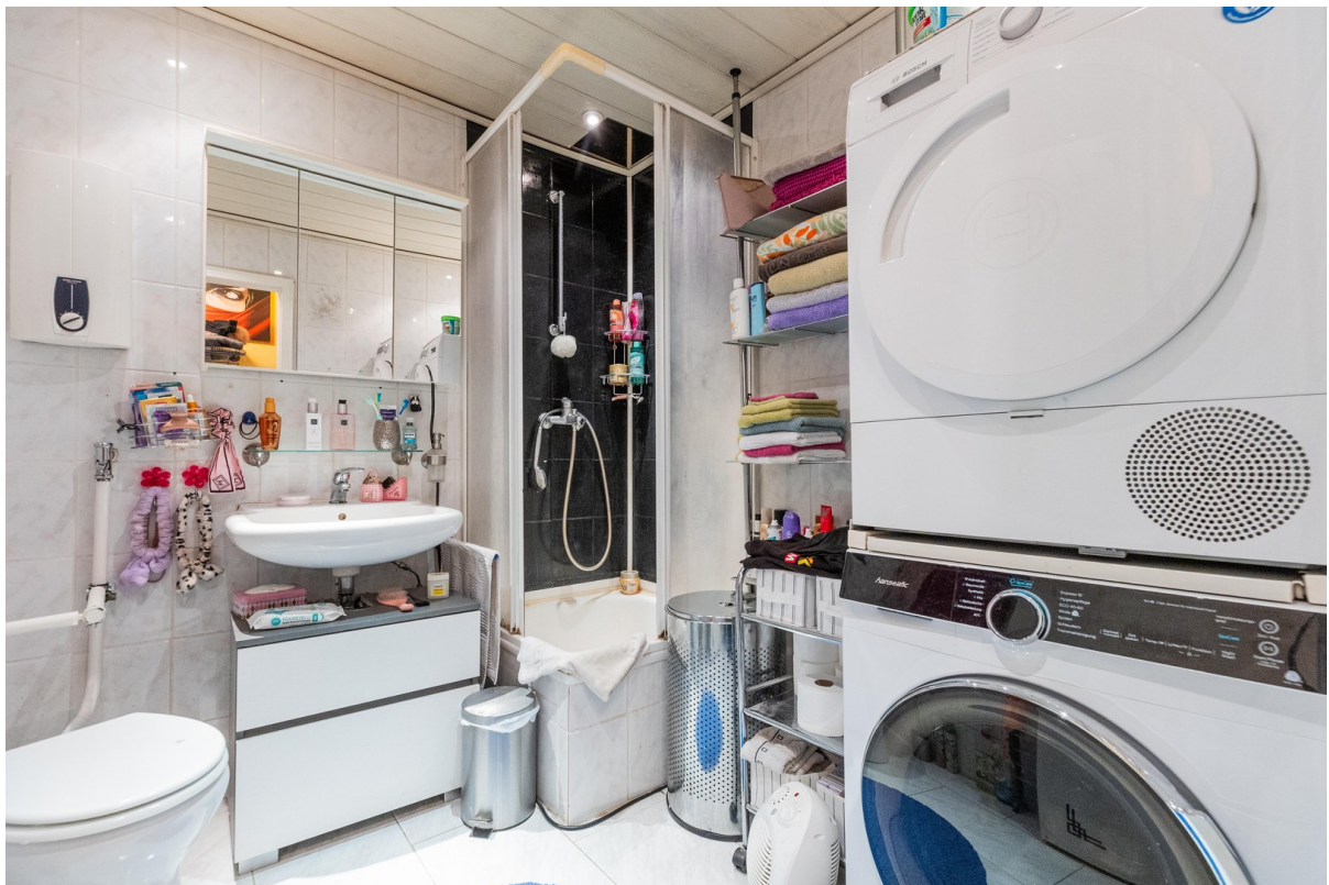
Bad linke Wohnung