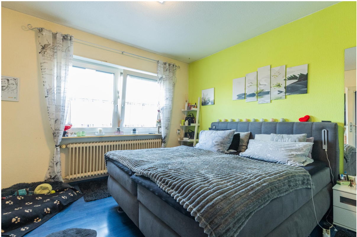
Schlafzimmer Wohnung Links