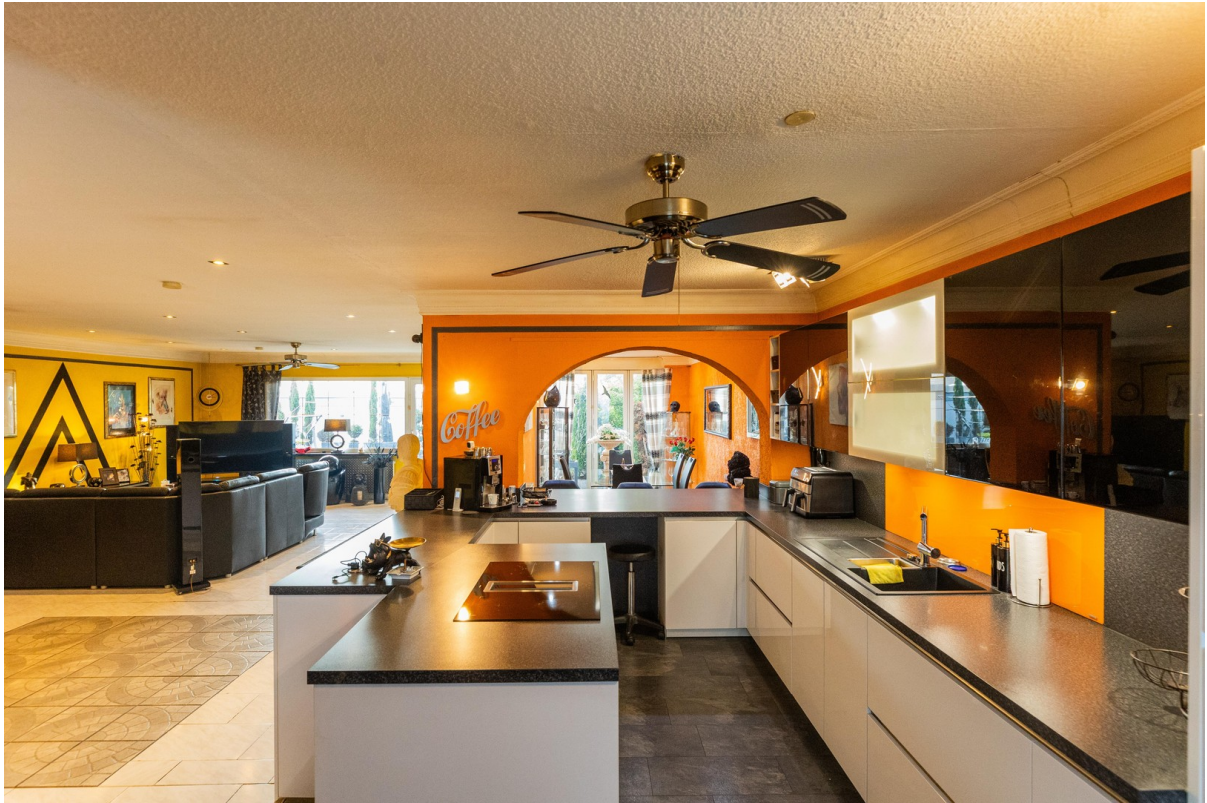
Küche Blick Wohnzimmer Esszi.