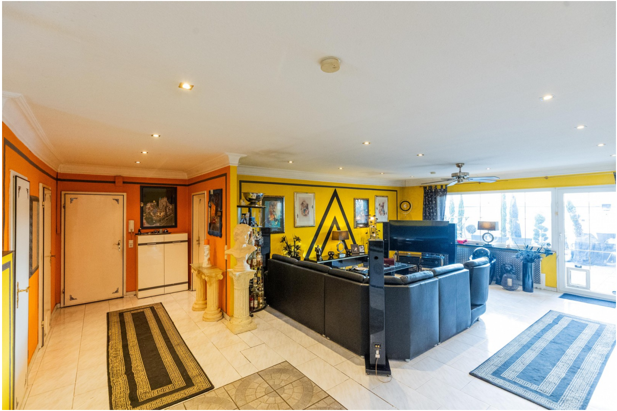
Eingang Flur Wohnzimmer