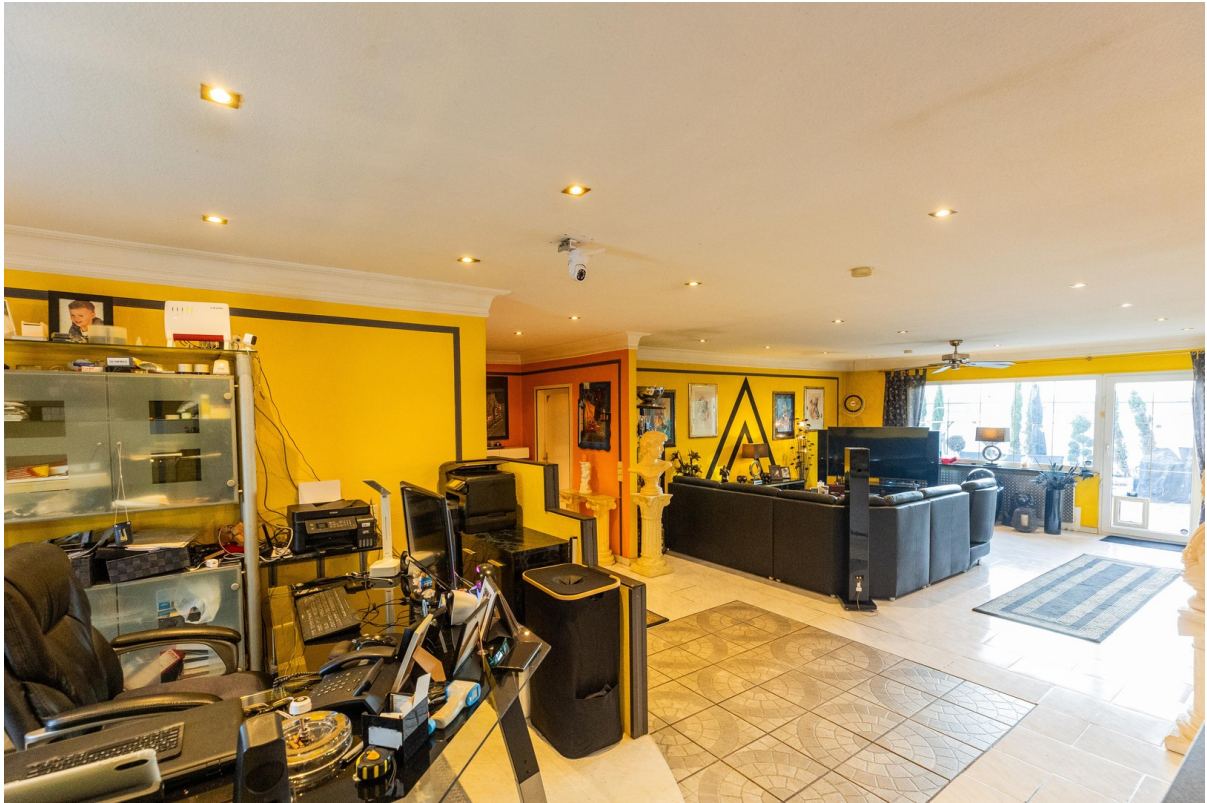
Blick H Office Flur Wohnzimmer