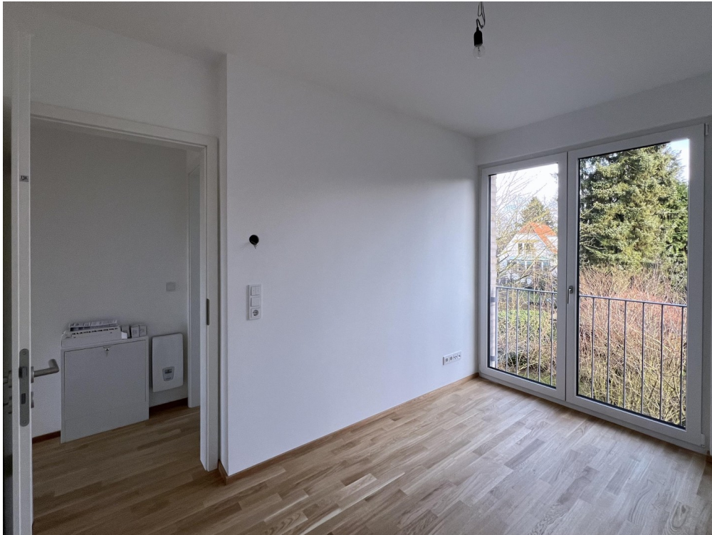
Zimmer Ost OG