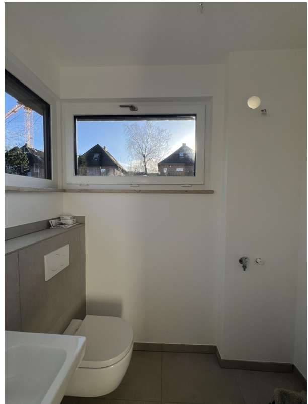
Gäste WC / Hauswirtschaft EG