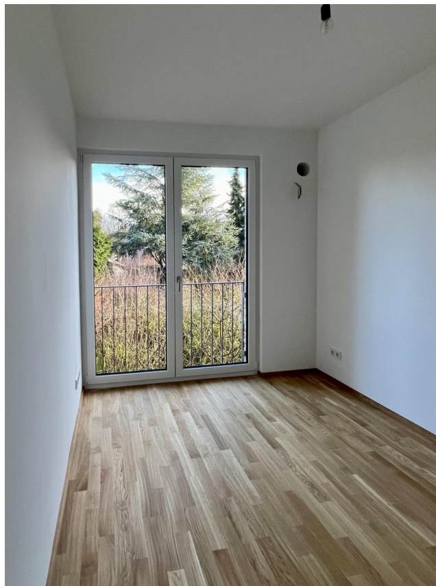
Zimmer Ost OG