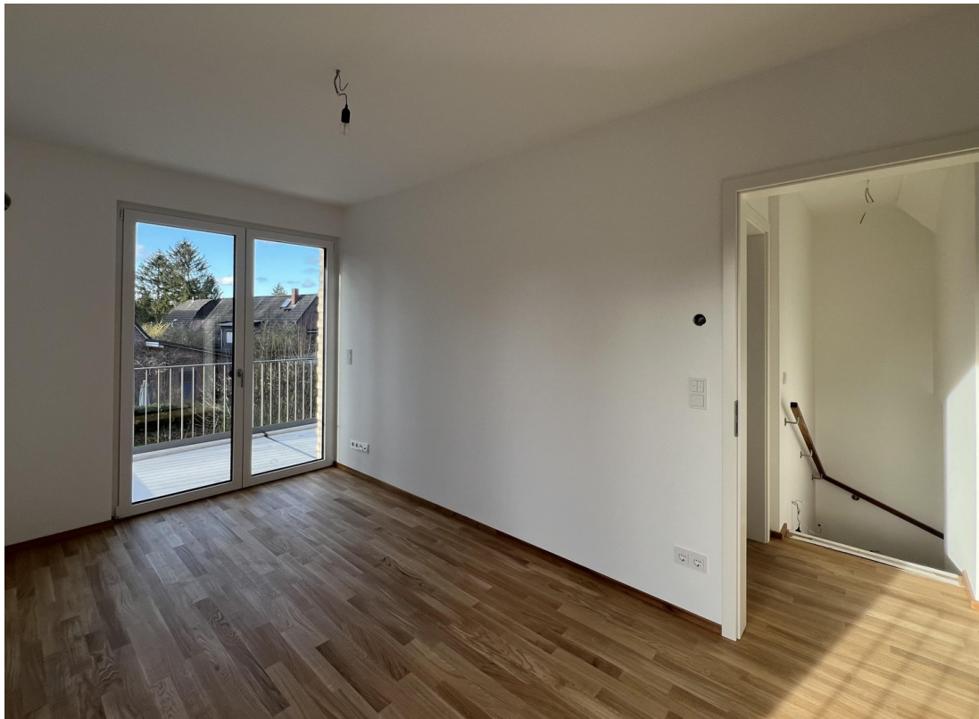
Zimmer Süd West OG