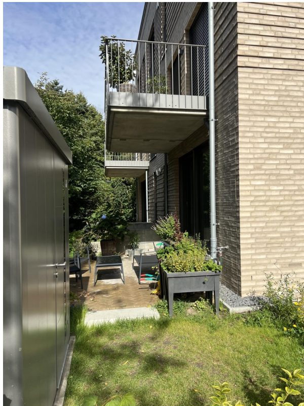
Terrasse mit Gartenhaus