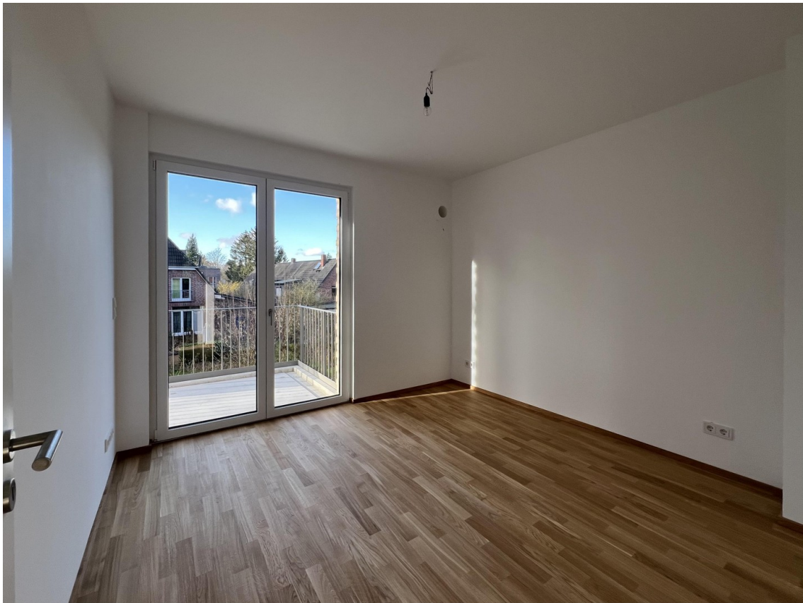
Zimmer West OG