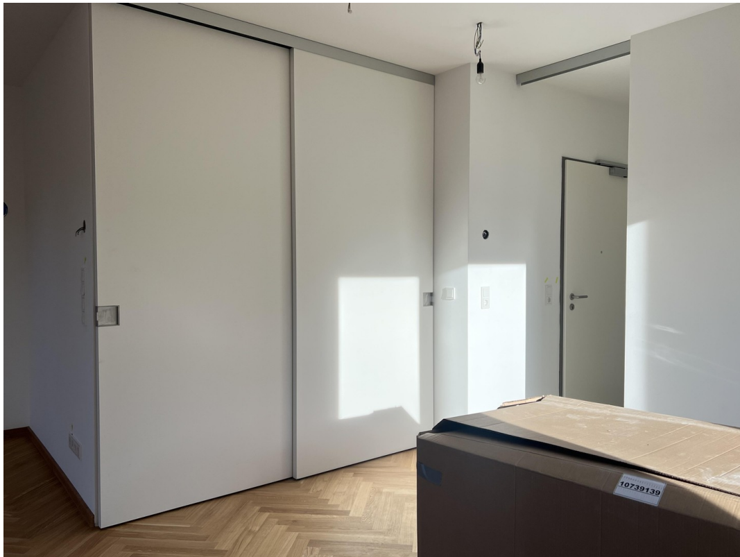
Schiebetür Treppe EG