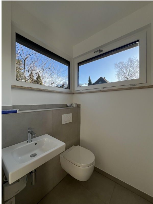
Gäste WC / Hauswirtschaft EG