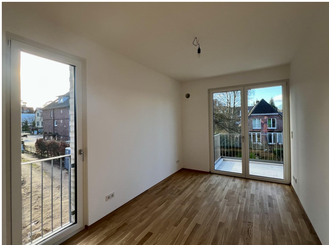
Zimmer Süd West OG