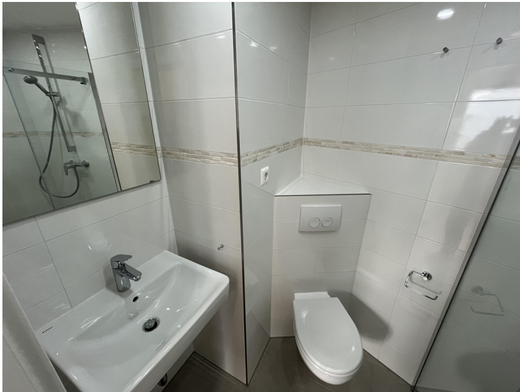
Studio 8 Badezimmer