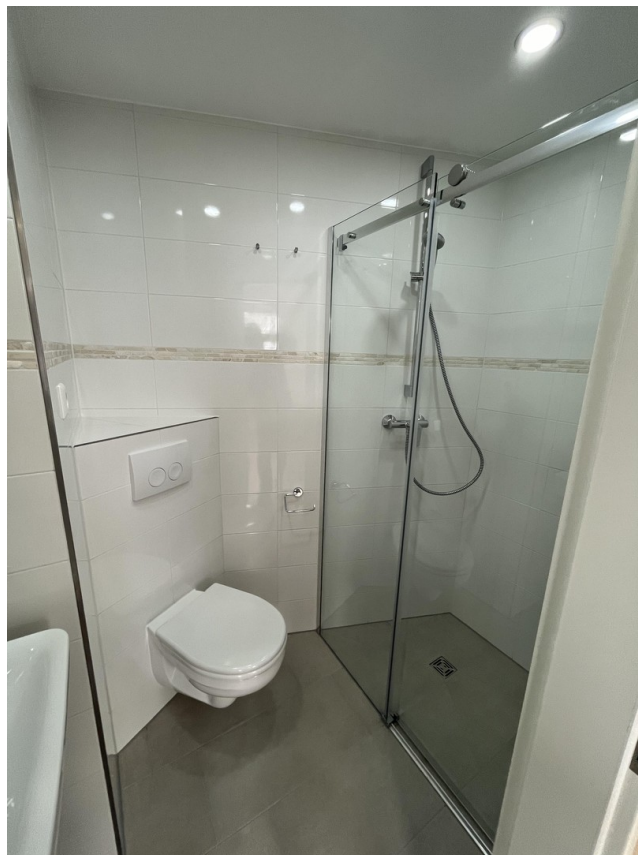
Studio 8 Dusche