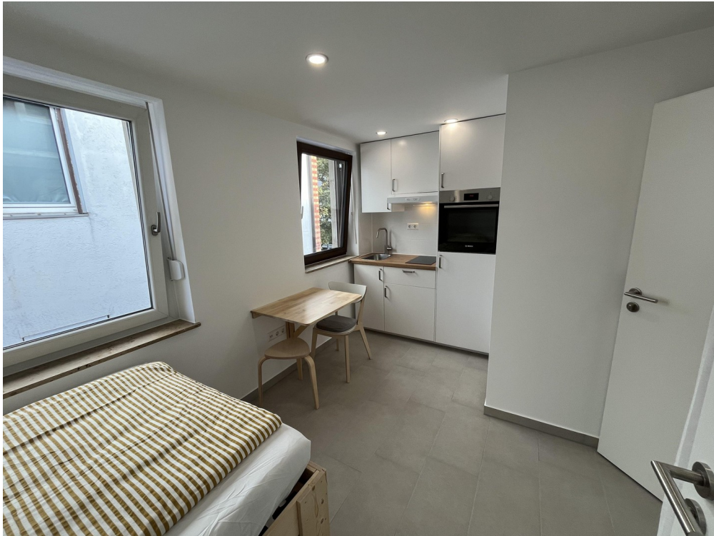
Studio 8 Essbereich + Küche