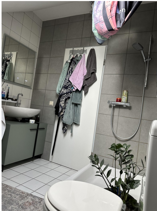
II. Foto Badezimmer