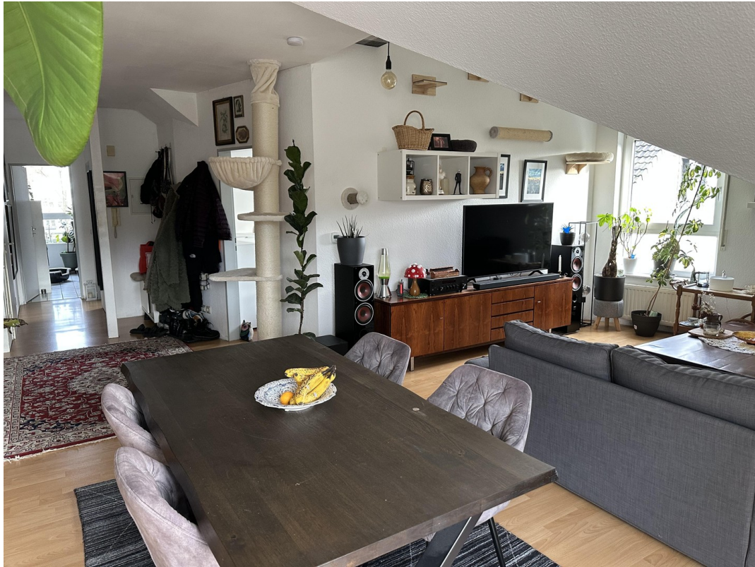
I. Foto Wohn- Esszimmer