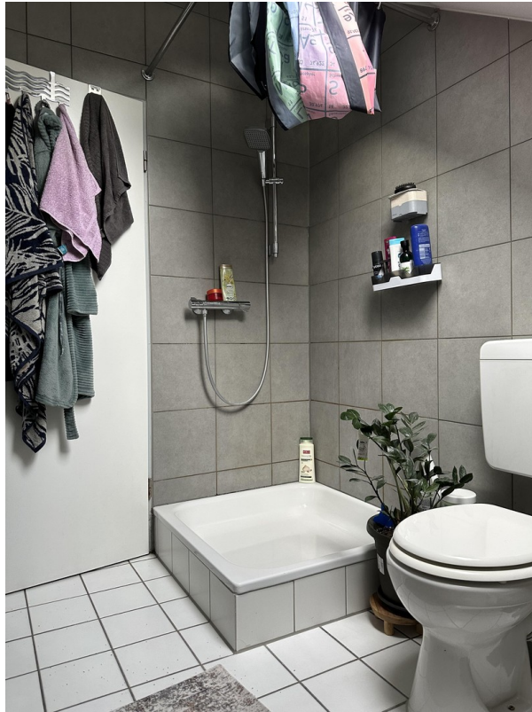
I. Foto Badezimmer