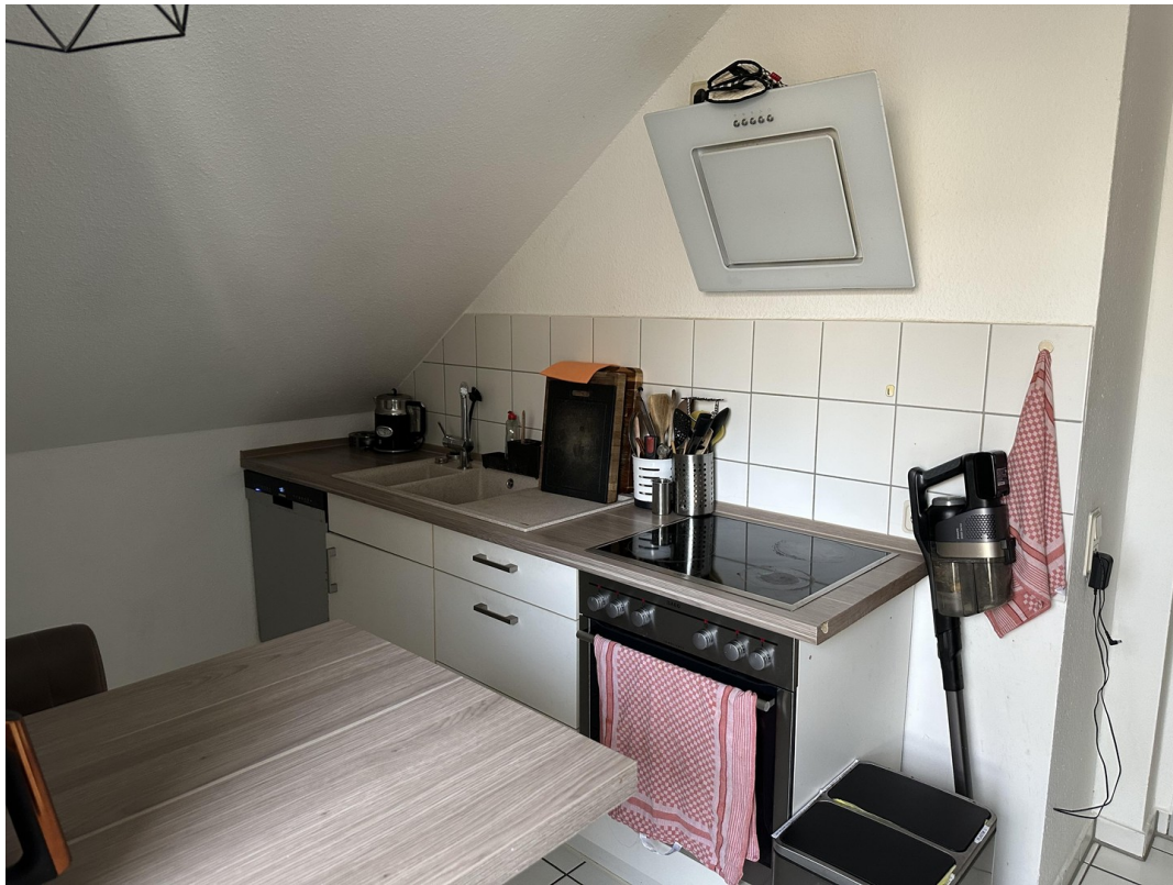
I. Foto Küche