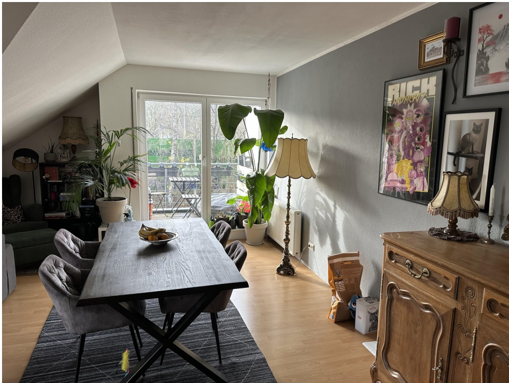
III. Foto Wohn- Esszimmer