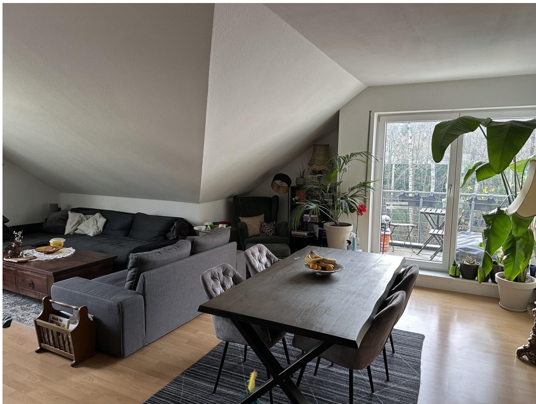
II. Foto Wohn- Esszimmer