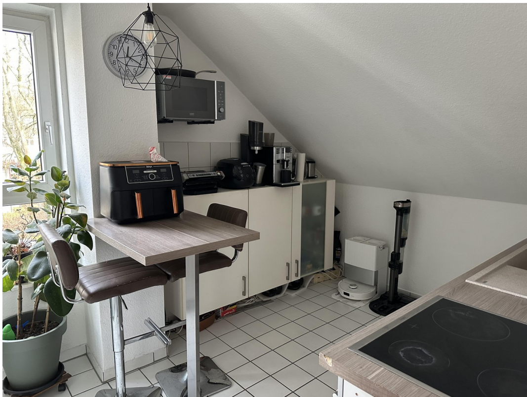
II. Foto Küche