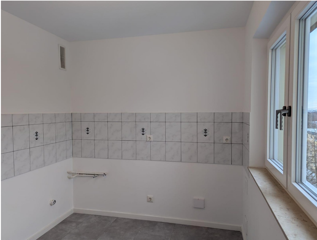
Küche zur freien Gestaltung