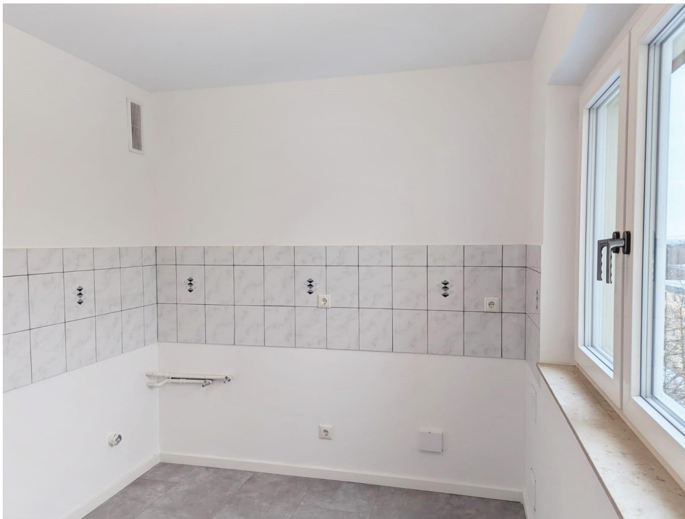
Küche zur freien Gestaltung