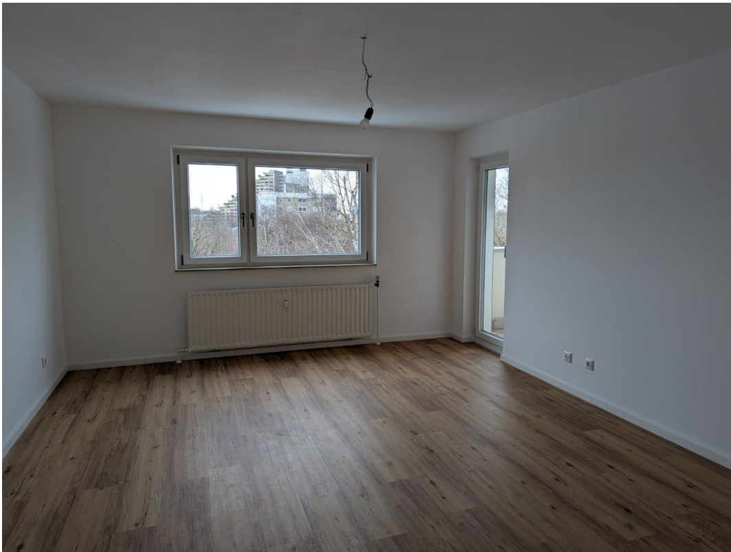
Wohnzimmer mit Loggia Zugang