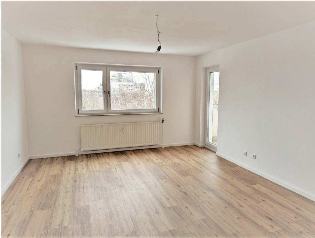
Wohnzimmer mit Loggia Zugang