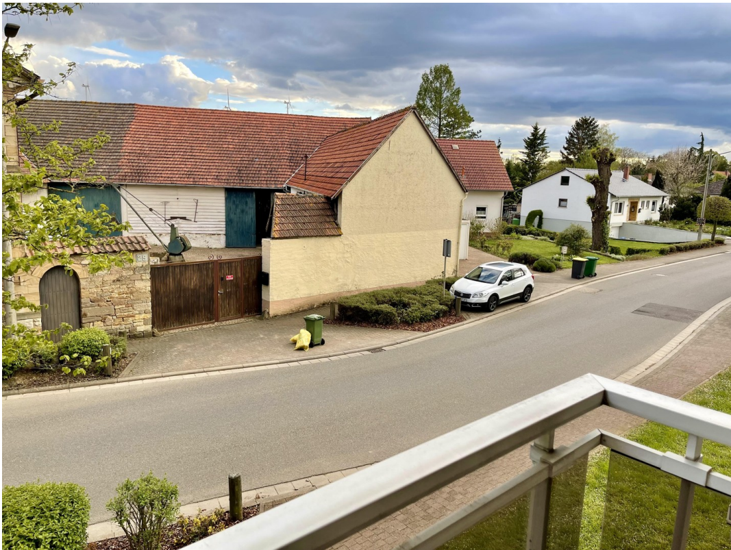
Balkon Blick Richtung Ort