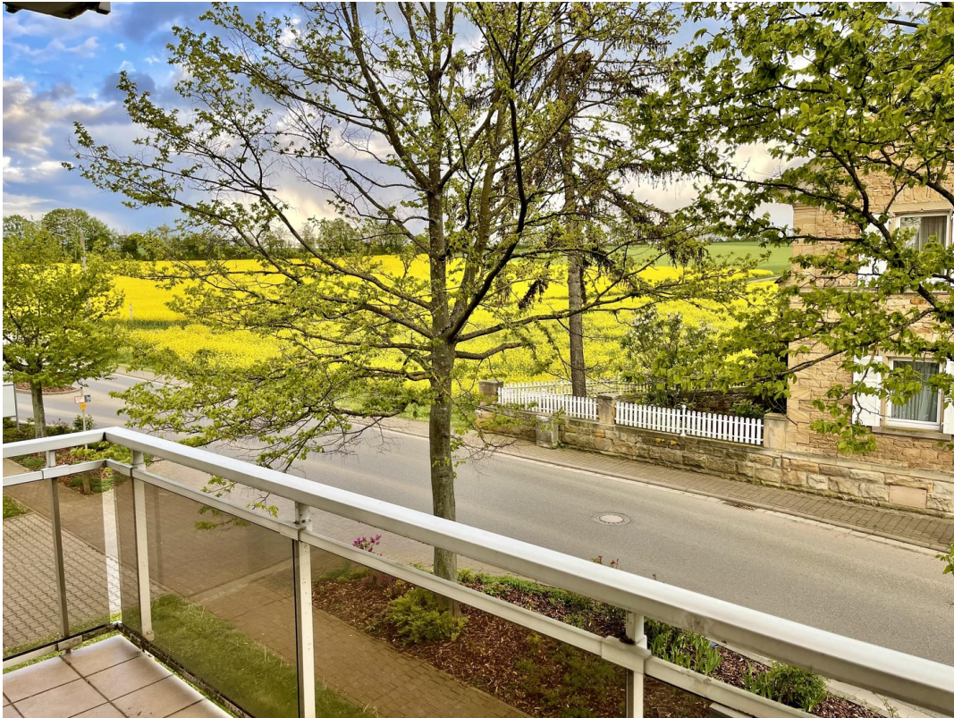
Balkon Blick Richtung Feld