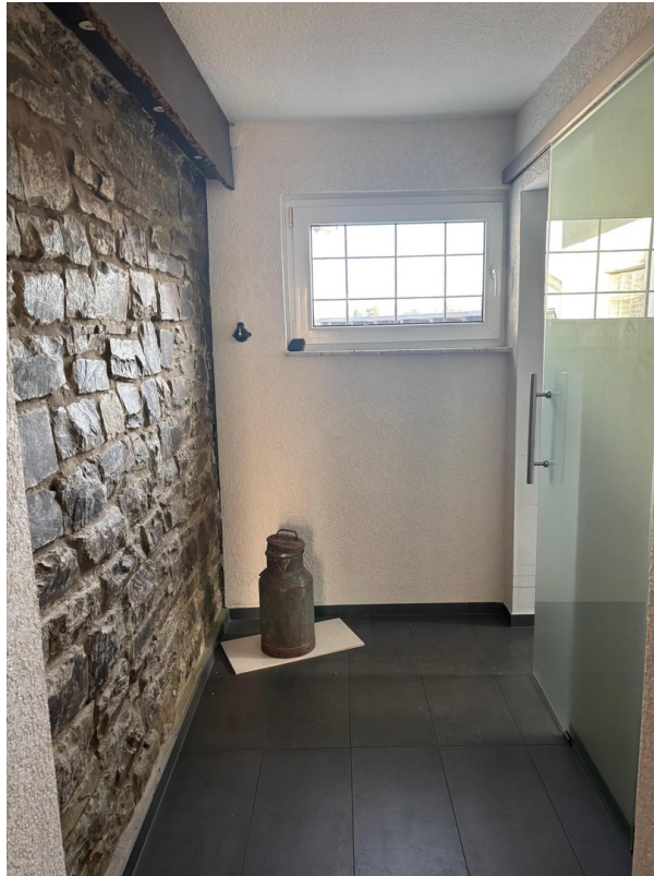
Flur zum Bad