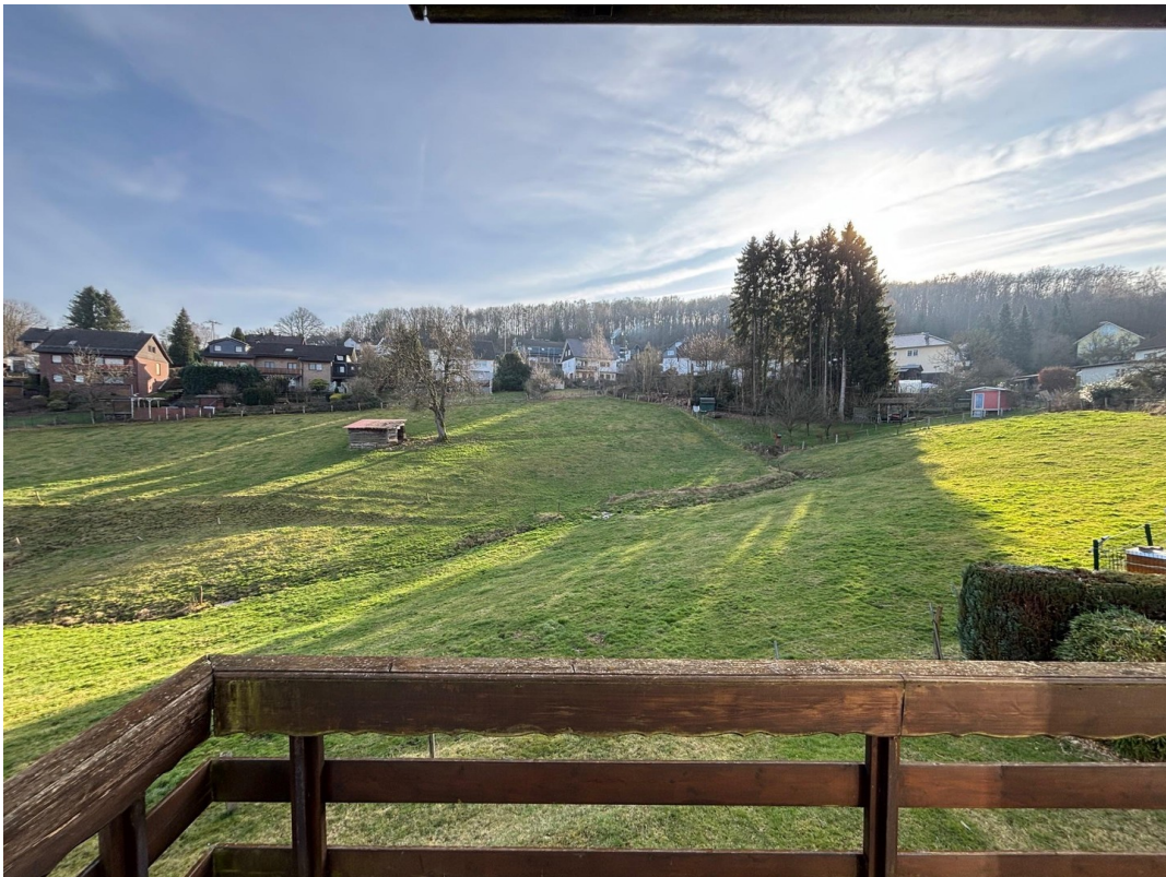
Aussicht Balkon Wohnzimmer