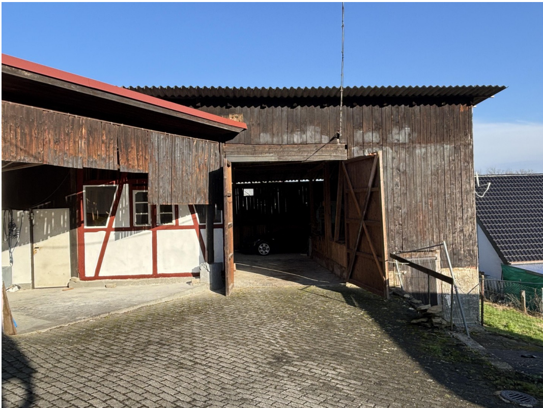
Scheune und Remise