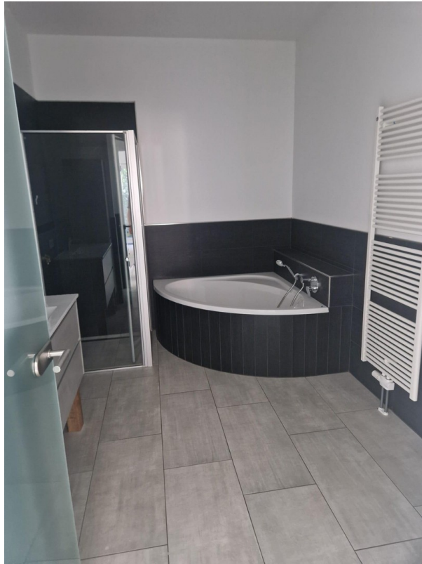
Grosses Bad mit Badewanne