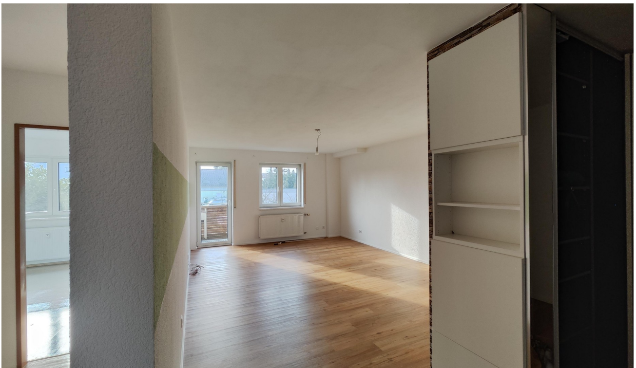
Flur + Wohn