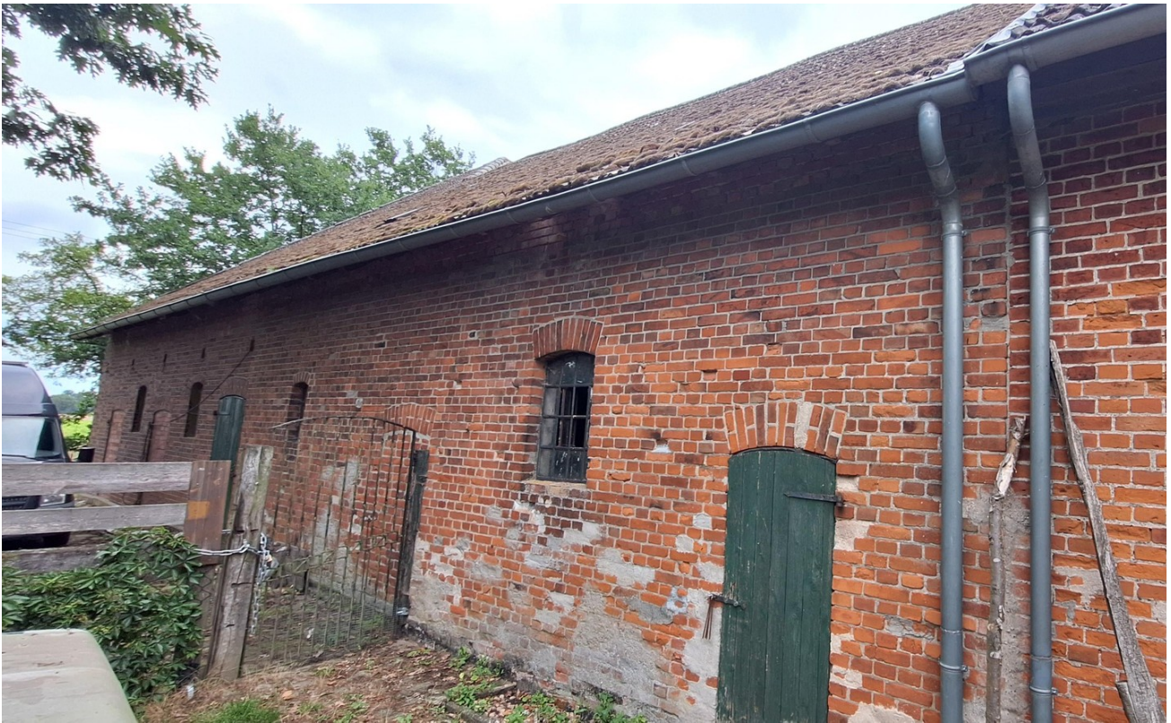
Scheune Gartenseite Einfahrt