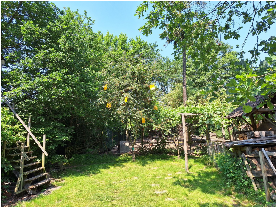
Baumhaus und Hühnerauslauf