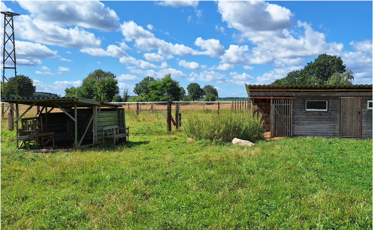
Stall mit Weide