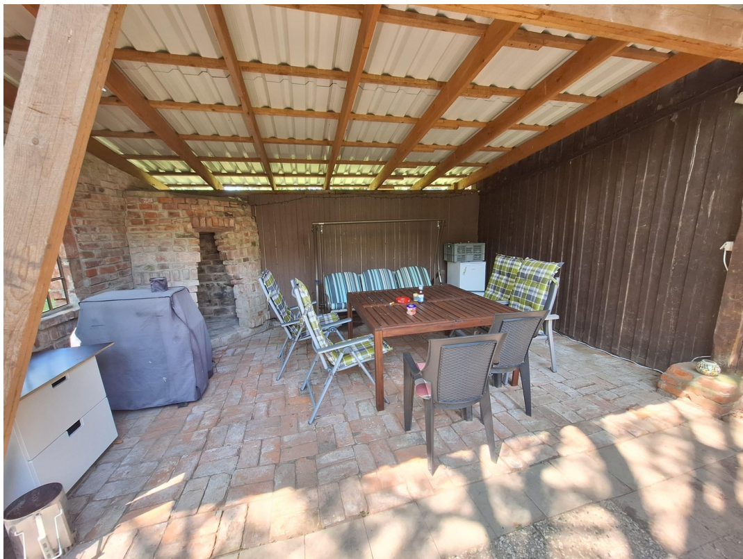
Sitzecke bei Scheune