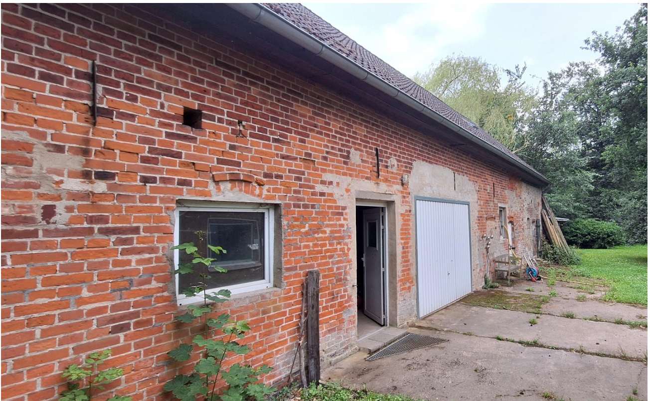
Scheune Gartenseite mit Garage