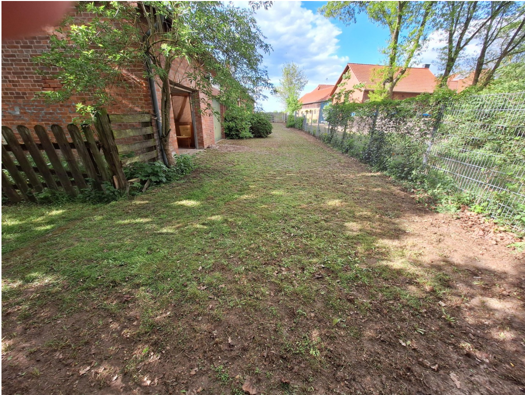
Wohnhaus Einfahrt und Garagen