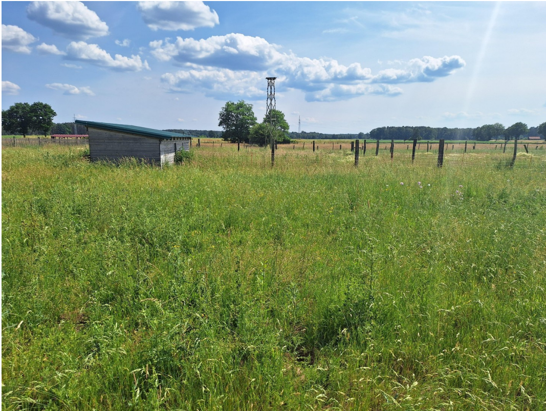
Weide mit Stall