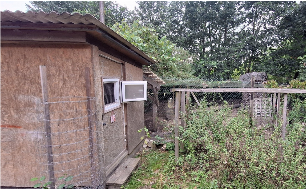
Hühnerstall und Hühnerauslauf