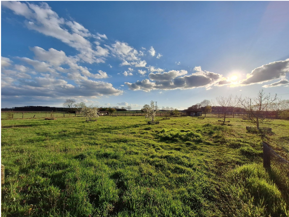
Obstwiese und Weide