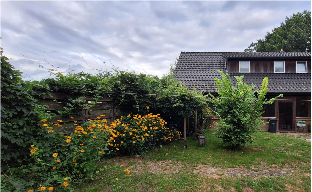
Innenhof Pergola Wintergarten