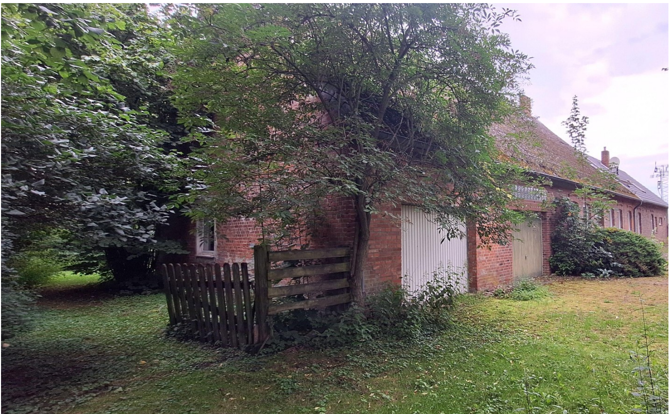
Wohnhaus Einfahrt und Garagen