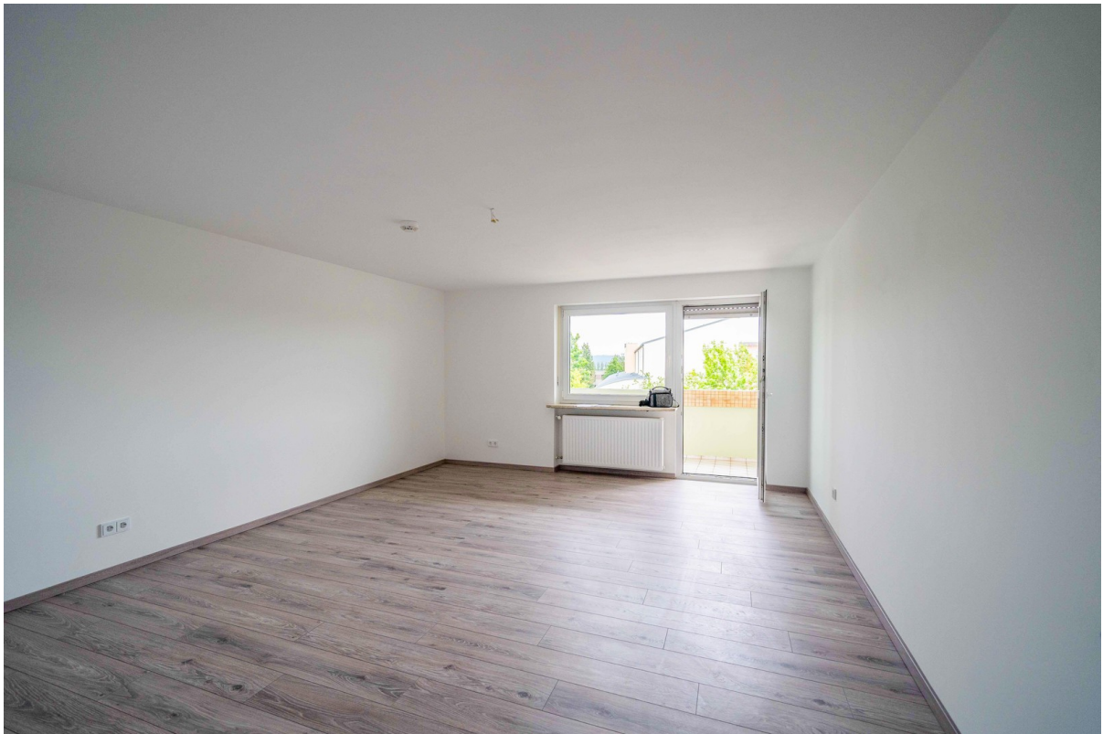
Zimmer 3 mit Loggia