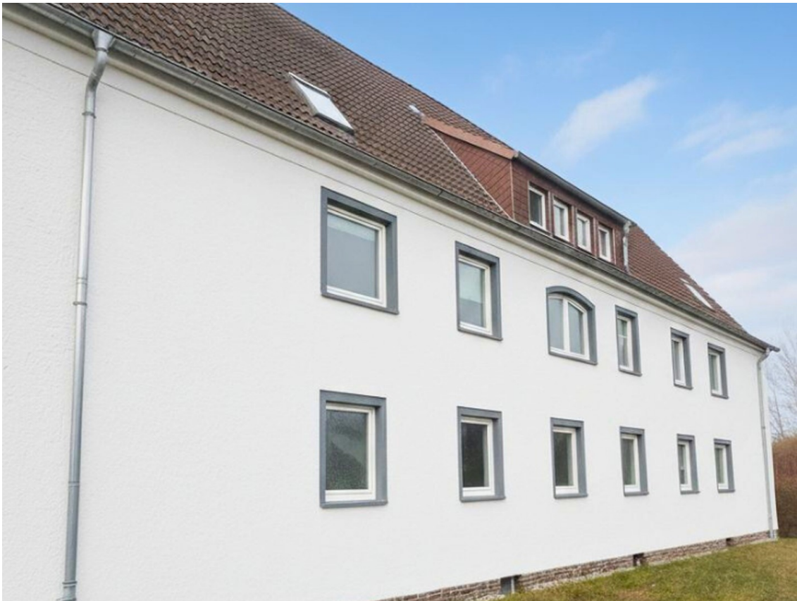
Haus Ansicht Seite