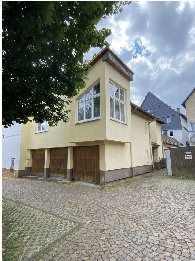
Anbau Bj. 1996