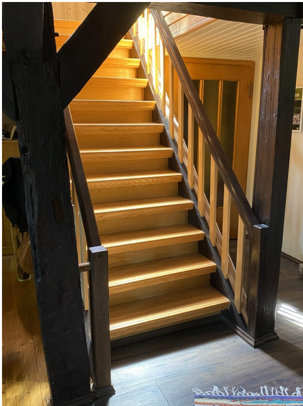
Treppe zw. 2.OG und DG