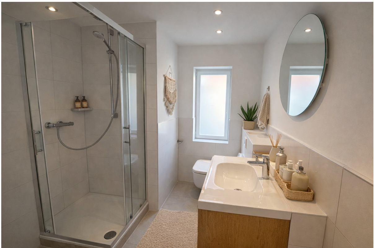
Badezimmer; KI generiert