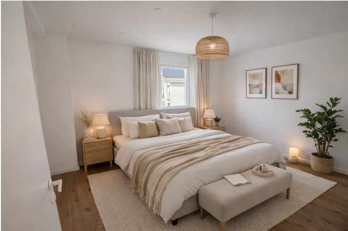
Schlafzimmer; KI generiert