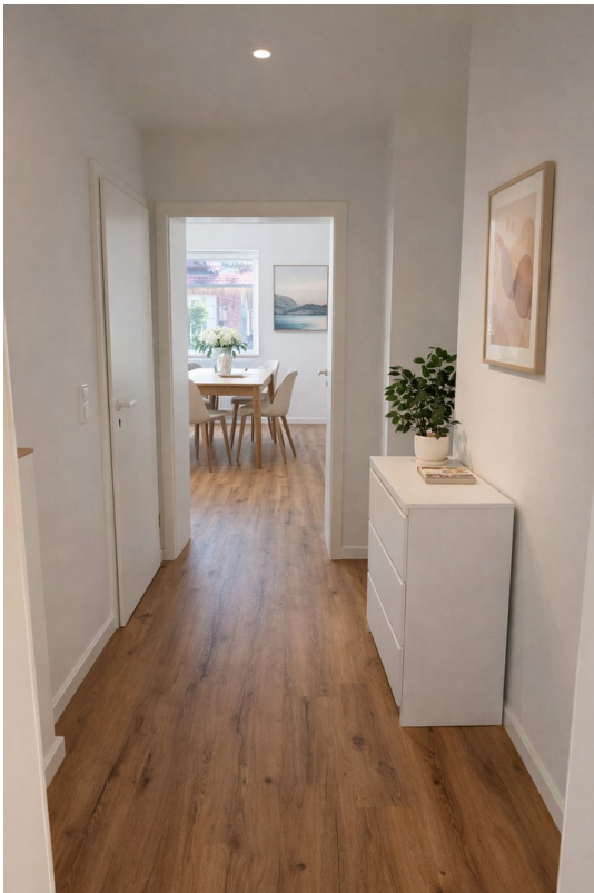
Flur; KI generiert