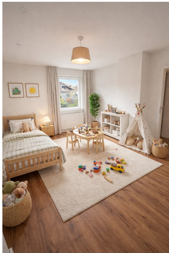
Kinderzimmer; KI generiert