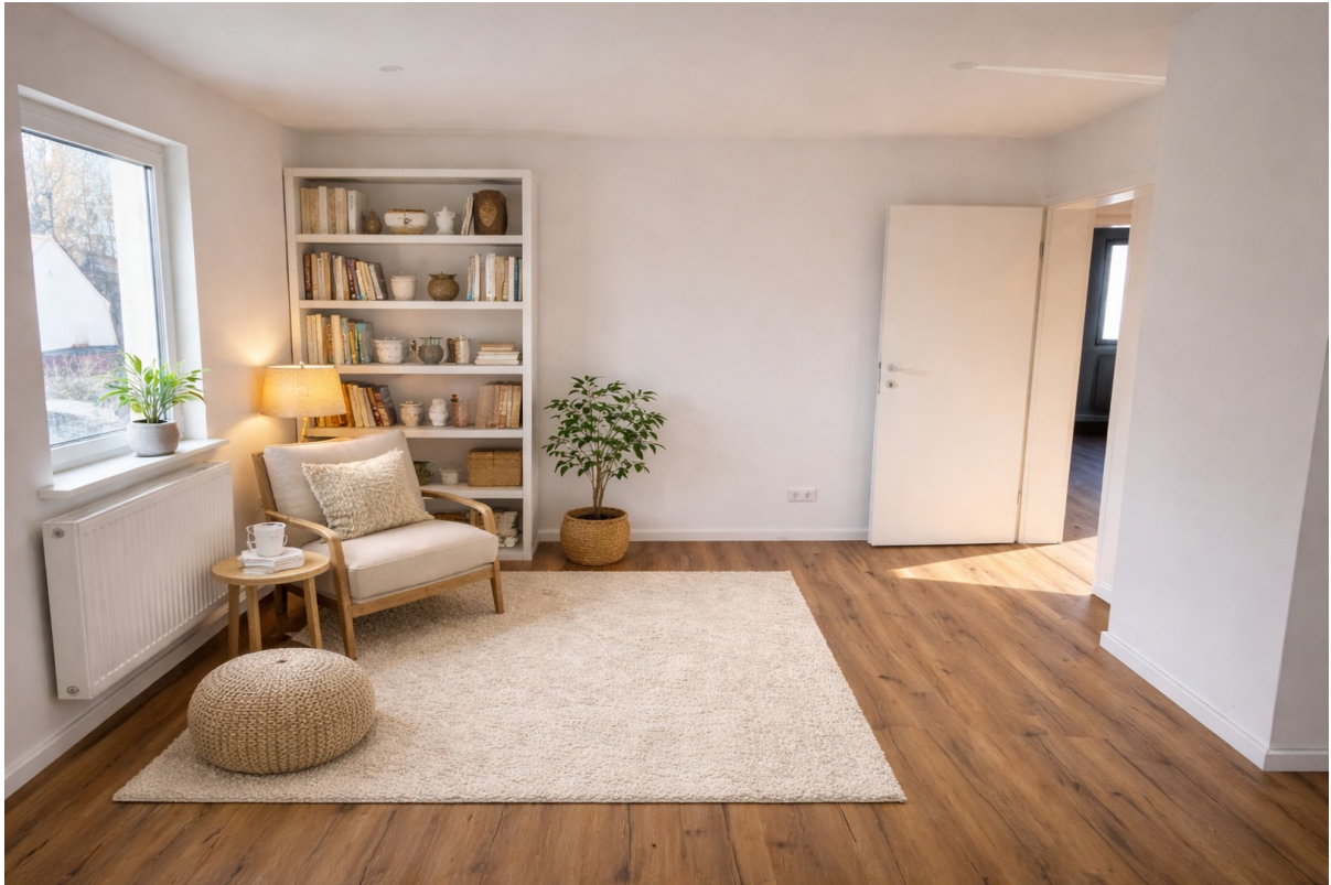
Lesezimmer; KI generiert