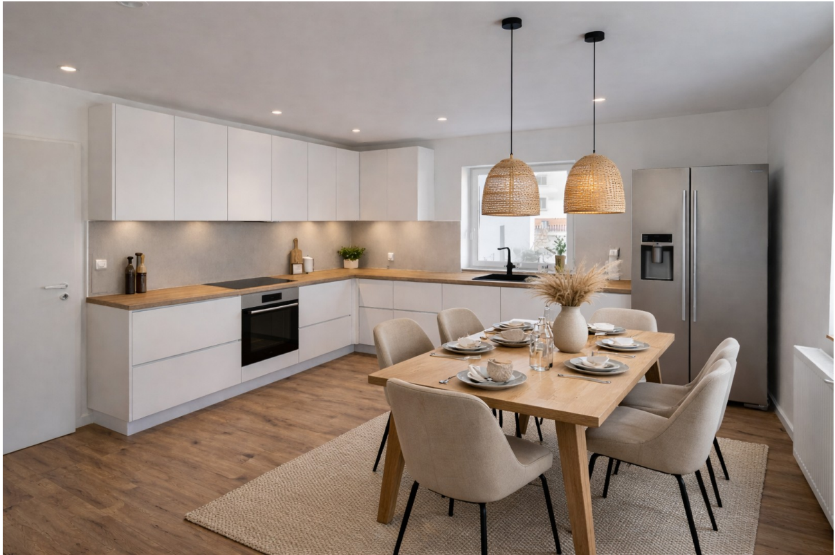
Küche; KI generiert