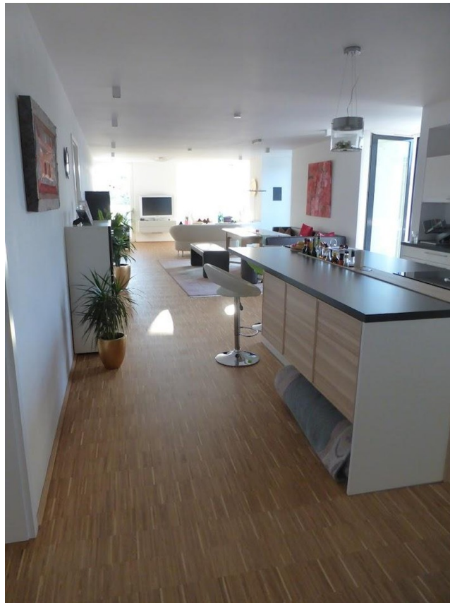
Flur Küche Ess-Wohnzimmer