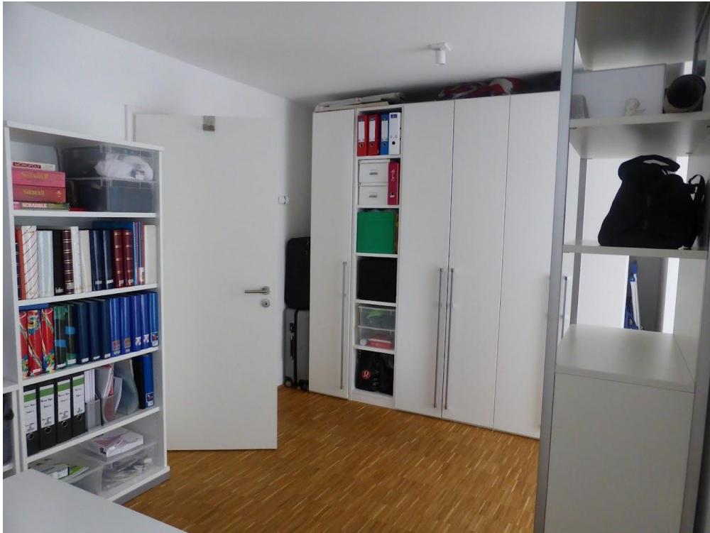
Büro / Kinderzimmer