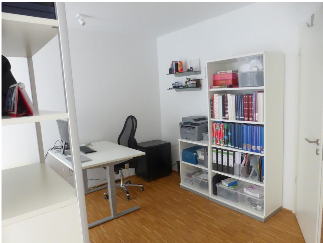
Büro / Kinderzimmer