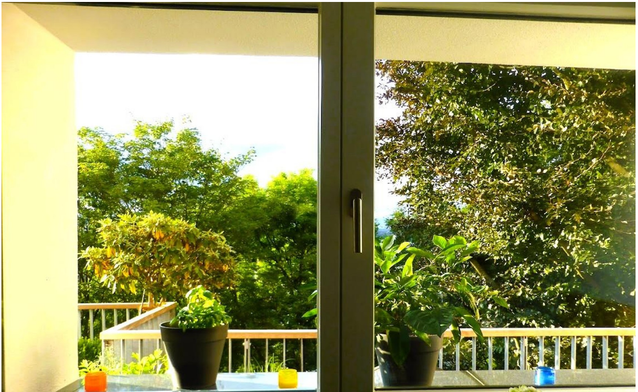
Ausblick aus der Küche