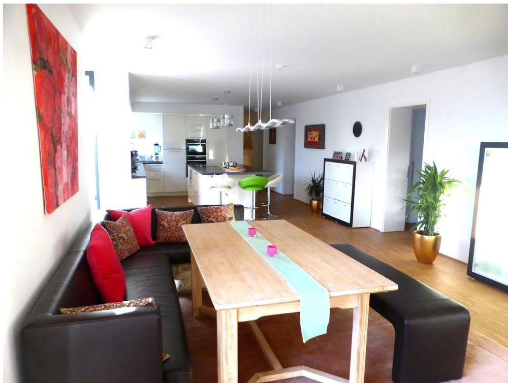
Esszimmer Küche Flur