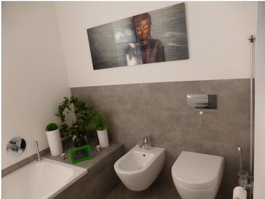
Badezimmer mit WC, Bidet