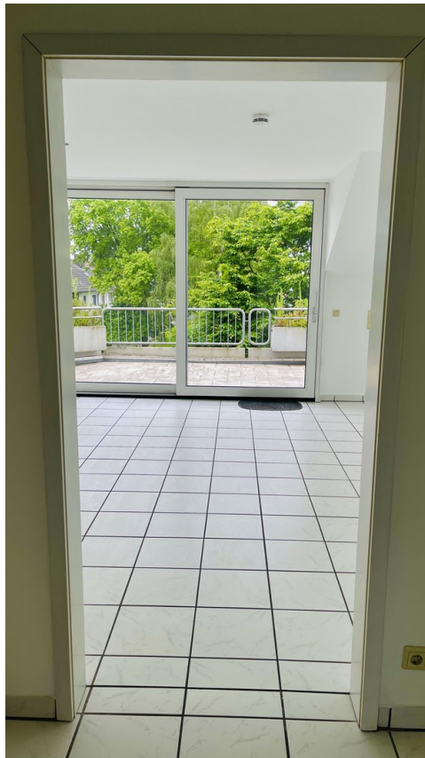
Blick ins Wohnzimmer