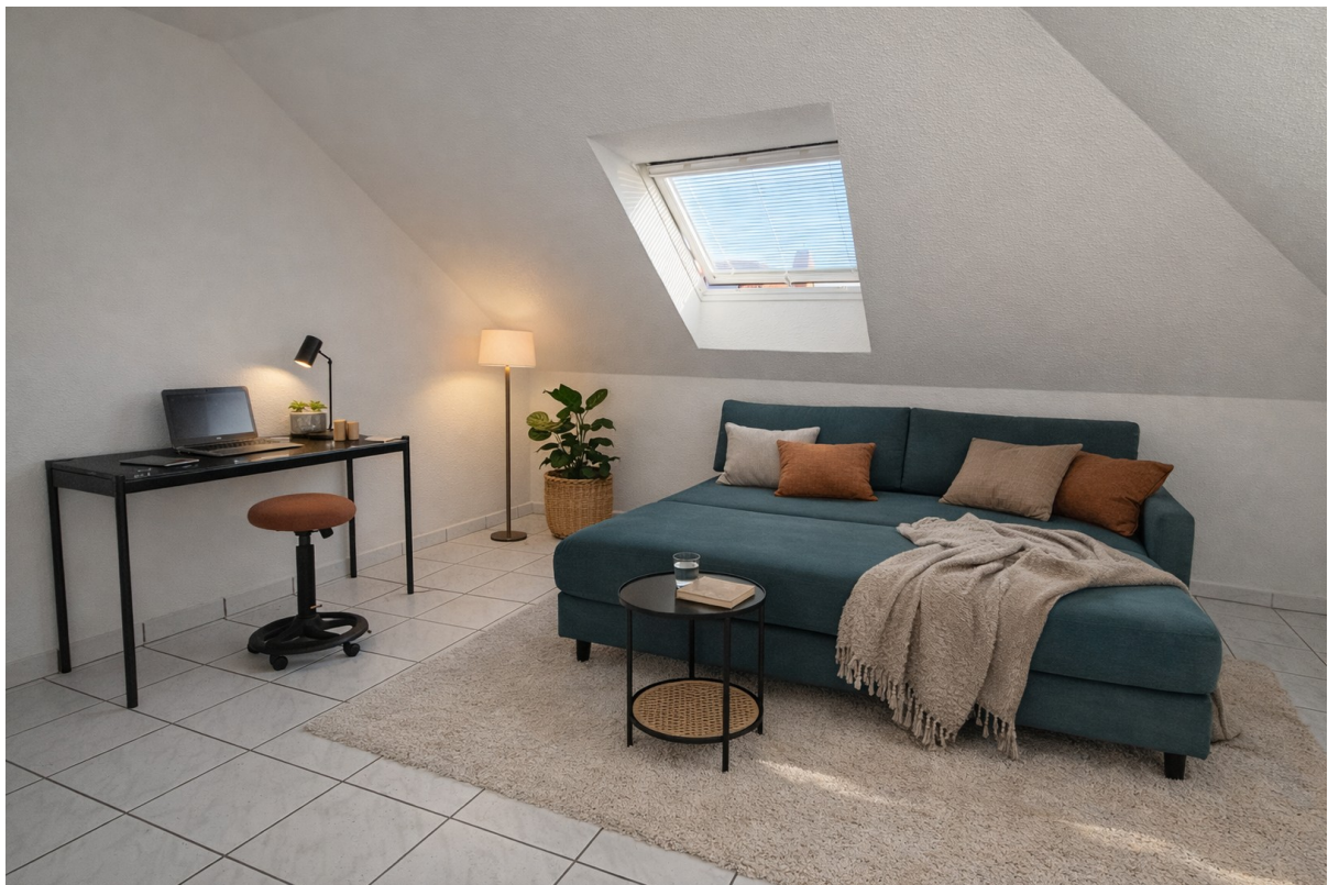
3. Zimmer - links Impression