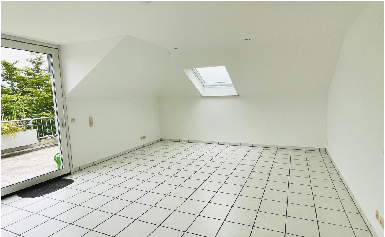
Wohnzimmer - rechts