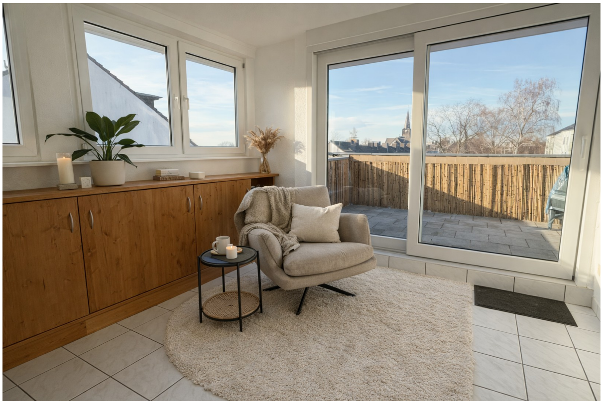
3. Zimmer - rechts Impression