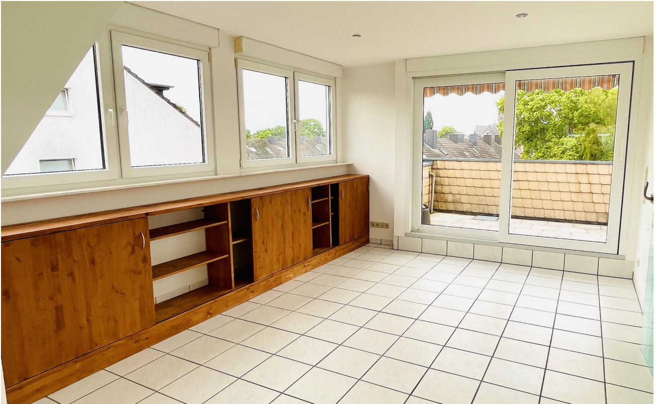
3. Zimmer - rechts