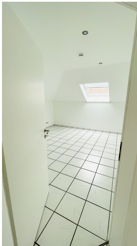
Blick ins Schlafzimmer