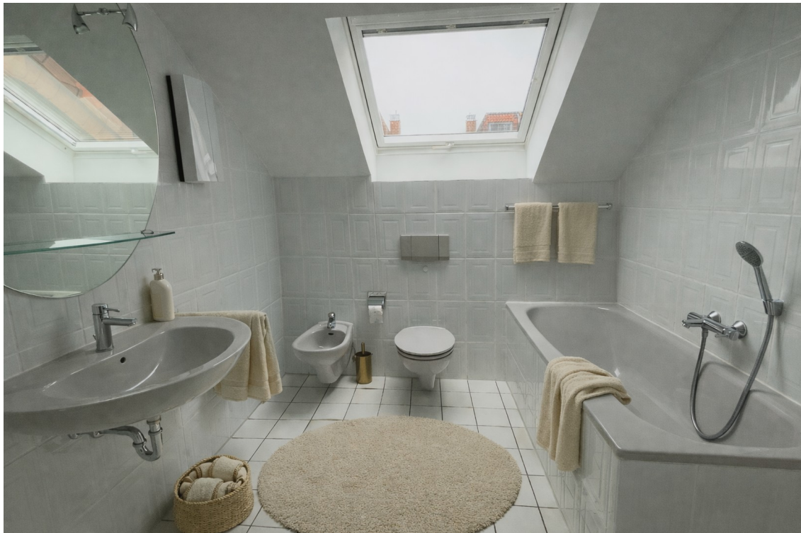
Badezimmer - Impression