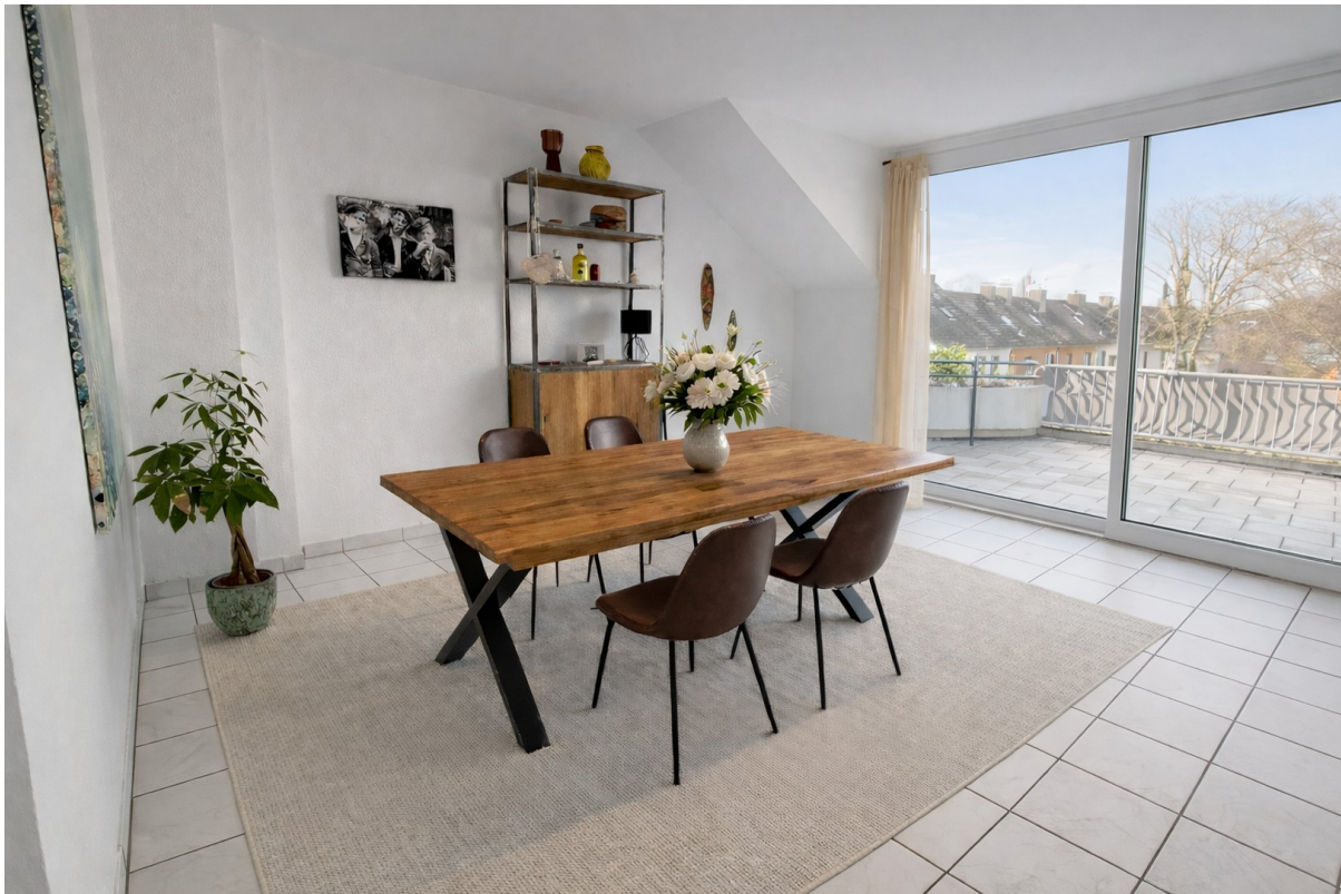
Wohnzimmer - links Impression