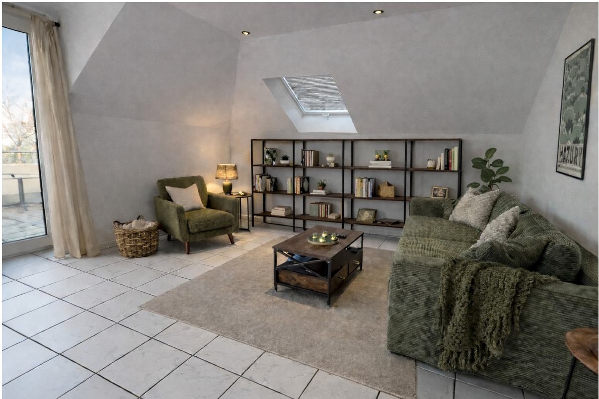
Wohnzimmer - rechts Impression