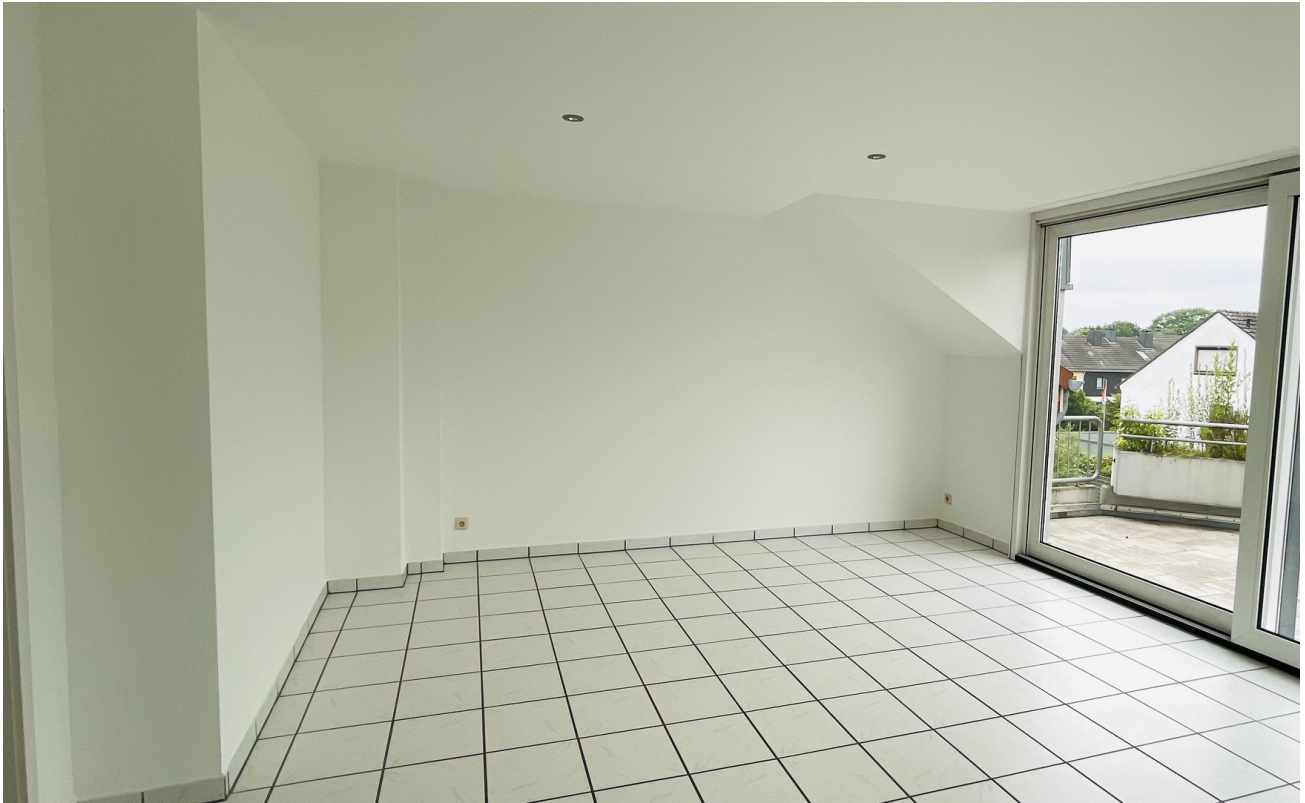
Wohnzimmer - links