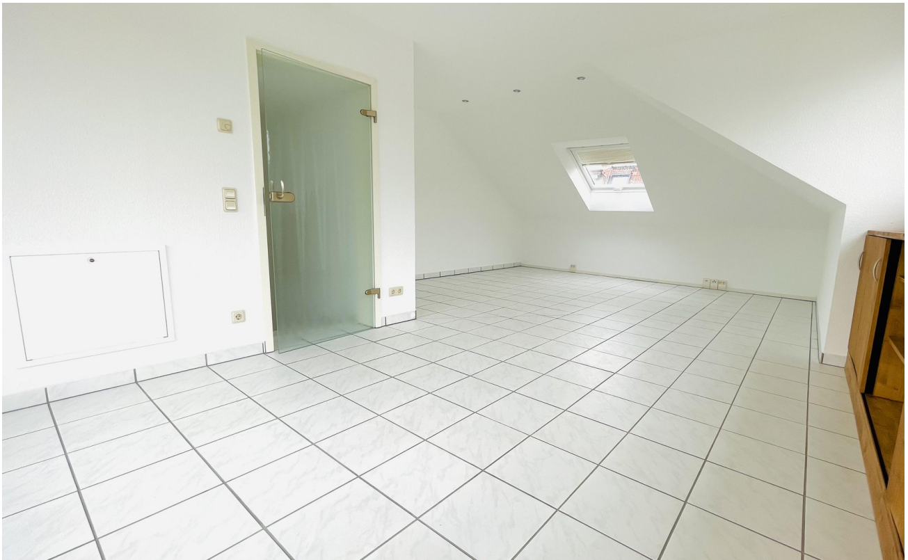
3. Zimmer - links