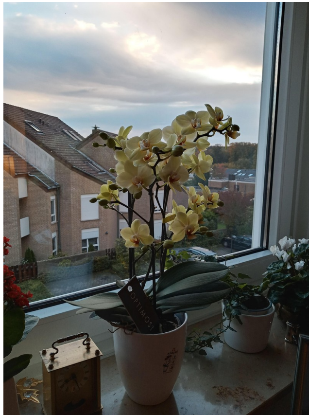
Aussicht von Esszimmer/Küche