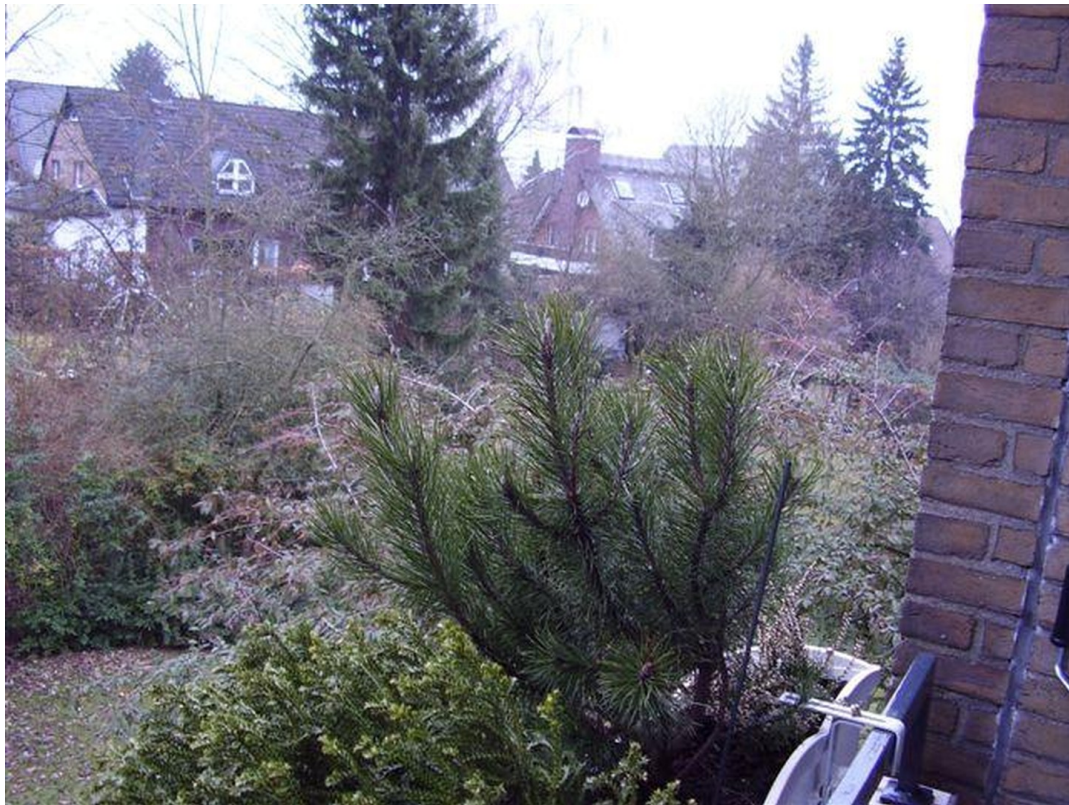
Aussicht von der Loggia