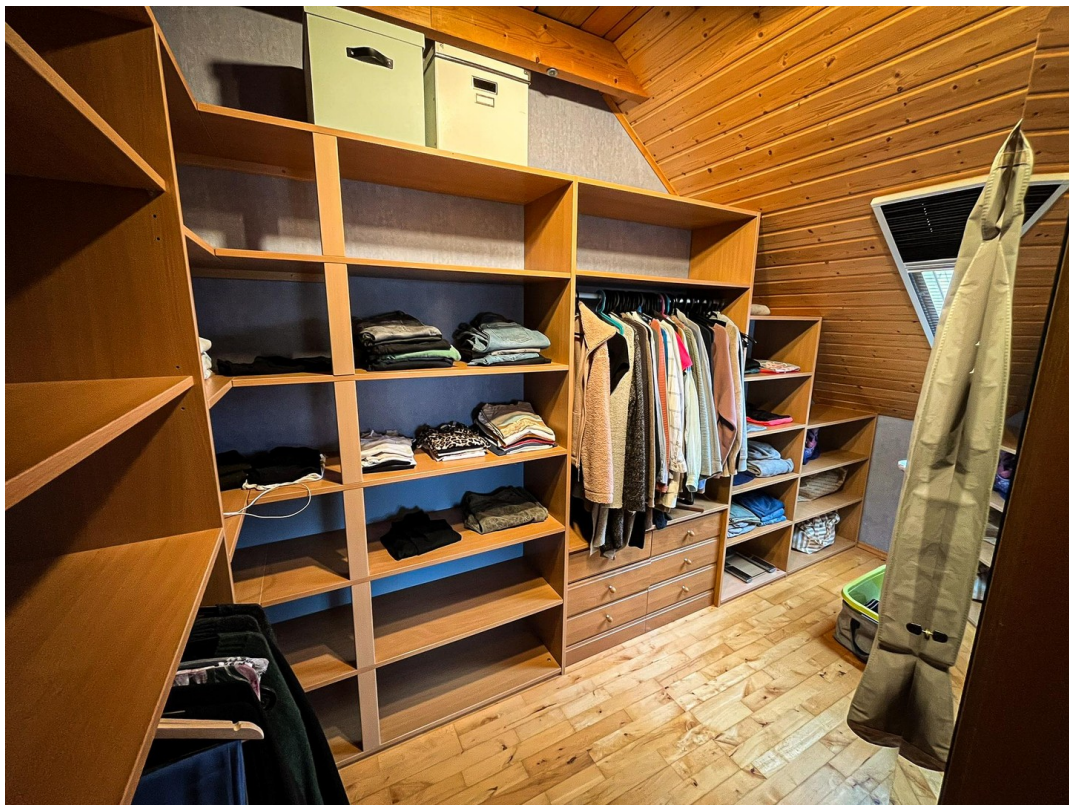
Ankleidezimmer - 2. OG.