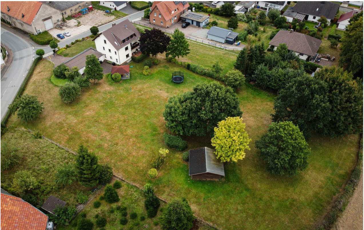
Haus u. Grundstück