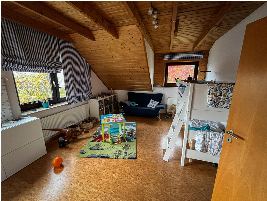
Kinderzimmer 2 - 2. OG.