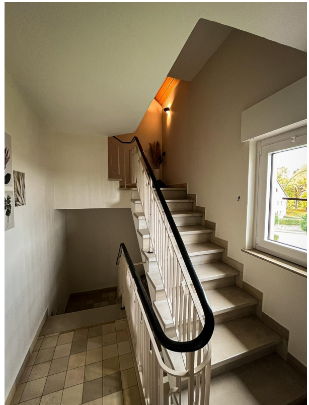
Flur - 1. OG. zum 2. OG.