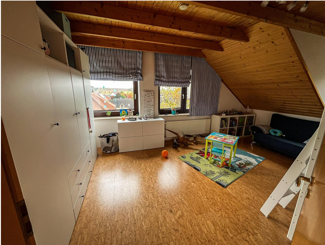
Kinderzimmer 2 - 2. OG.