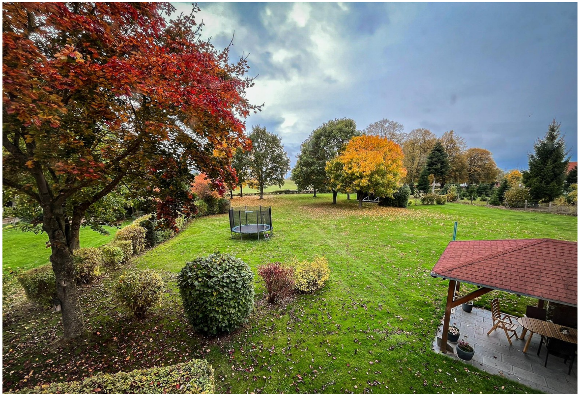
Gartenansicht vom Esszimmer