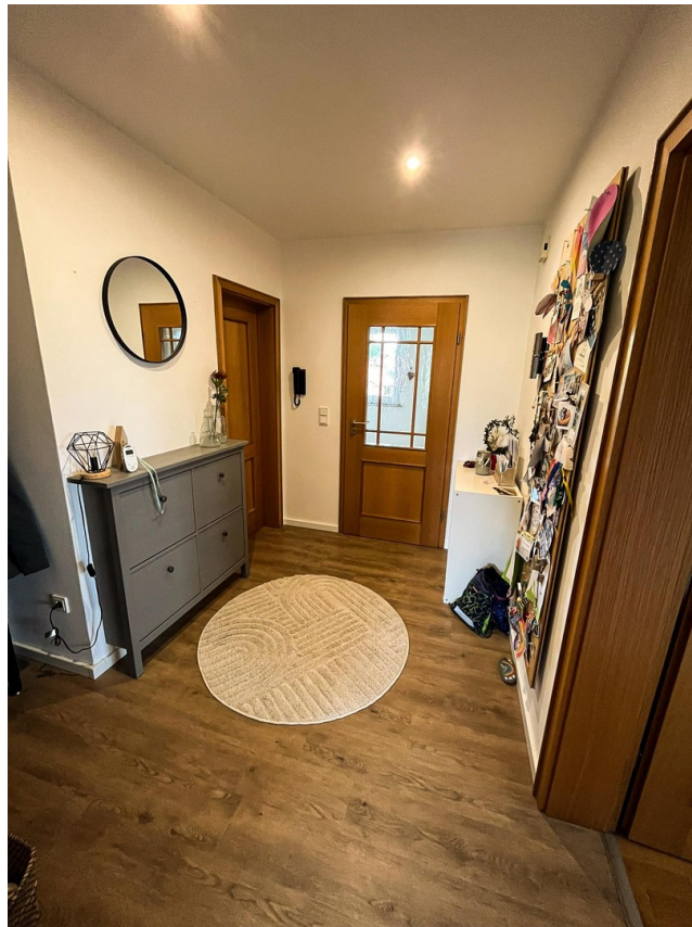
Flur - 1. OG.