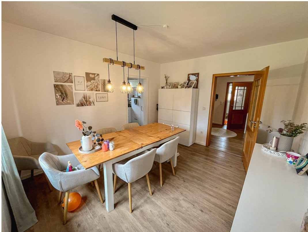
Esszimmer - 1. OG.