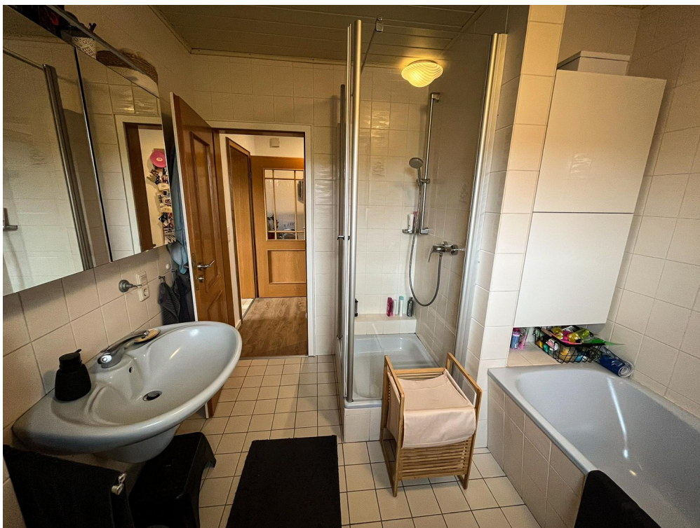
Bad - 1. OG.