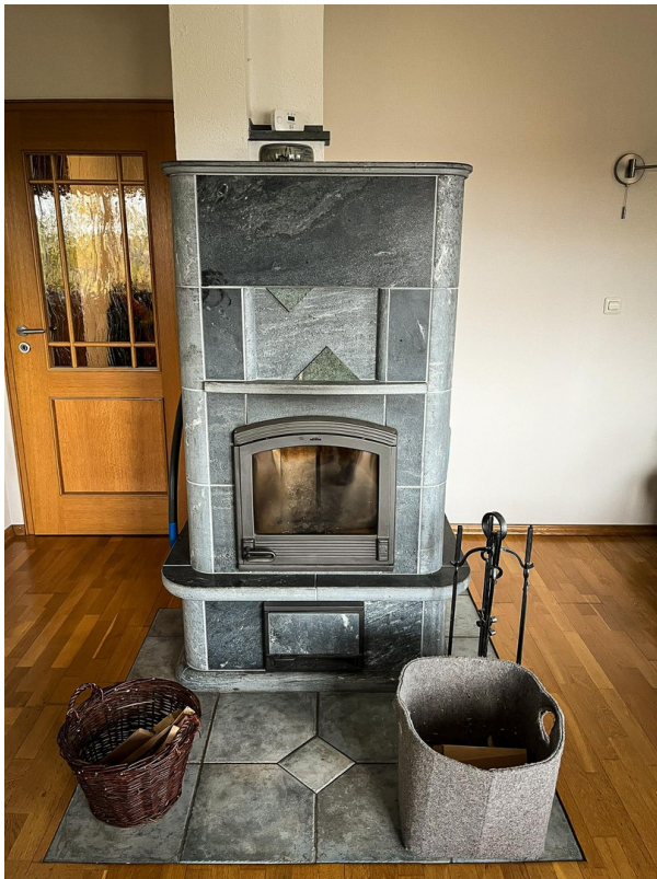
Specksteinofen - 1. OG.