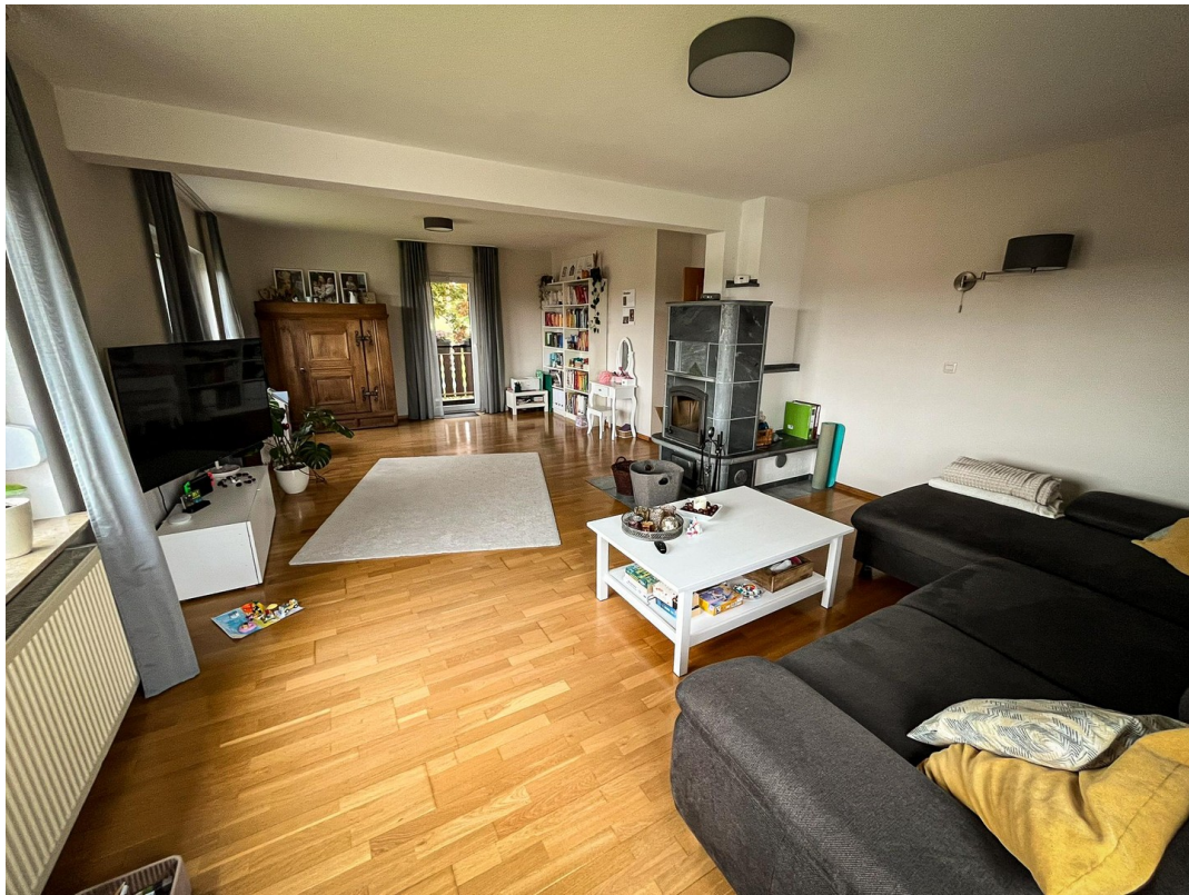
Wohnzimmer - 1. OG.