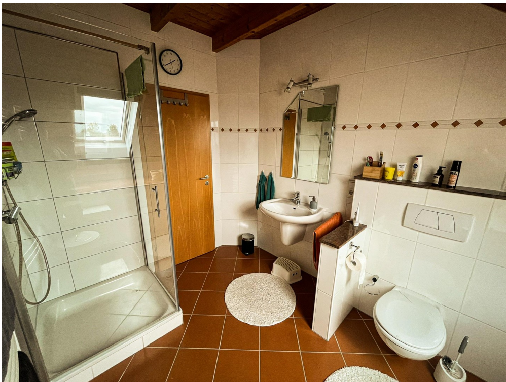
Bad - 2. OG.