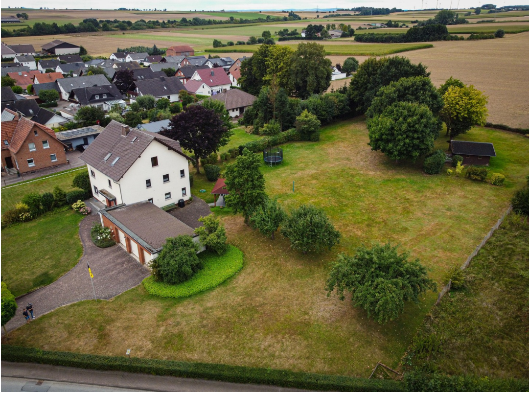
Haus u. Grundstück