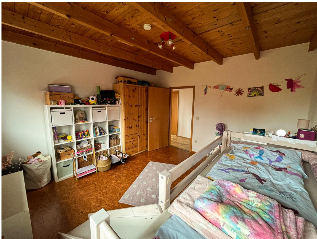
Kinderzimmer 1 - 2. OG.