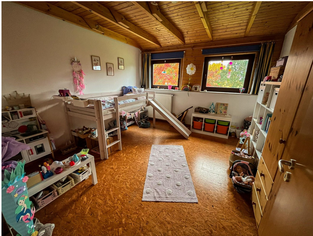
Kinderzimmer 1 - 2. OG.