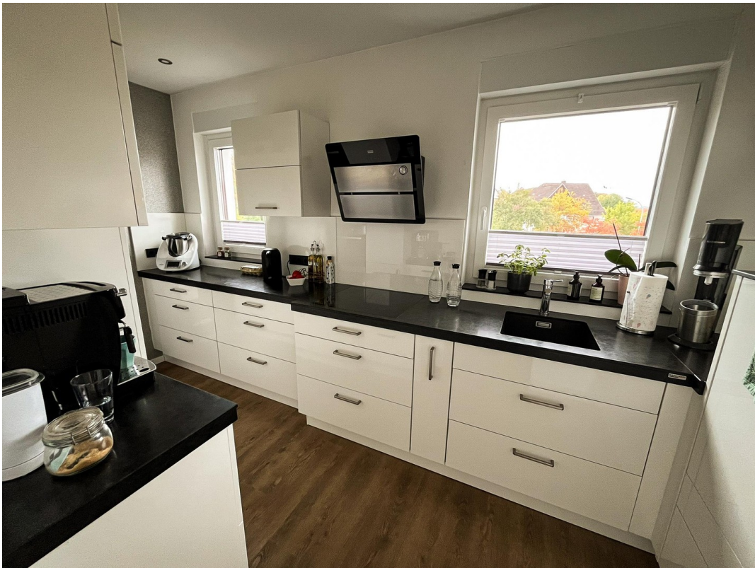
Küche - 1. OG.