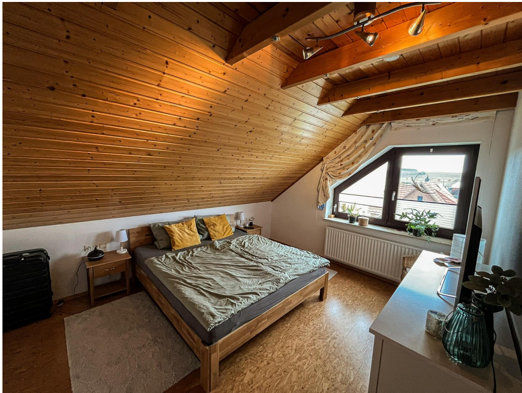
Elternschlafzimmer - 2. OG.