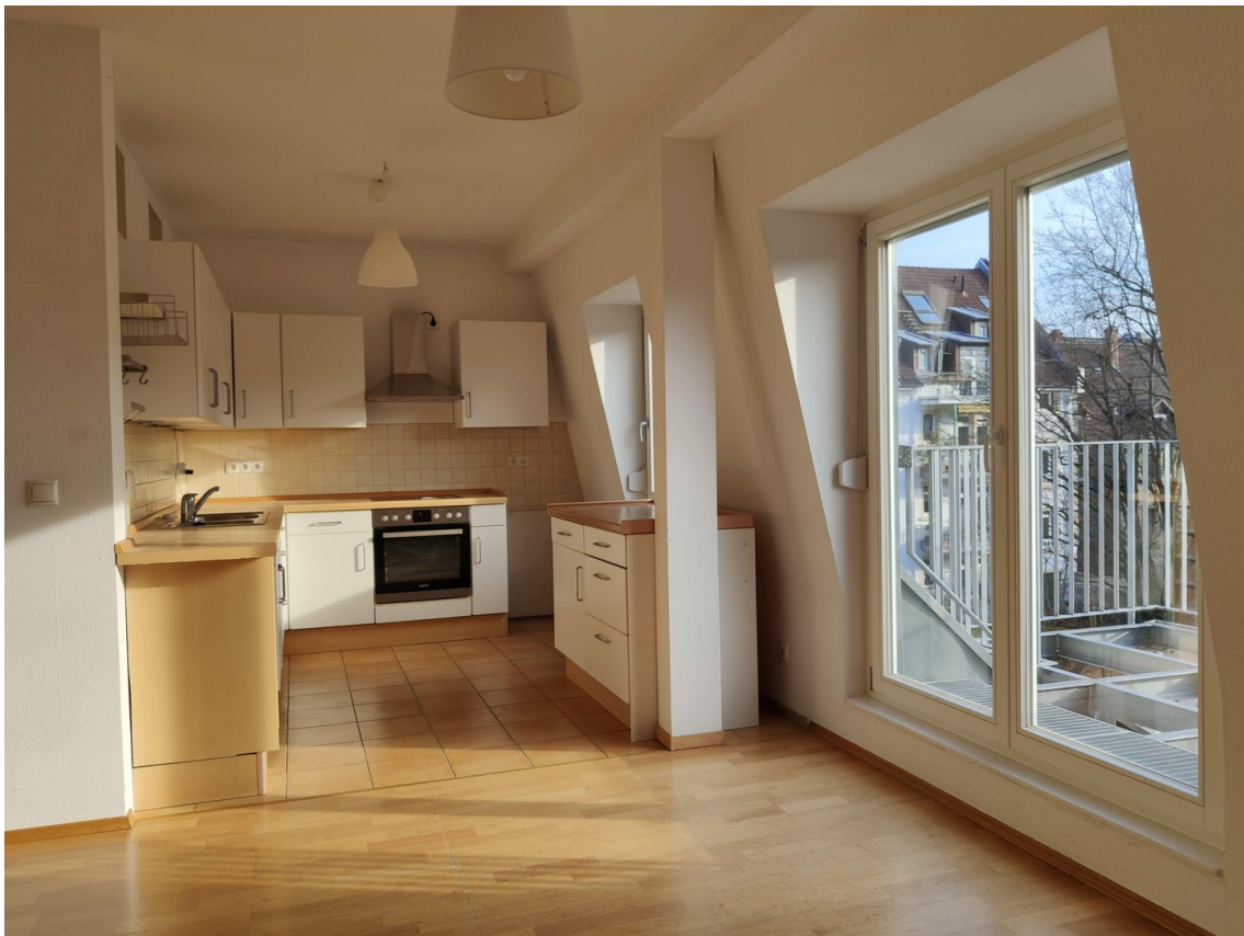
Wohnraum mit Küche