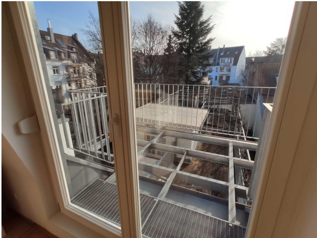
Balkon (Bodenbelag in Arbeit)