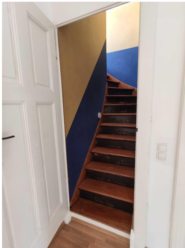
Innentreppe in das Dachstudio