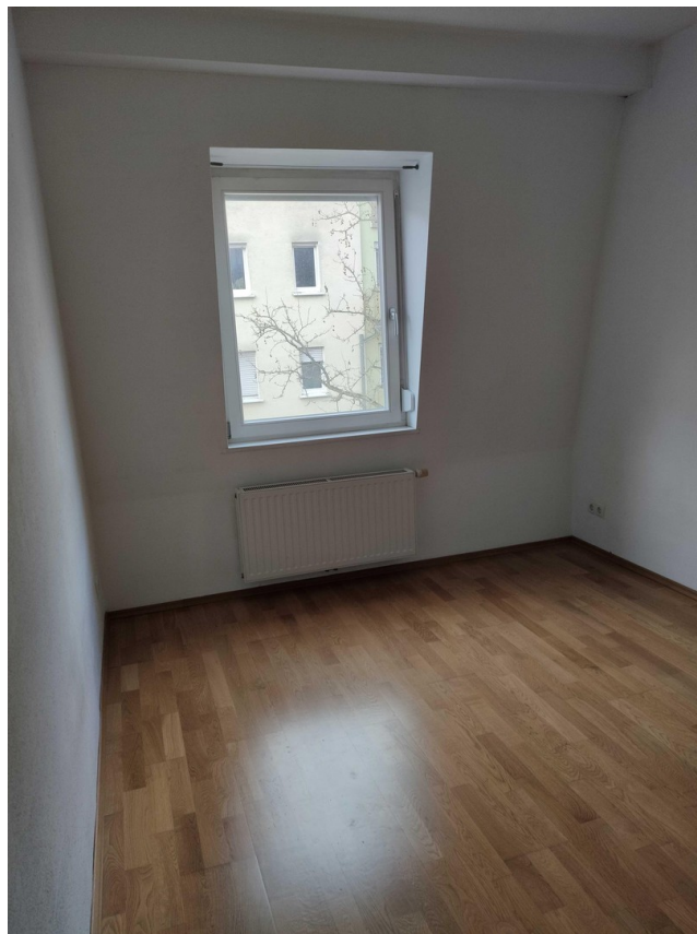
Kleines Zimmer 2