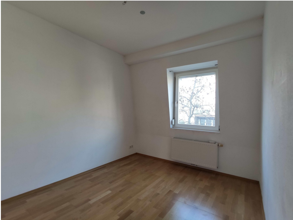
Kleines Zimmer 1