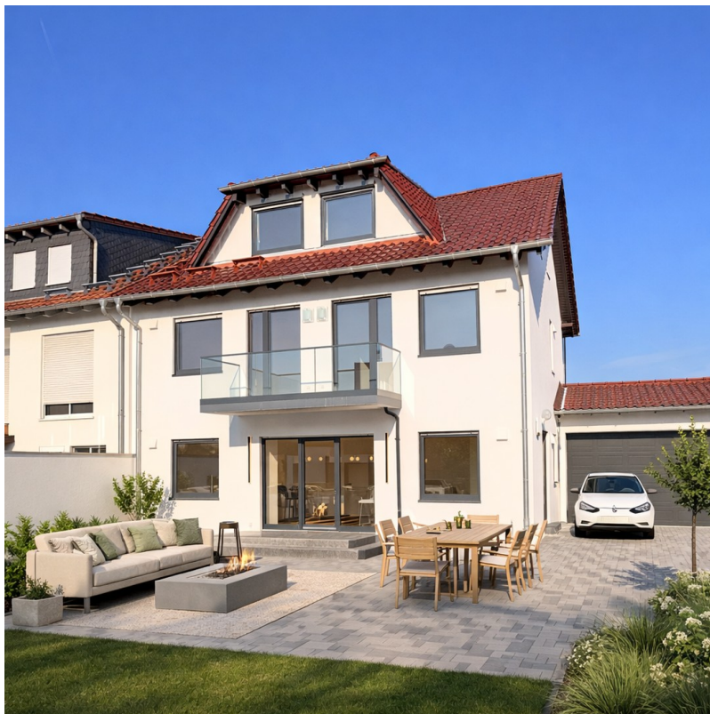
Garten- Garage- Ansicht