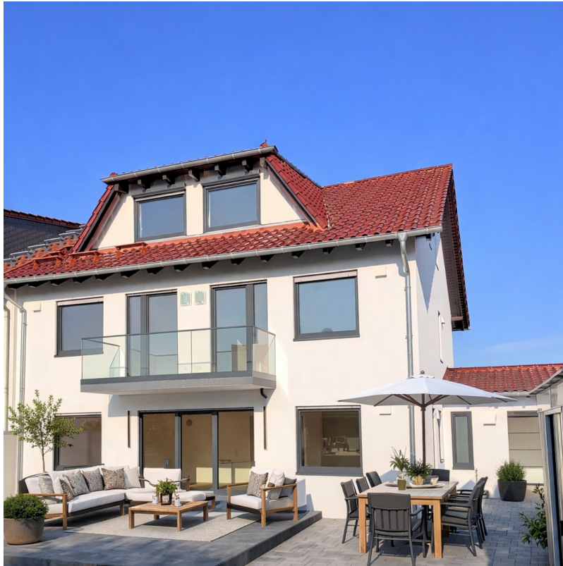
Garten - Ansicht