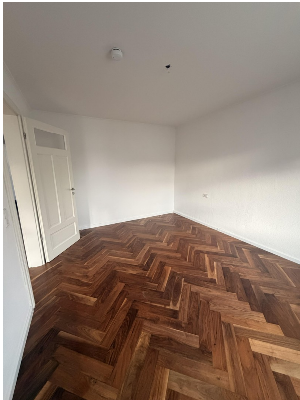
Schlafzimmer Bild 3