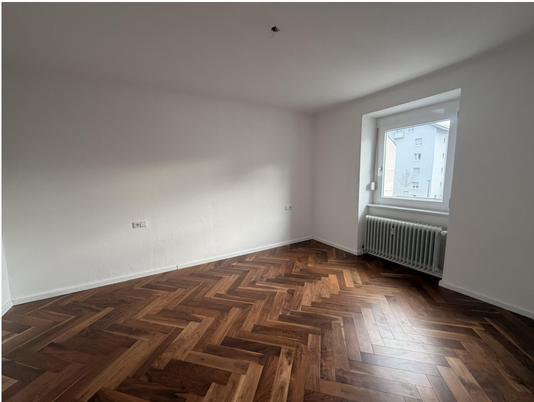
Schlafzimmer Bild 1