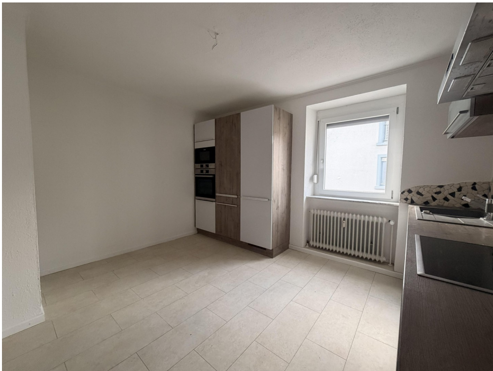
Küche Bild 2