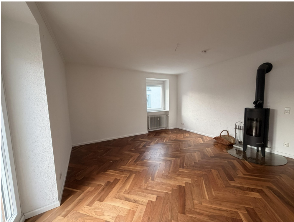
Wohnzimmer Bild 1