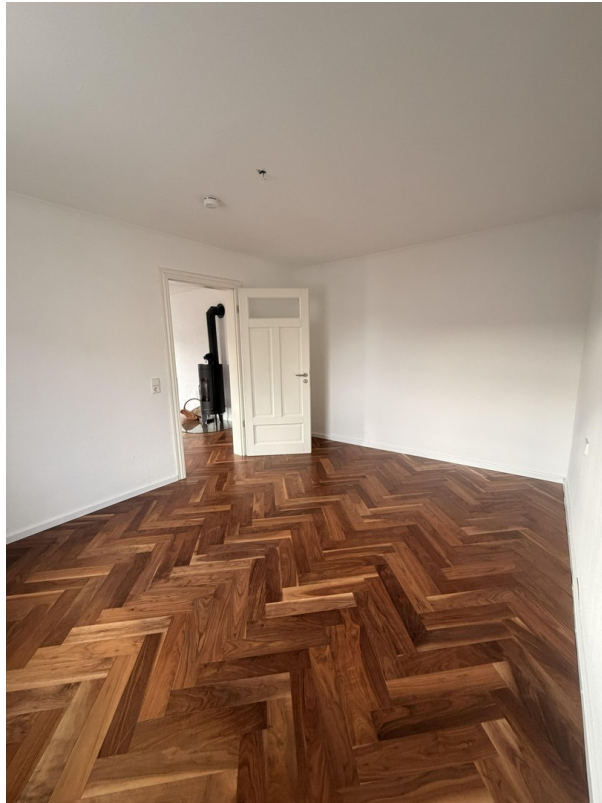
Schlafzimmer Bild 2