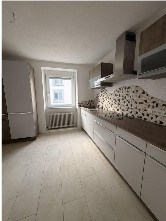
Küche Bild 1