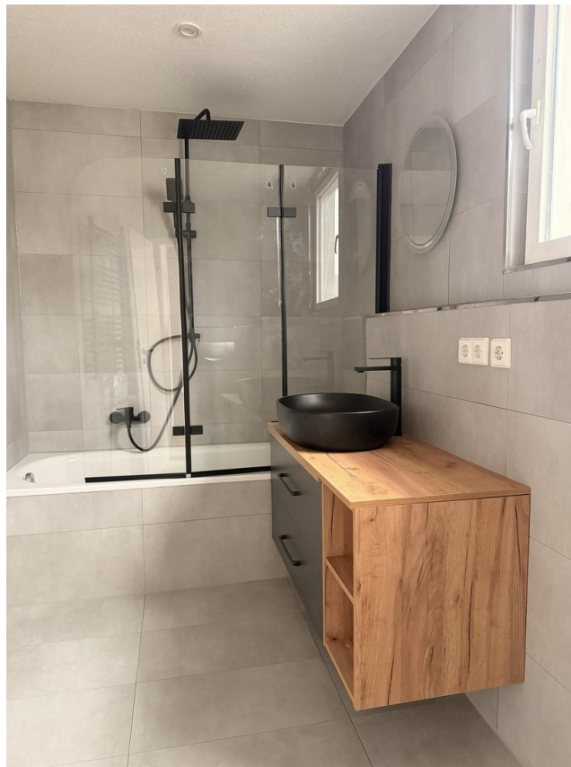
Bad Bild 2