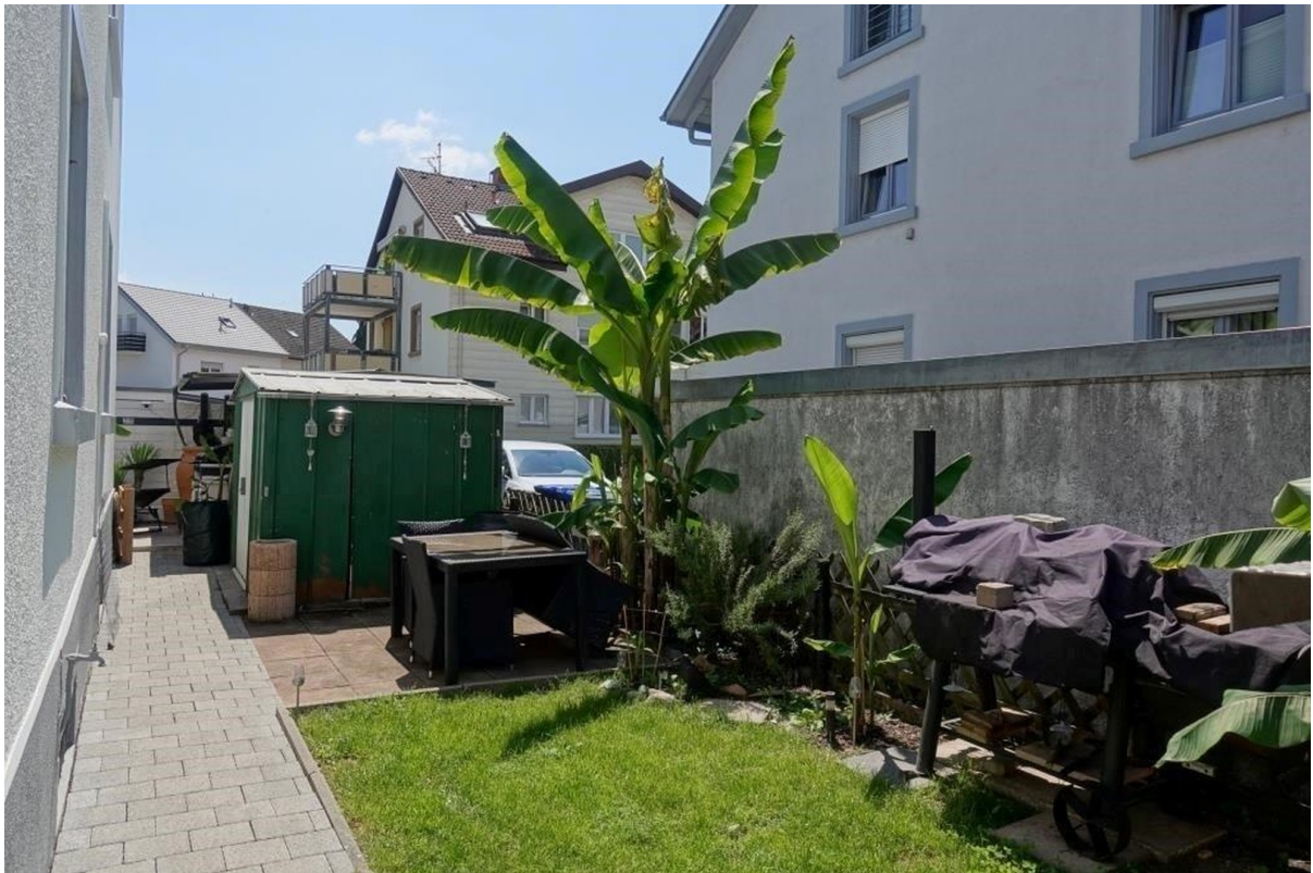
Garten (inkl Gartenhaus)