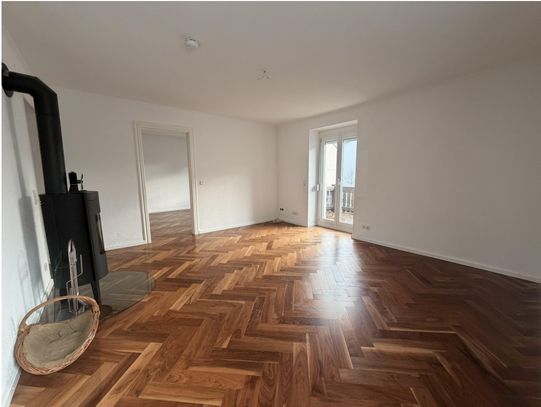
Wohnzimmer Bild 2