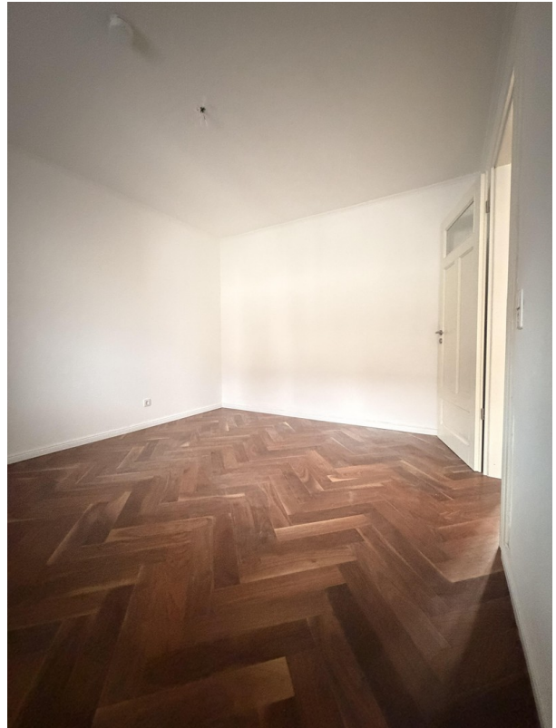
Kinderzimmer Bild 2