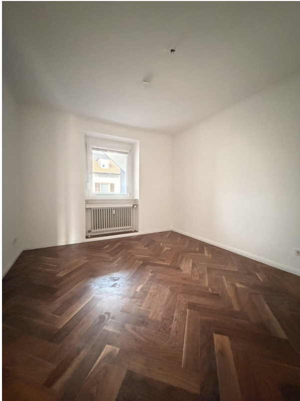
Kinderzimmer Bild 1