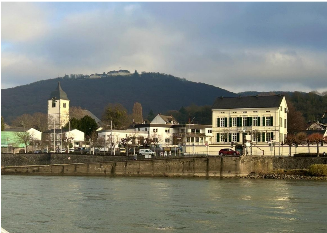
Stadt -Panorama -Rhein