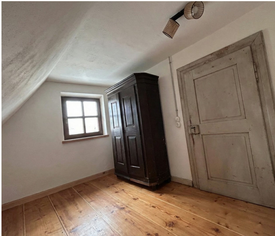
Schlafzimmer 1/Bed room 1