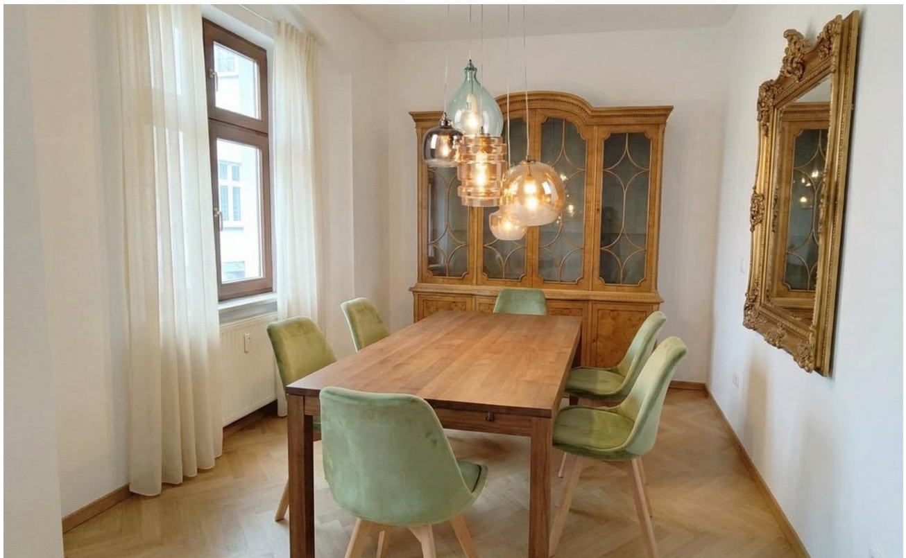
Zusätz Essbereich/ Dining Area