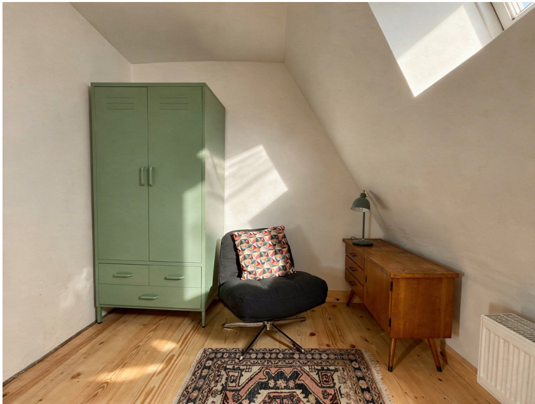
Schlafzimmer 2/Bed room 2