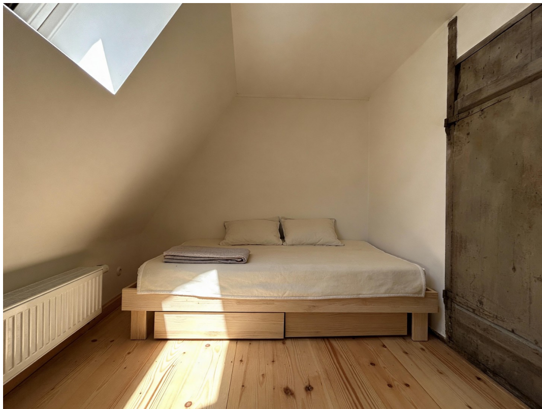
Schlafzimmer 2/Bed room 2