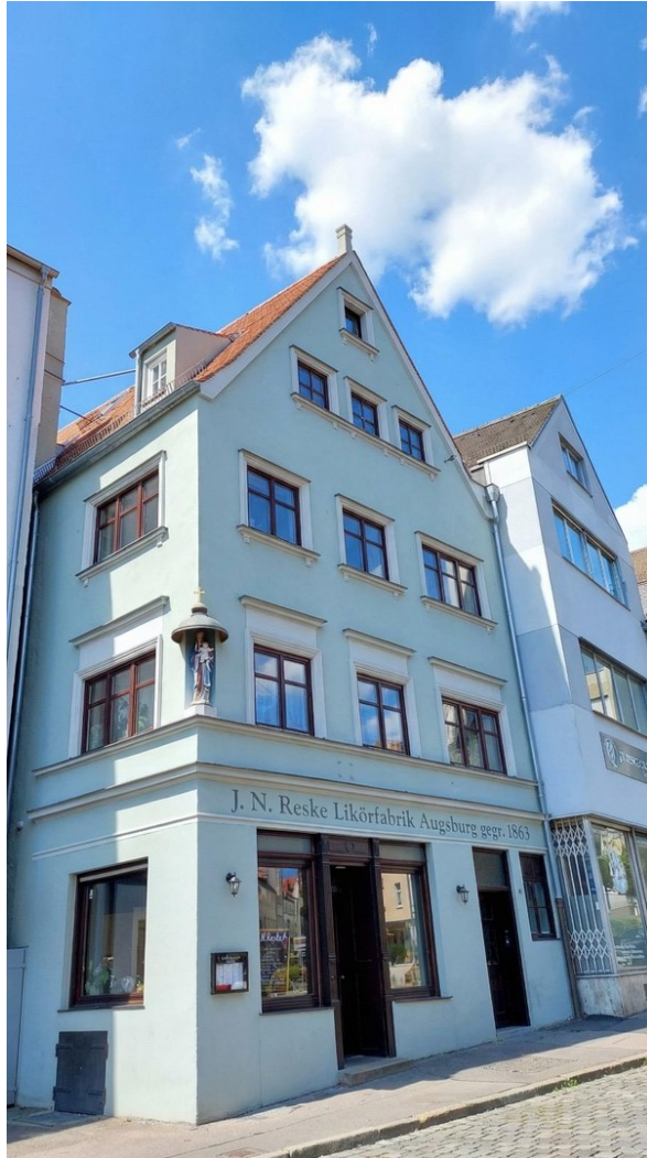
House / Hausansicht