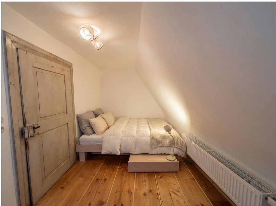
Schlafzimmer 1/Bed room 1