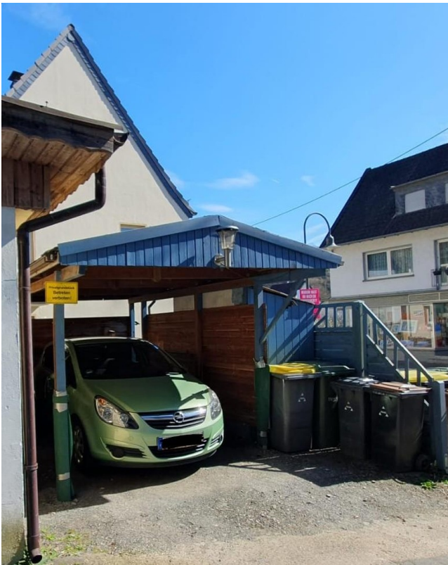
Carport mit kleinem Schuppen