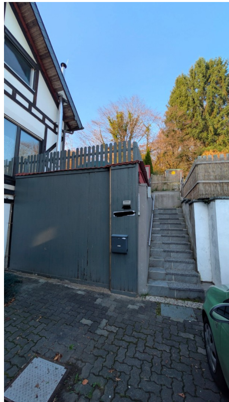
Treppenaufgang zum Grundstück