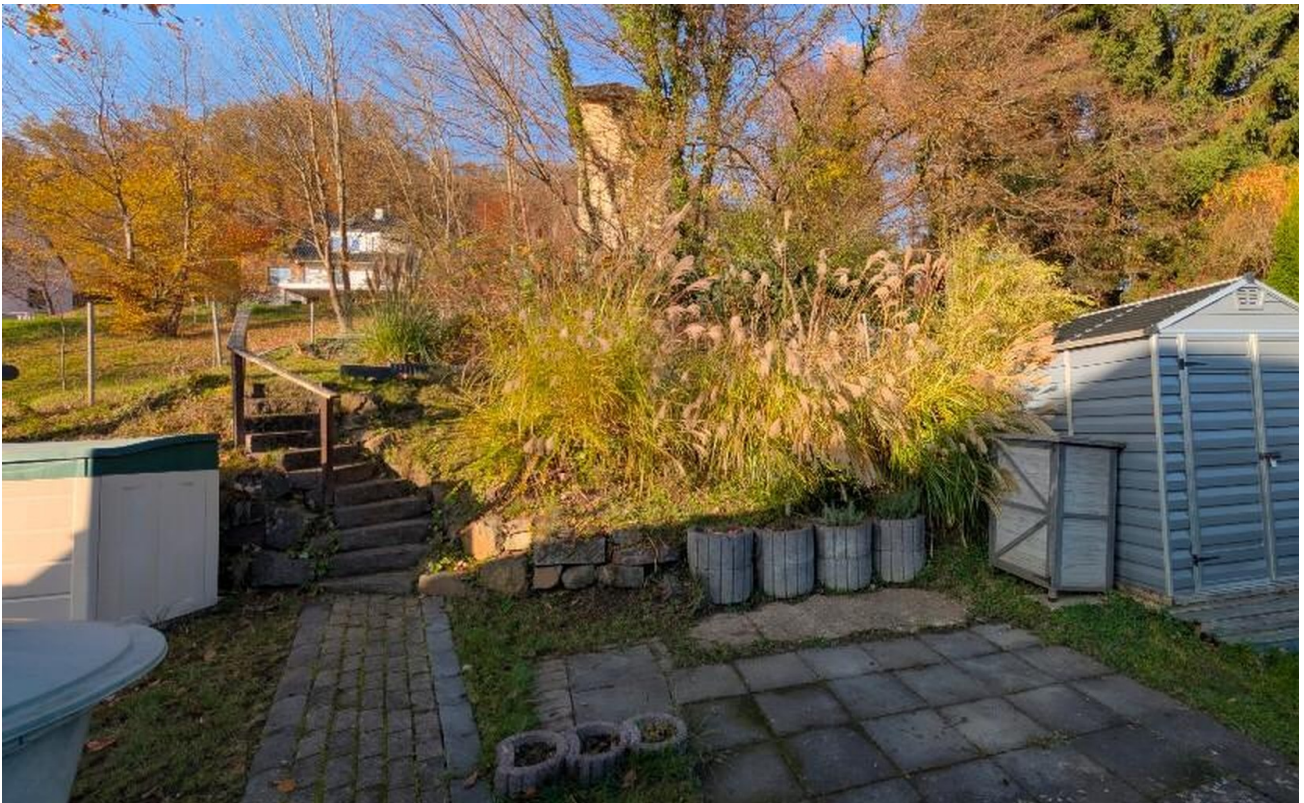
Garten mit Häuschen