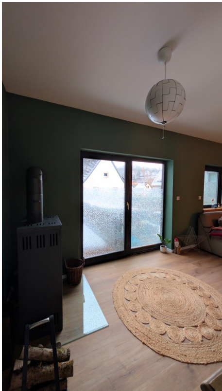
Zugang zur Terrasse