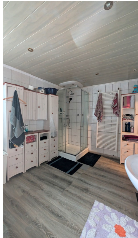
geräumiges Badezimmer (EG)