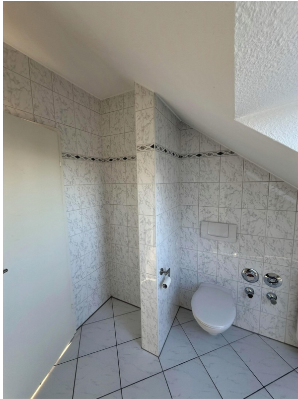
WC & Stellraum