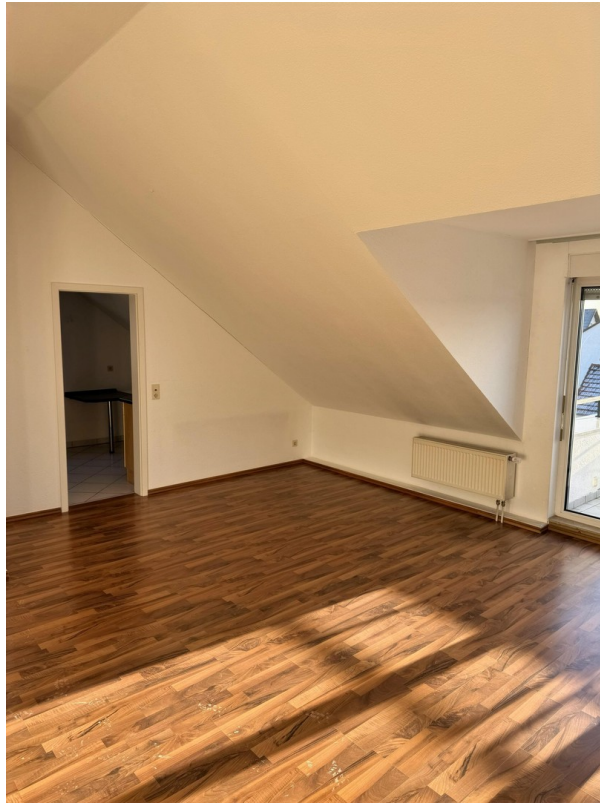
Wohnzimmer Blick Küche