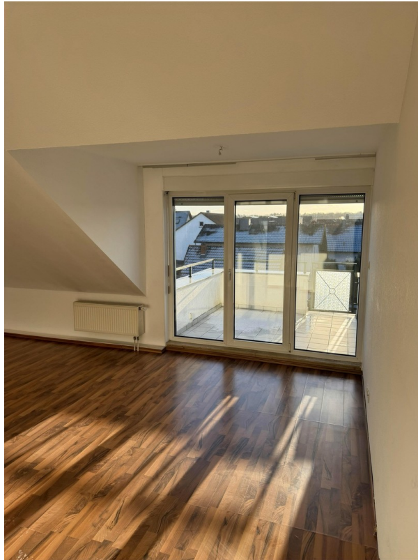
Blick auf den Balkon