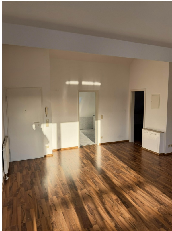
Blick Whg-Tür, Bad, Schlafz.