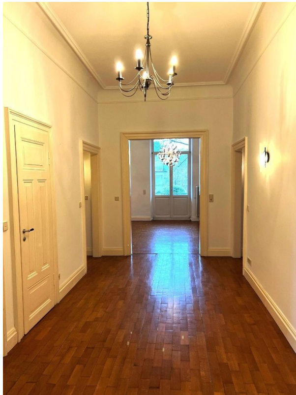
Diele mit Blick ins Wohnzimmer