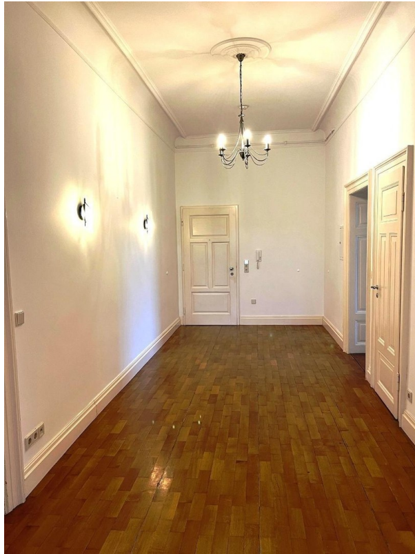
Diele & Eingangstür