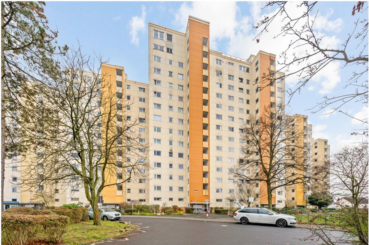
Gebäude vom außen