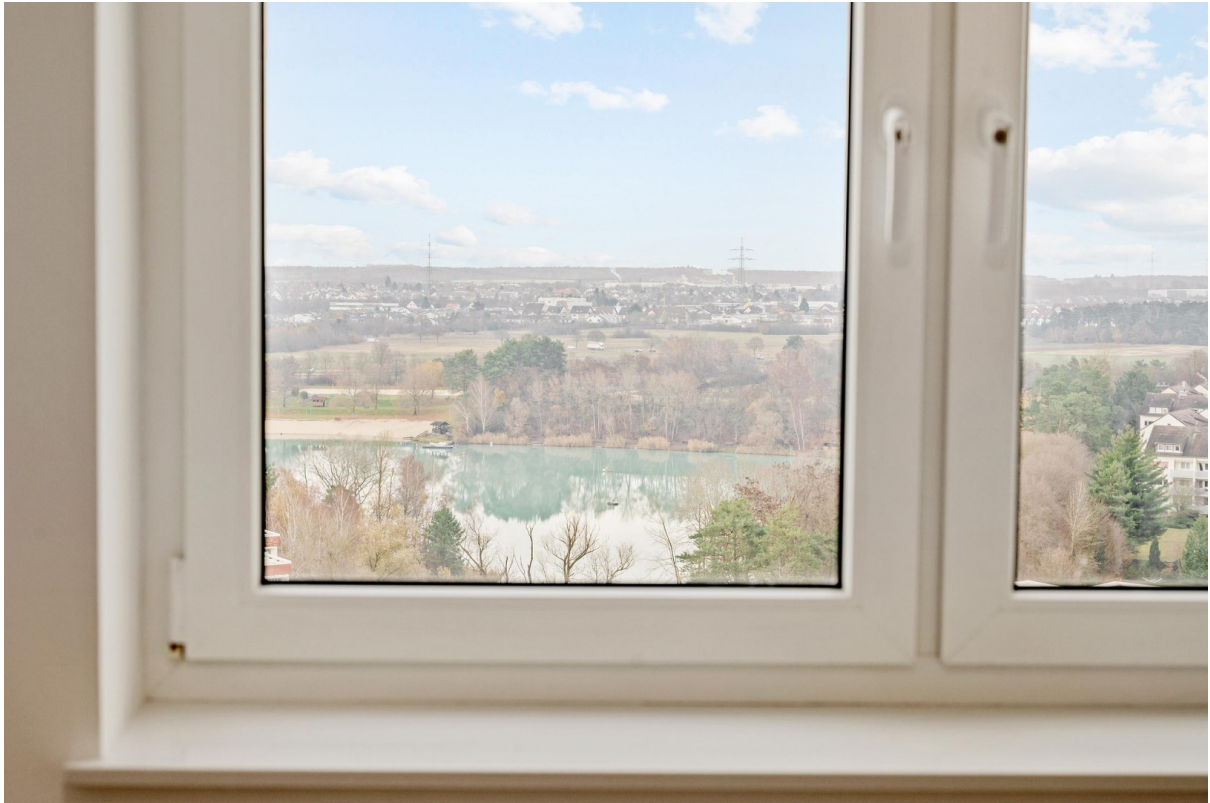
Blick auf Rodgauer See