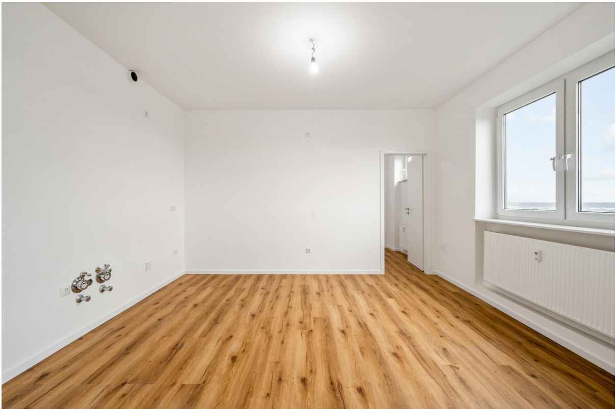
Küche und Esszimmer