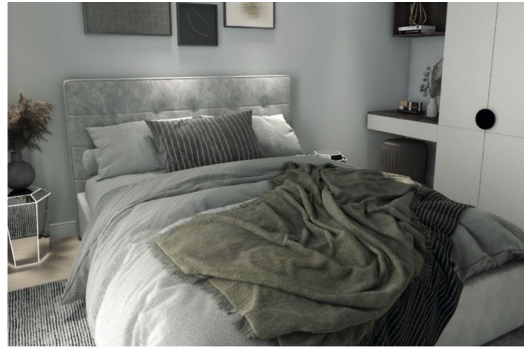
Stilvolles Ambiente im Schlafzimmer