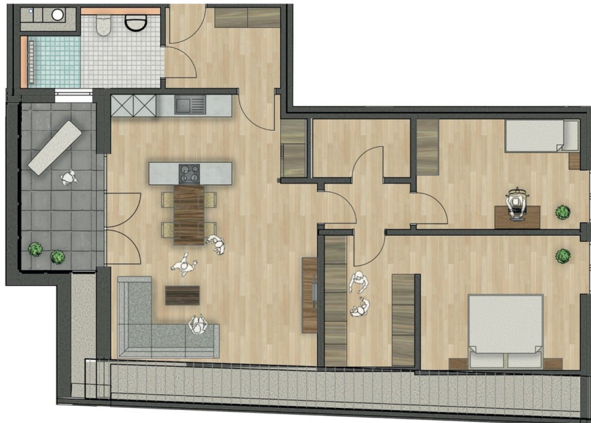
Grundriss „Wohnung 7“ im zweiten Obergeschoss