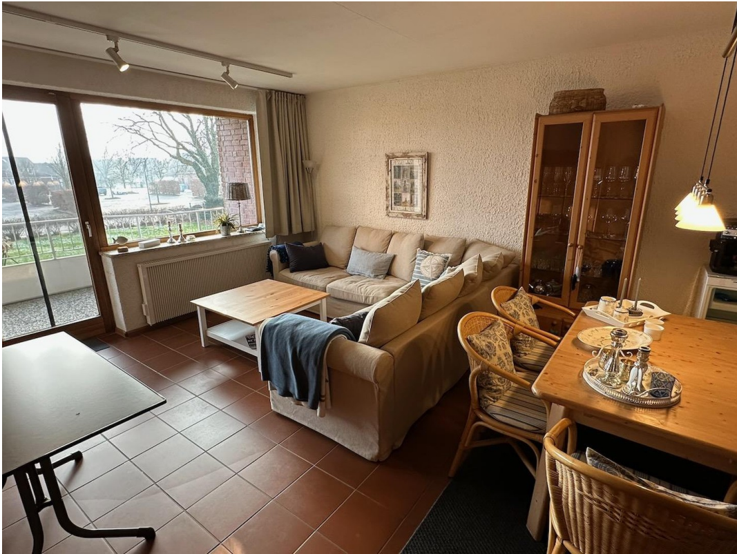
Wohnzimmer - Balkonblick