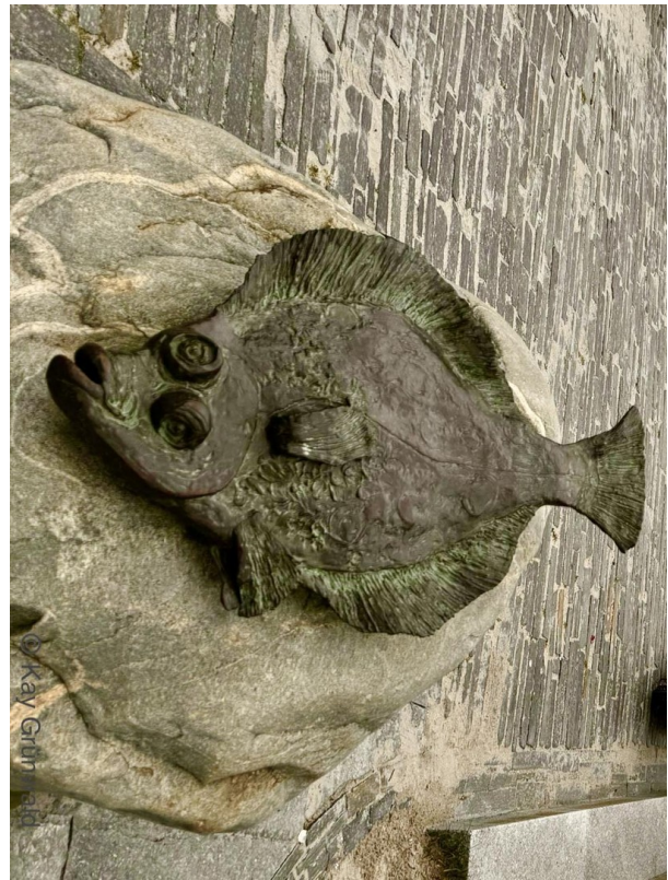
Hohwacher Strand: Flunder