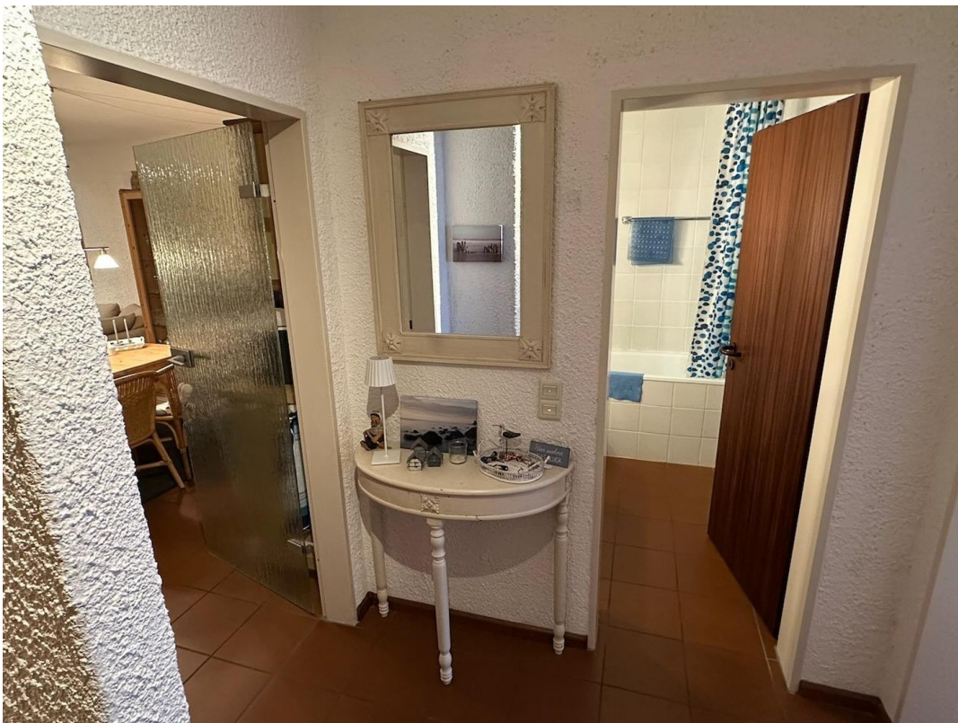
Flur / Diele