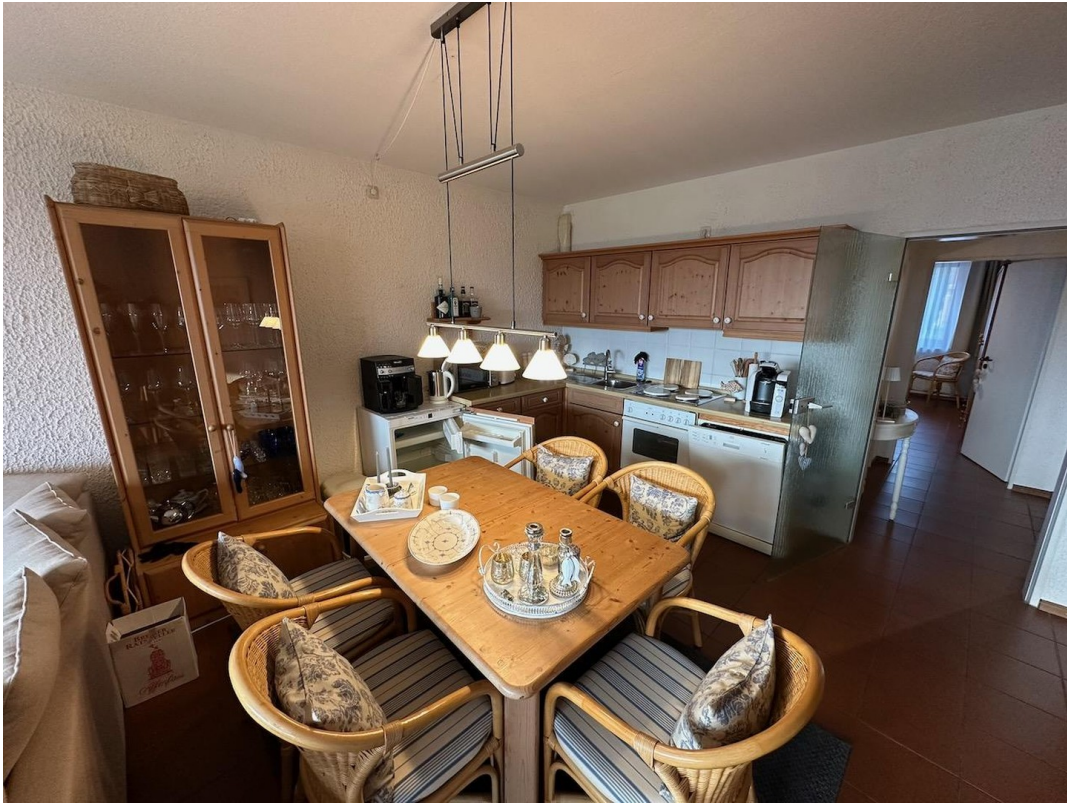
Kitchenette mit Essbereich