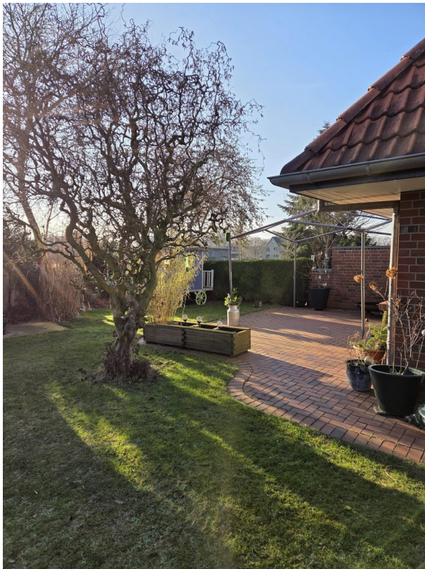
Terrasse vermietete Haushälfte