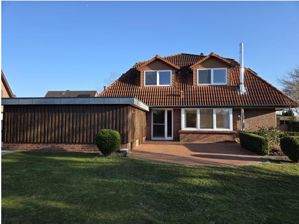
Terrasse vor Küchentür