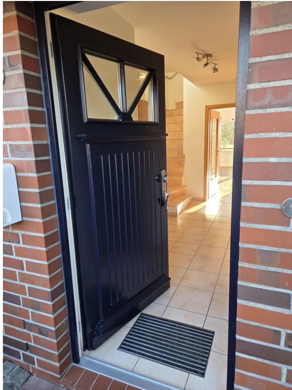
Haustür von außen