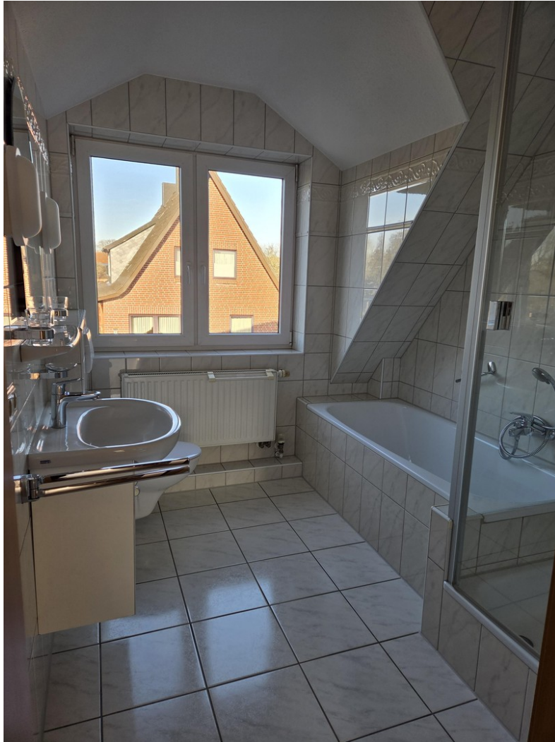
Bad mit Wanne und Dusche