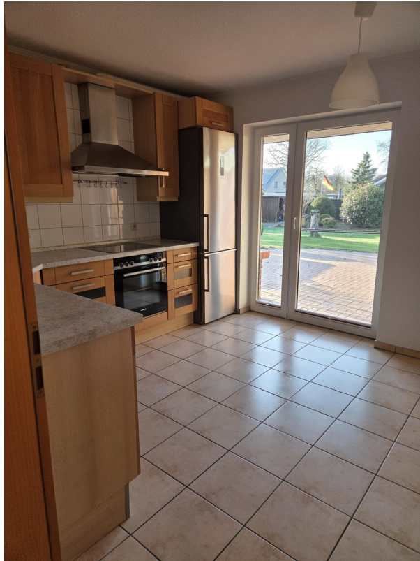
Küche mit Terrassentür