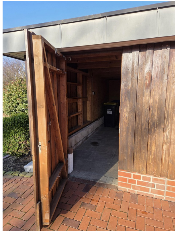
Abstellraum neben dem Carport