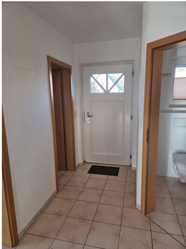
Haustür von innen, Gäste WC