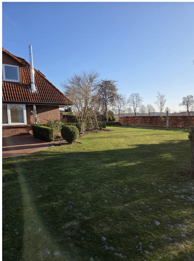
Garten mit Buchenhecke