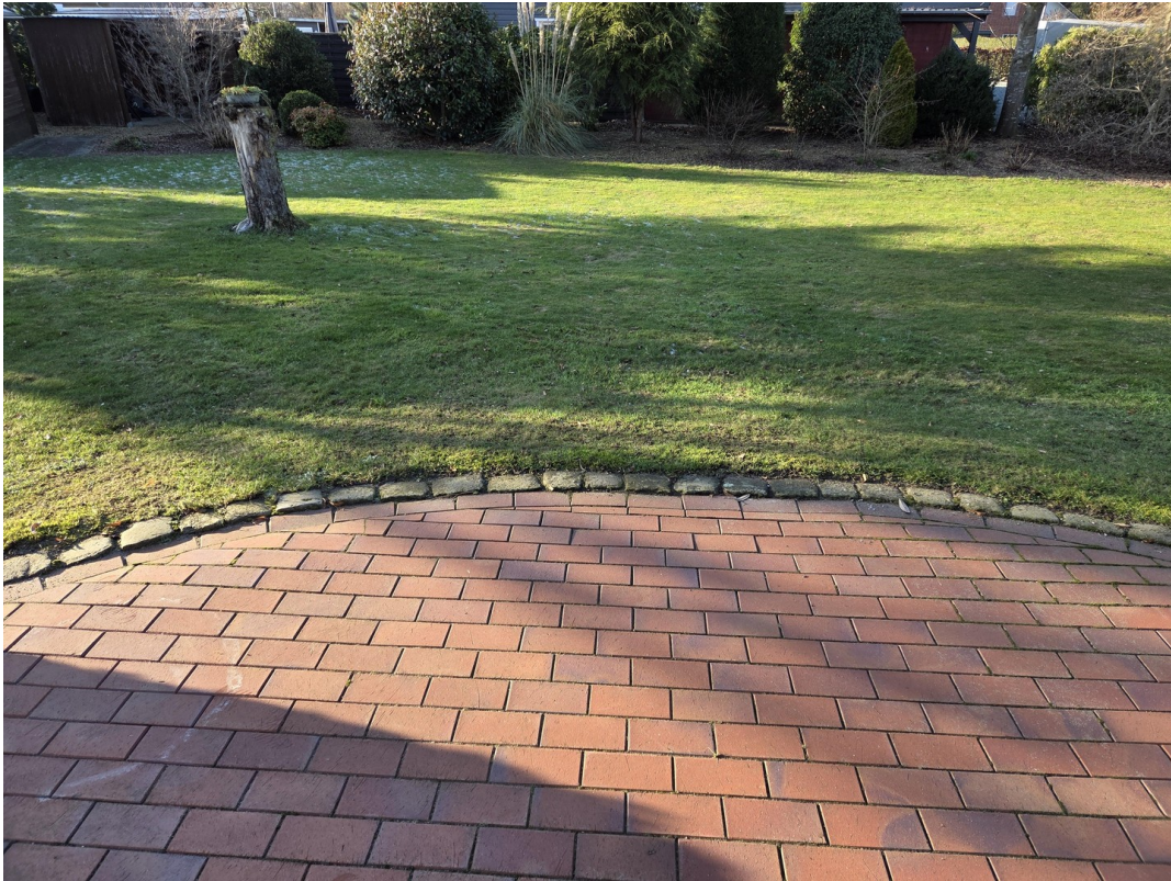
Terrasse mit Klinkerplasterung