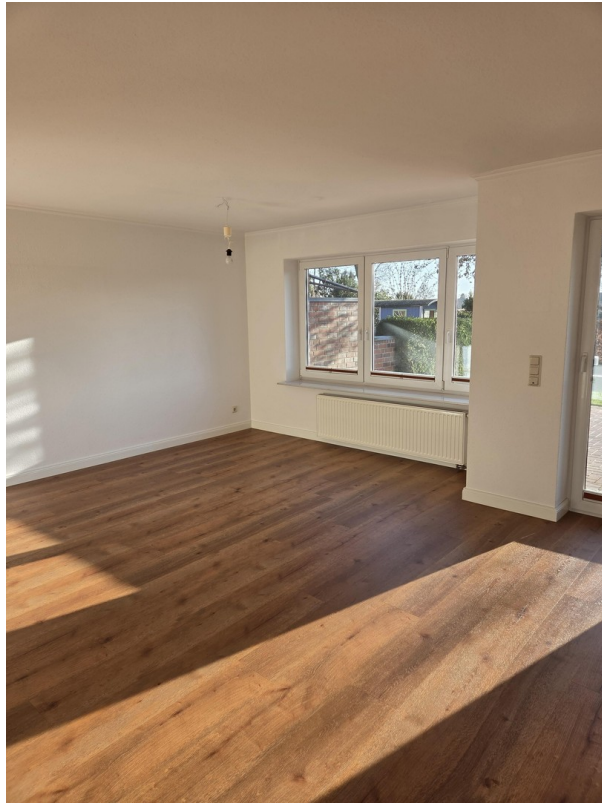
Wohnzimmer (auch Terrassentür)