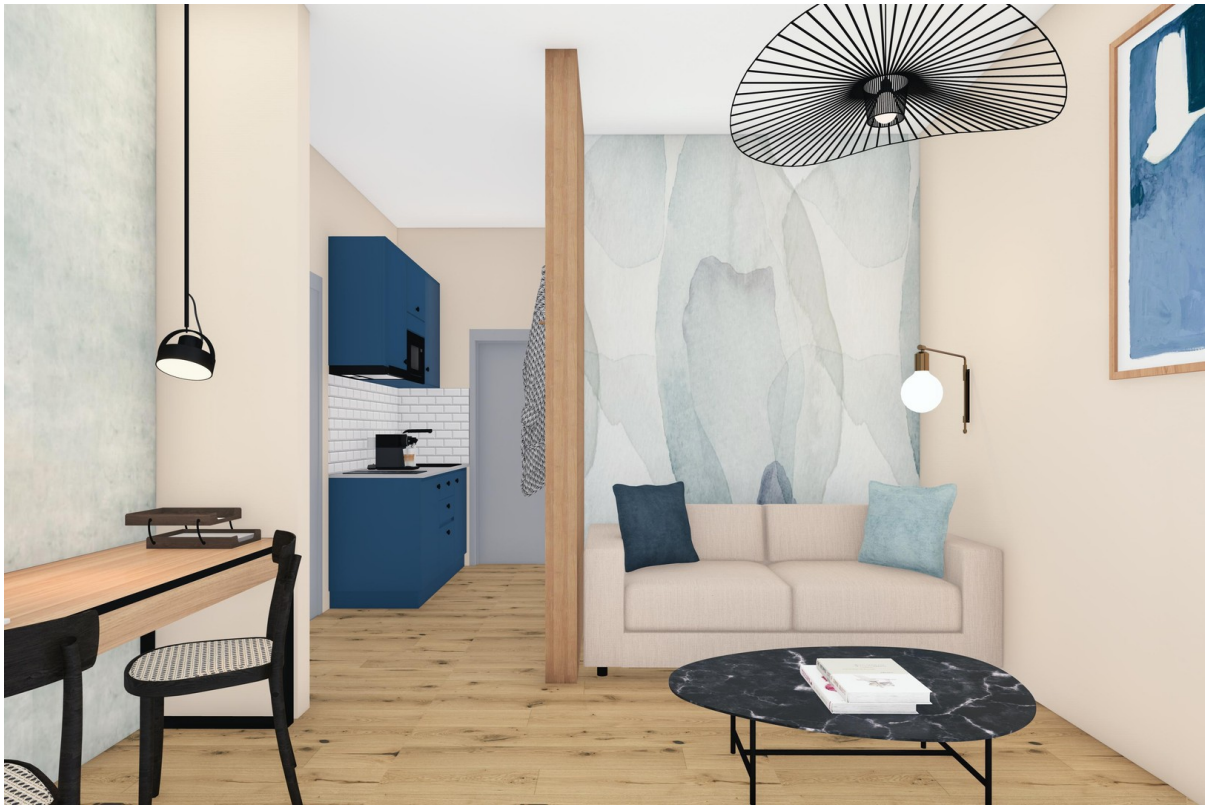
Küche & Einrichtungsbeispiel