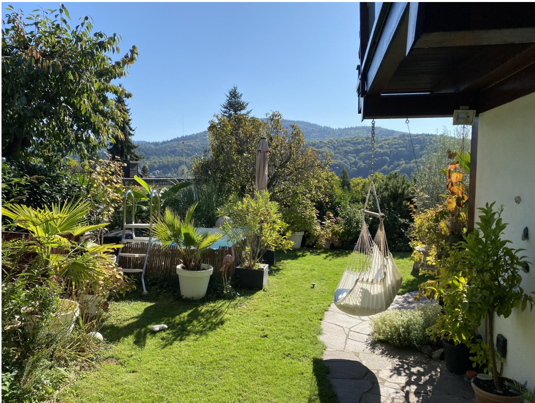
Gartenterrasse mit Ausblick