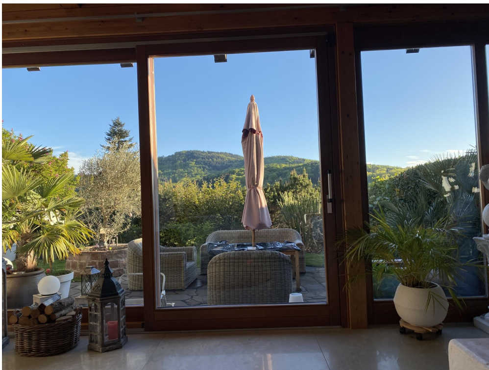
Blick auf Sonnenterrasse