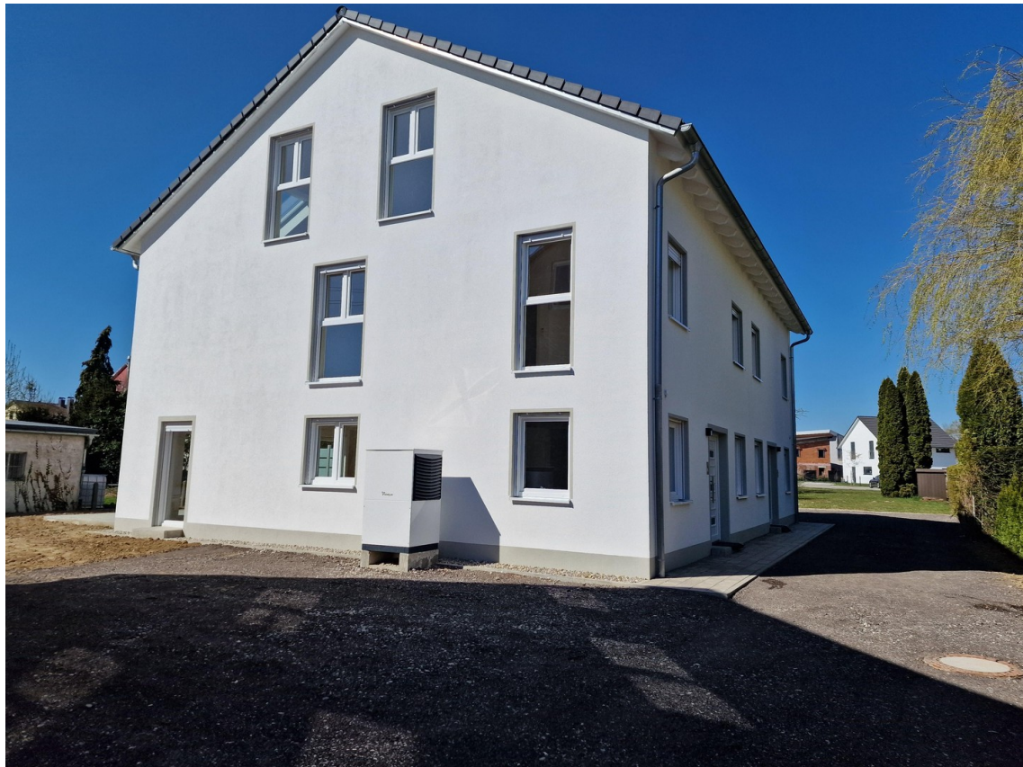
Ansicht von Osten