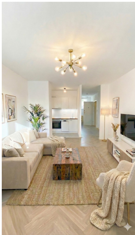
Wohnküche Beispiel Möblierung