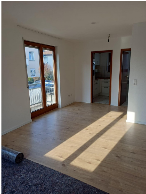
Ausgang zum Balkon