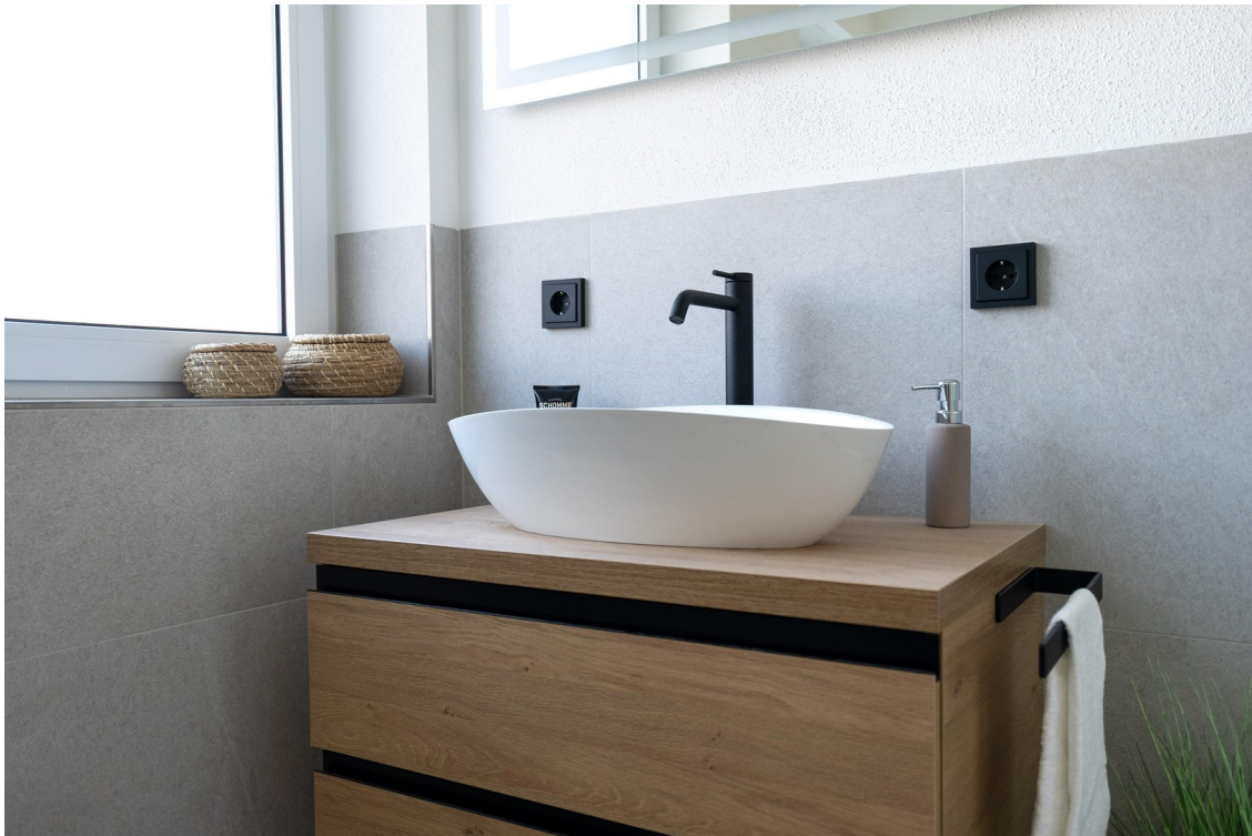
Bad - Bild 3