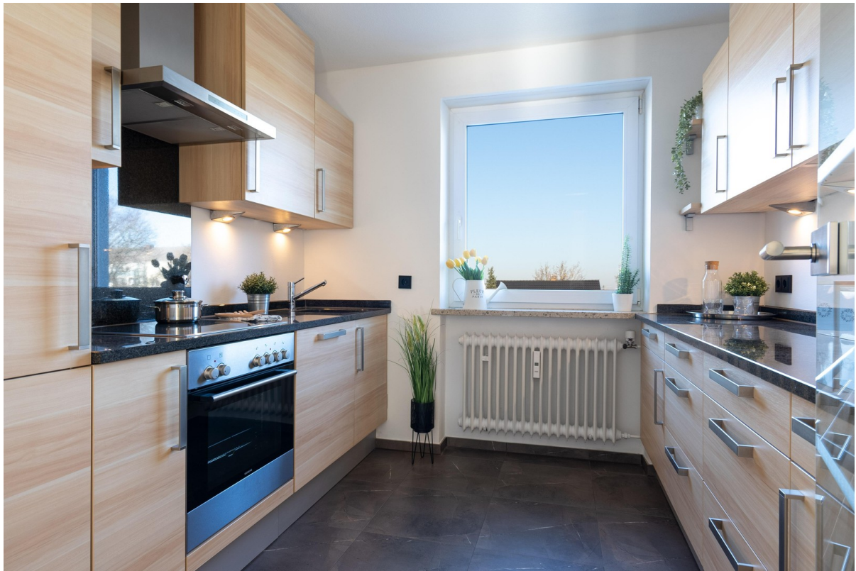
Küche - Bild 1