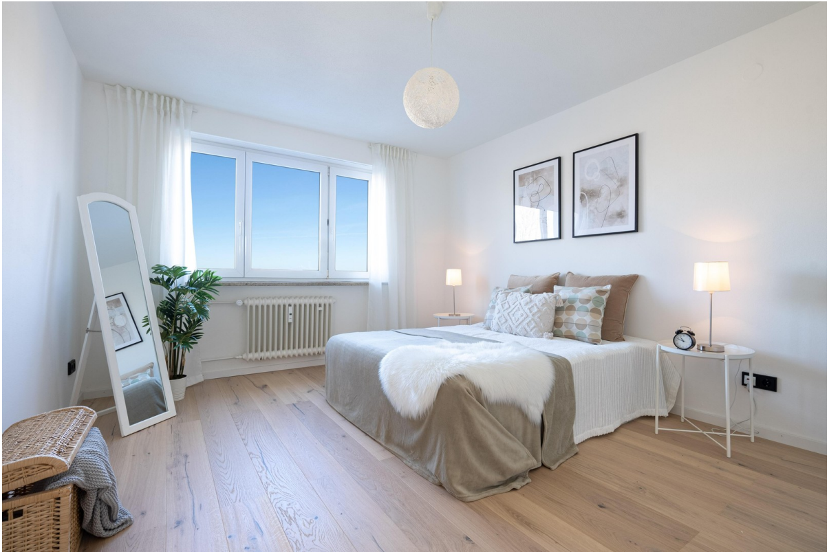
Schlafzimmer - Bild 1