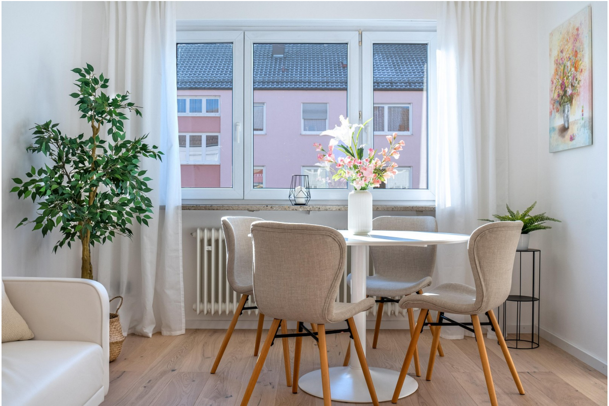
Wohnzimmer - Bild 3