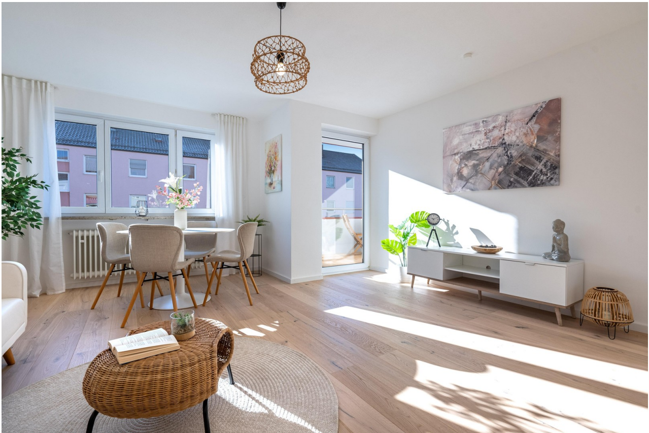
Wohnzimmer - Bild 2