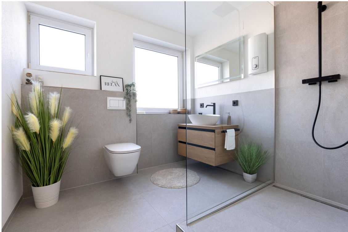
Bad - Bild 1