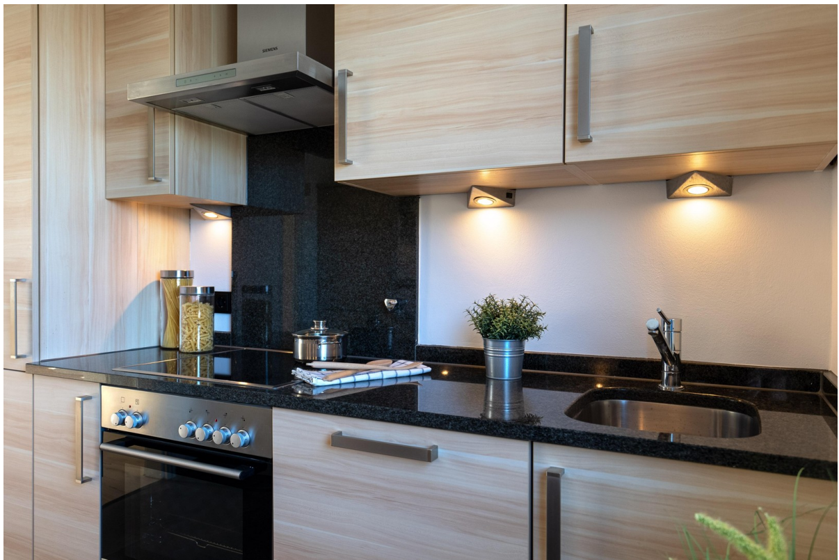
Küche - Bild 2