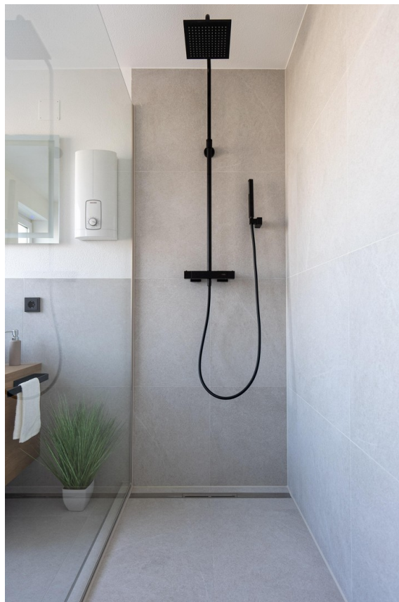
Bad - Bild 2