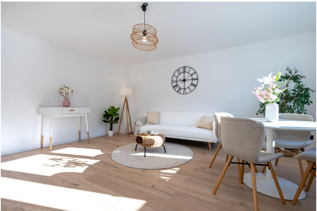
Wohnzimmer - Bild 4