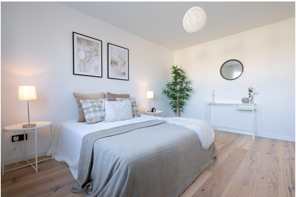
Schlafzimmer - Bild 2