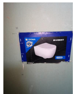
Aktueller Stand des Ausbaus