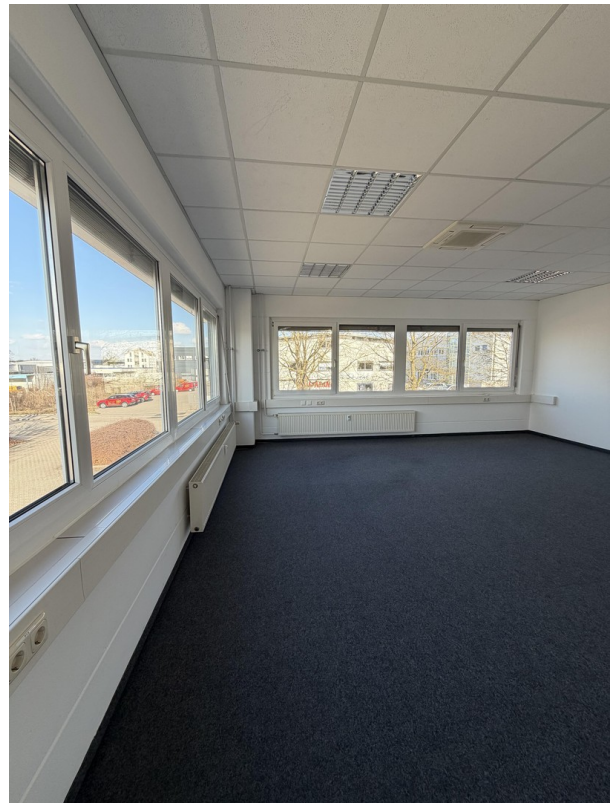
Eckbüro ca. 37 m 2