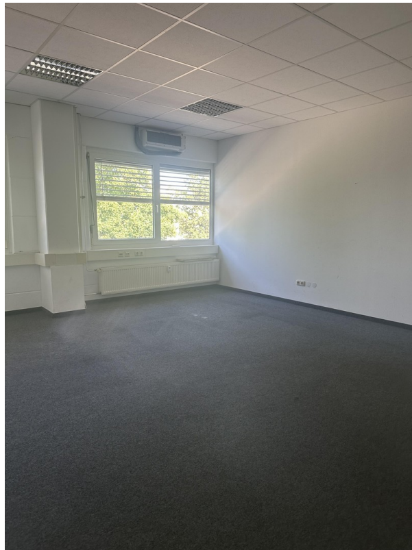
Büro ca. 28 m 2