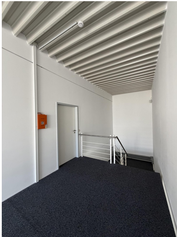
Eingang im OG