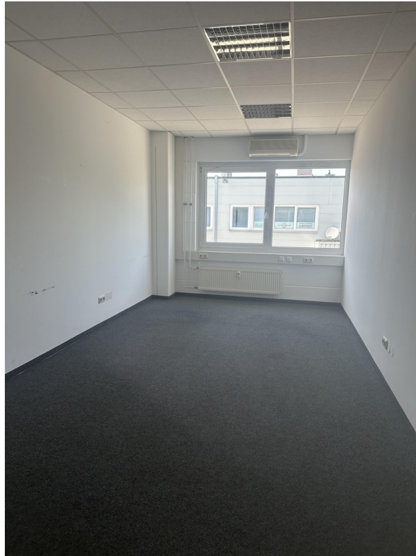
Büro ca. 18 m 2