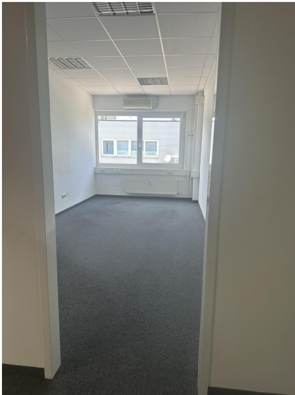
Büro ca. 18 m 2