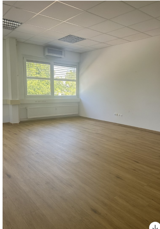
Büro 2 nach Renovierung