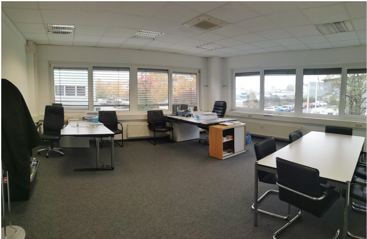
Eckbüro 37 qm