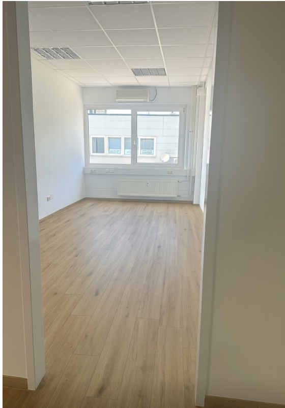
Büro 1 nach Renovierung