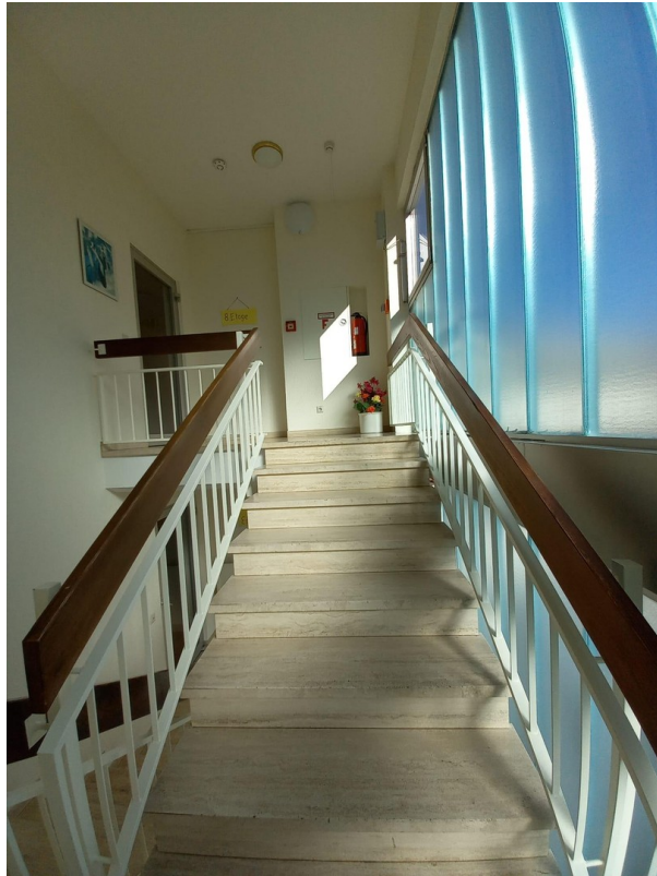
Treppe zum 8.OG