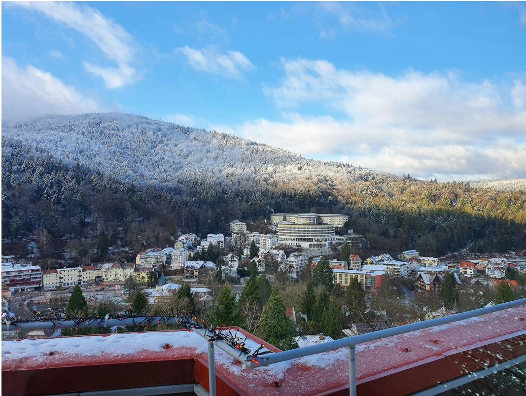
Aussicht im Winter