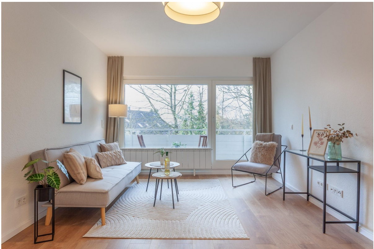
Wohnzimmer mit Balkonzugang