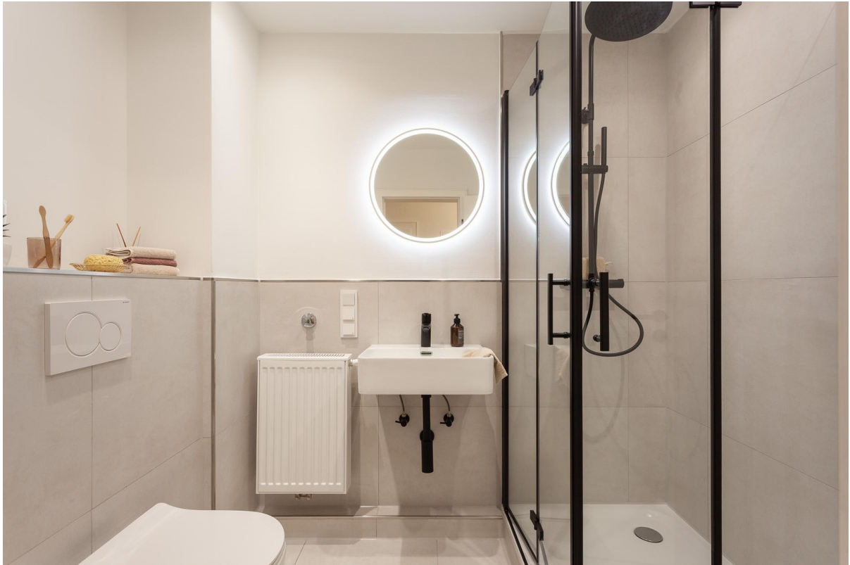
Badezimmer mit Regendusche