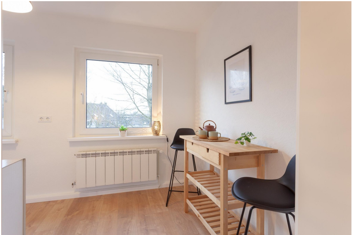
Frühstücksbereich in Küche