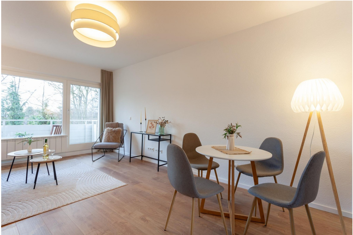
Essbereich im Wohnzimmer