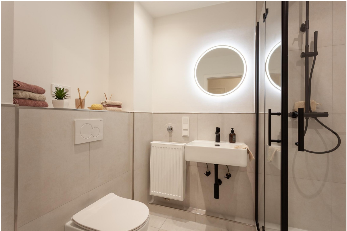
Badezimmer mit Regendusche