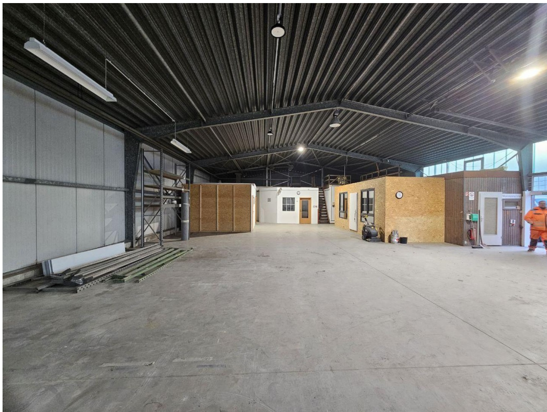
Innenansicht Halle 2