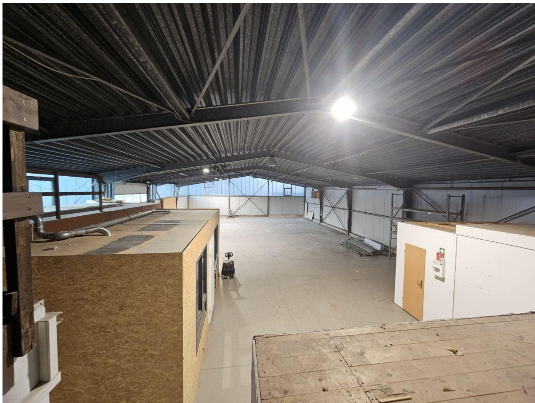
Innenansicht Halle 4