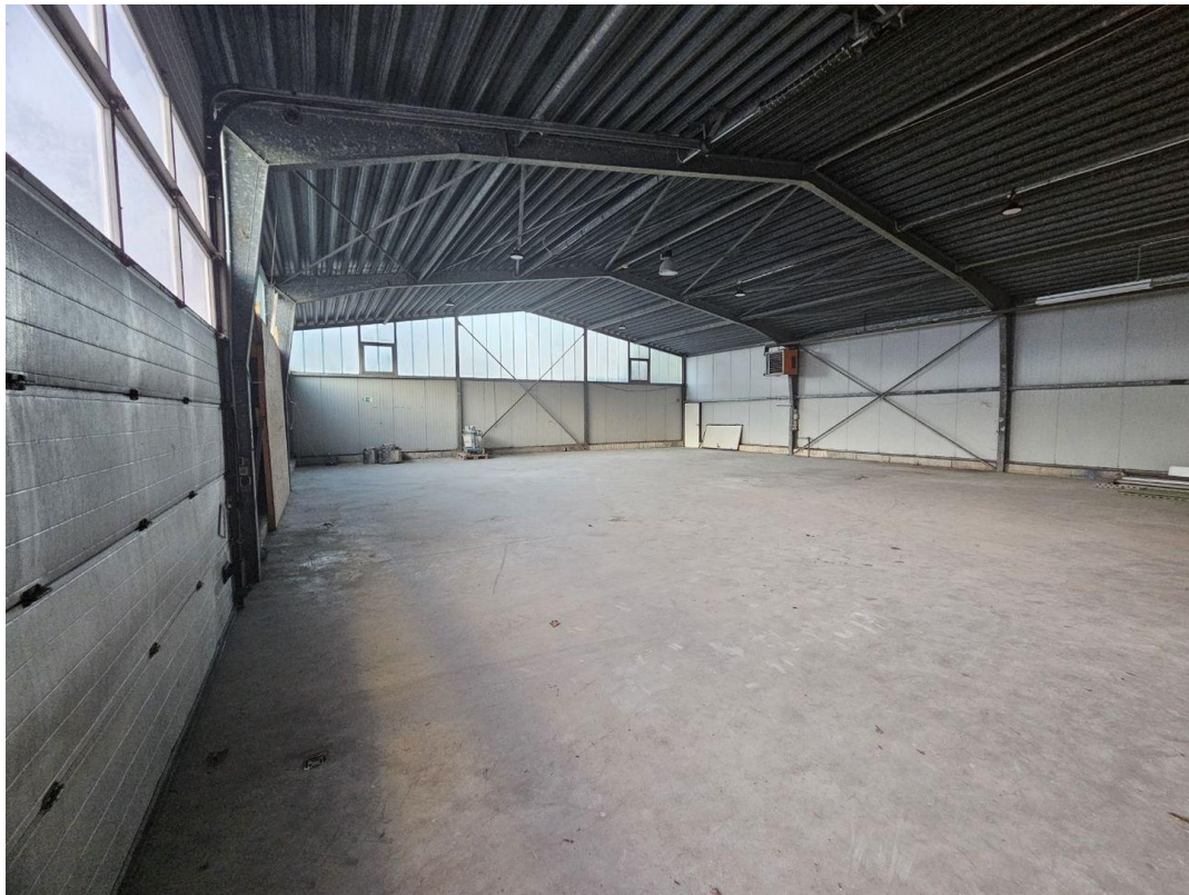
Innenansicht Halle 3