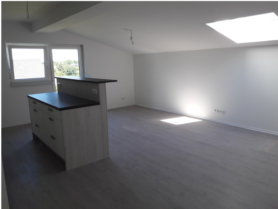
Küche + Wohnzimmer