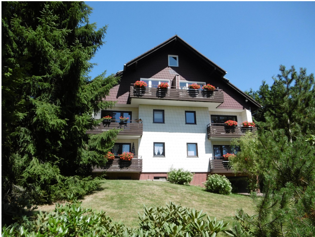
Haus von Süden