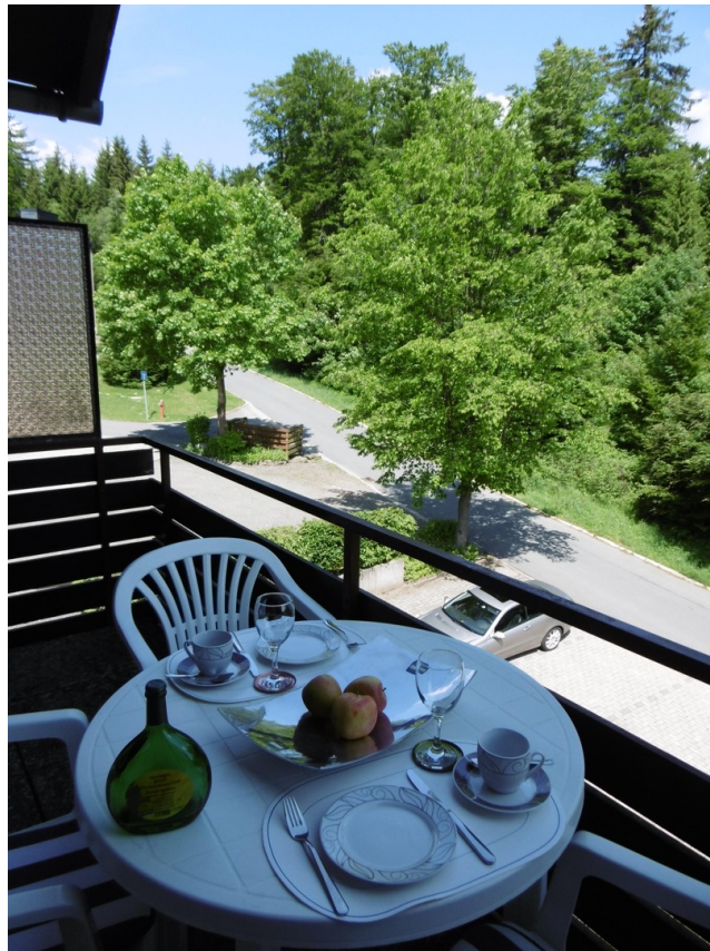
Ausblick Richtung Westen