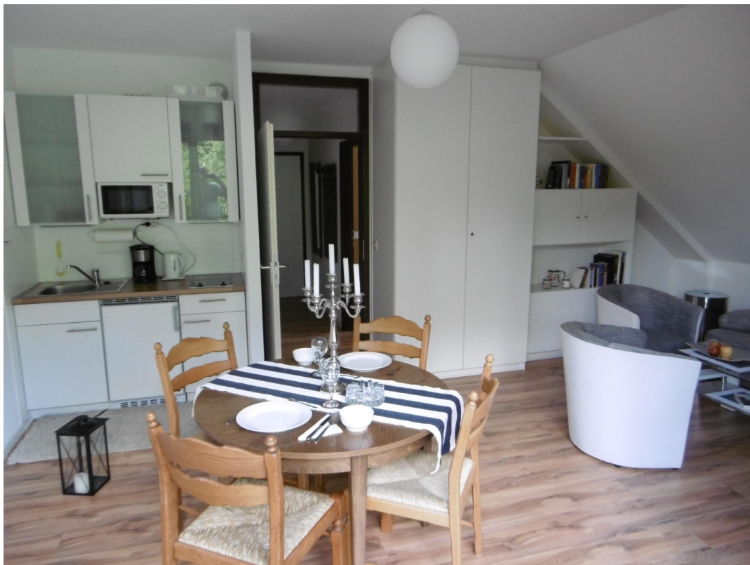
Wohnzimmer mit Küchenzeile