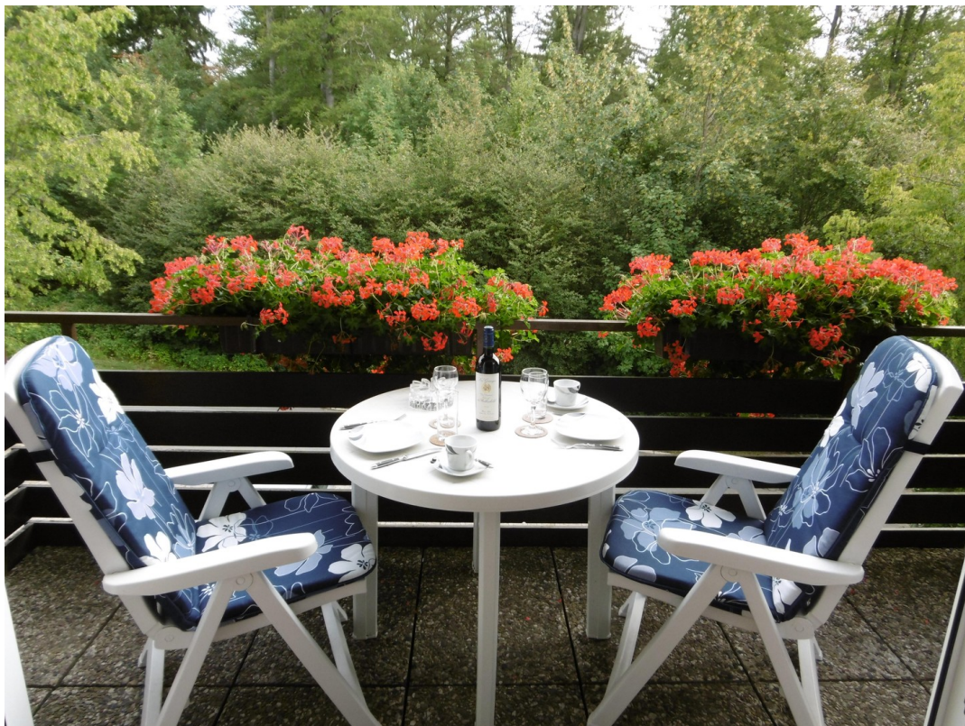
Balkon im Sommer