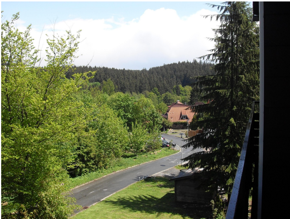
Ausblick Richtung Osten