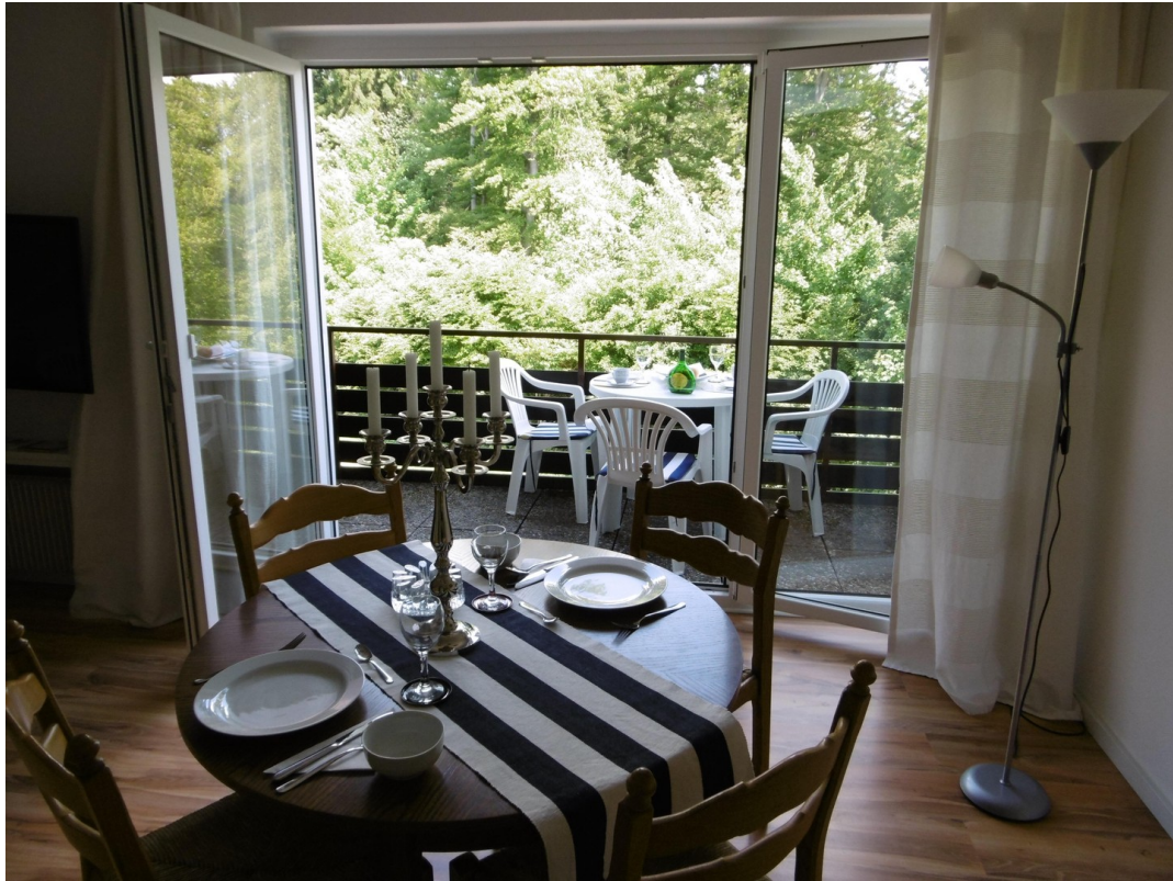
Wohnzimmer, Türen geöffnet