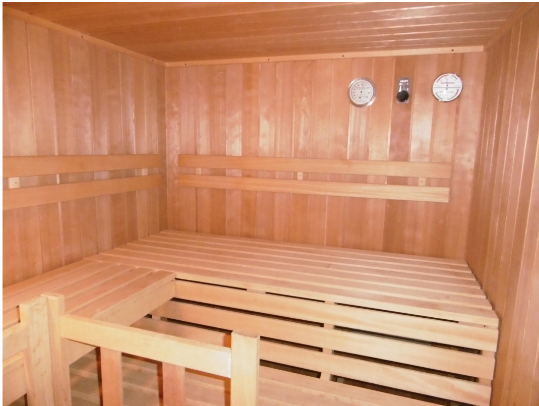
Sauna im Souterrain