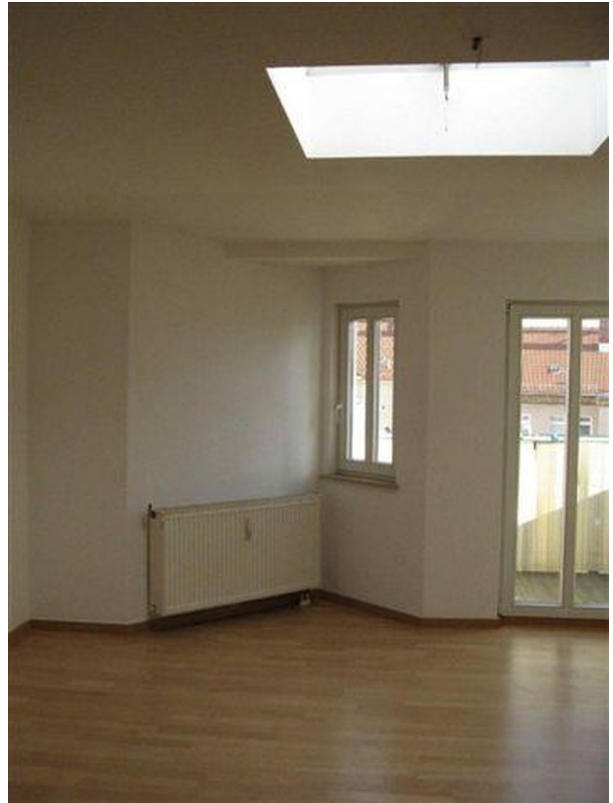
Wohnzi., Blick zum Balkon