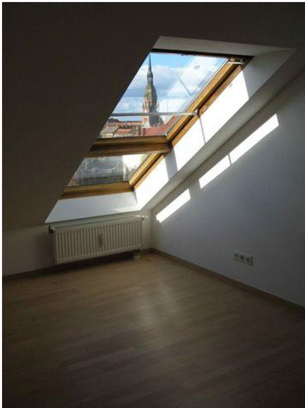
Schlafzimmer mit Aussicht