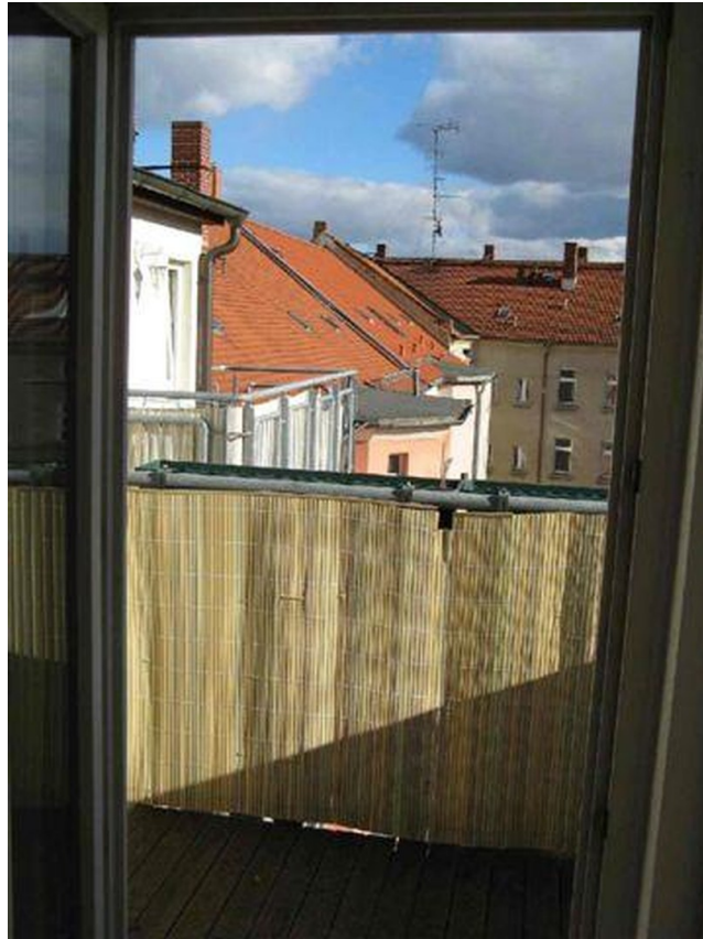
gemütl. Balkon zum Hof