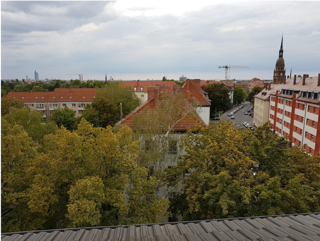
Aussicht bis ins Zentrum