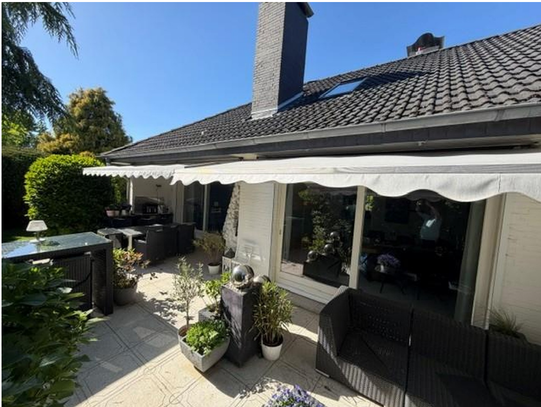
Terrasse Südseite mit Kamin