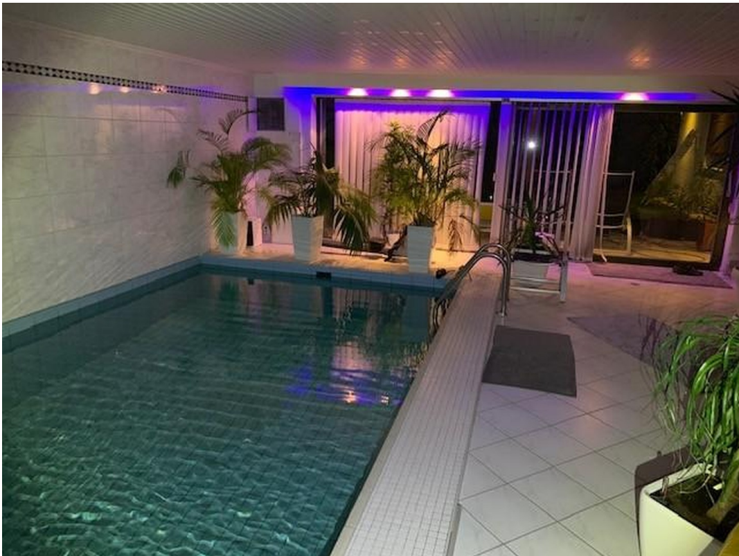
Indoor Pool offen