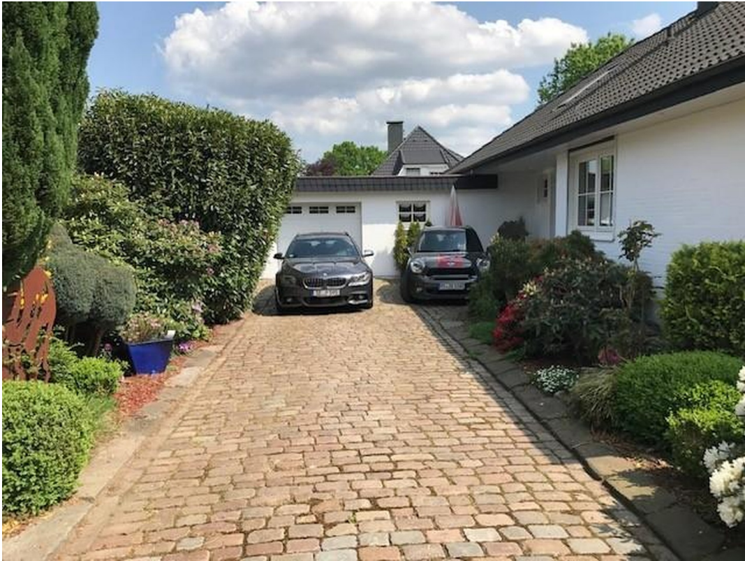
Hauseinfahrt mit Garage