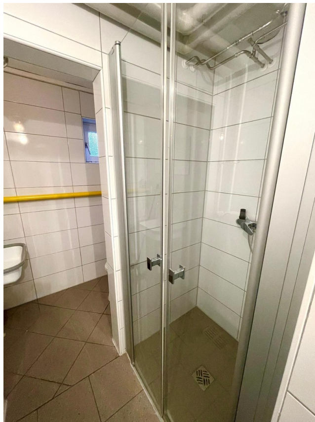
WC mit Dusche Keller