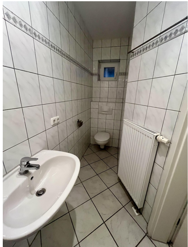
2. Bad im KG