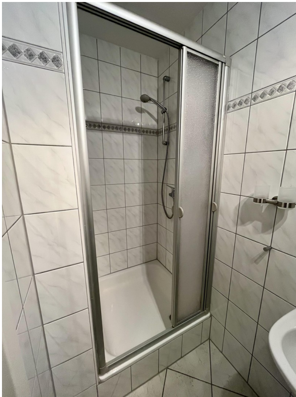
2. Bad im KG