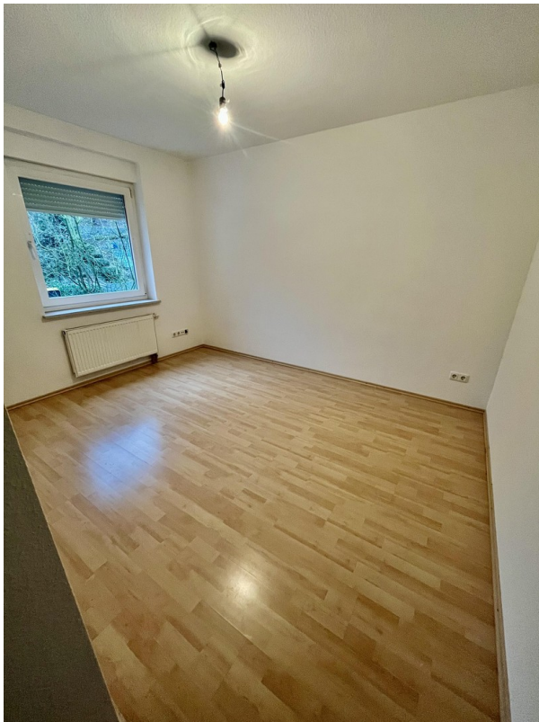
kleines Schlafzimmer 1.OG