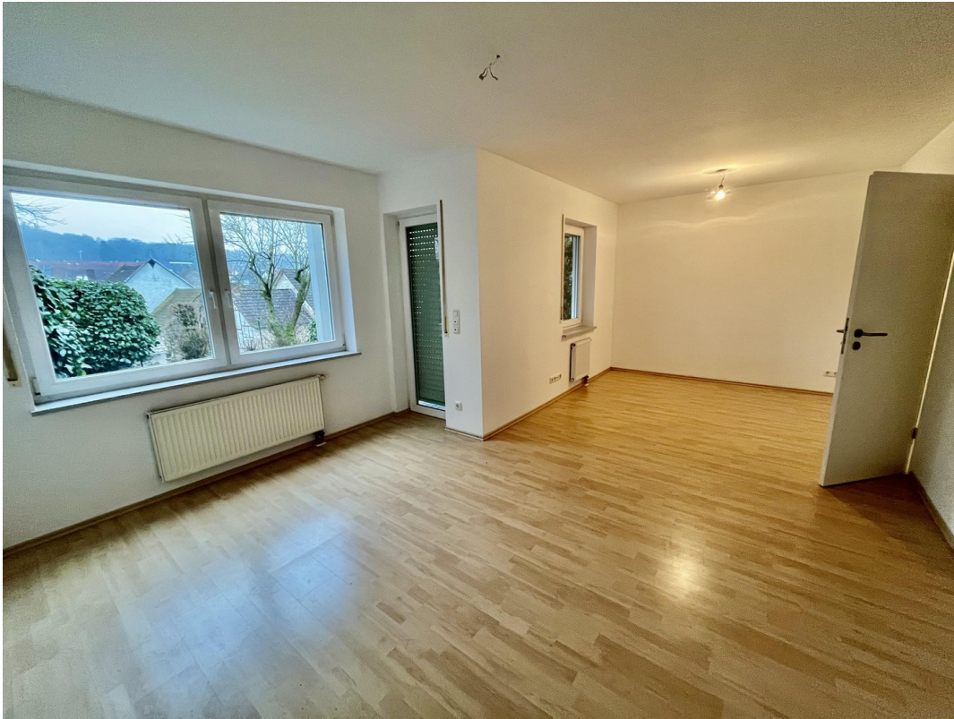
Wohnraum KG mit Gartenzugang