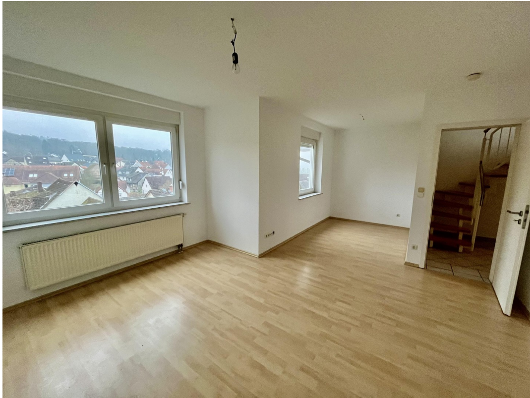
großes Schlafzimmer 1.OG