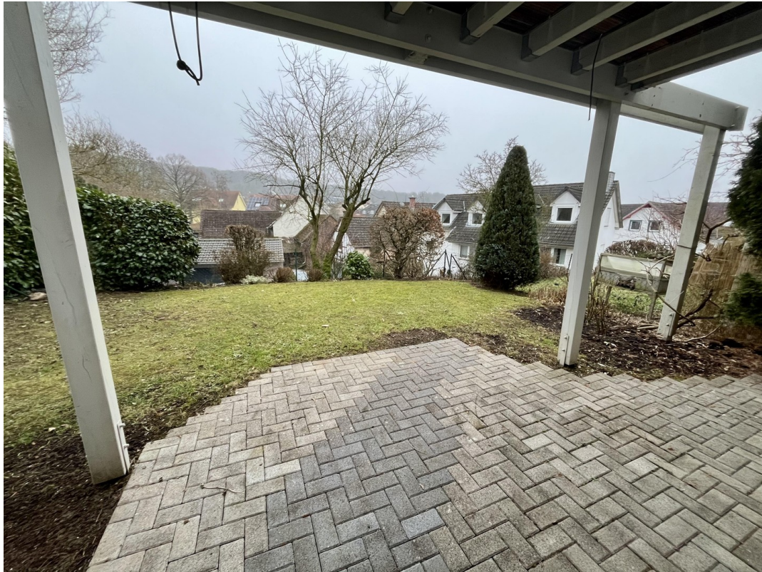
Garten mit Terrasse