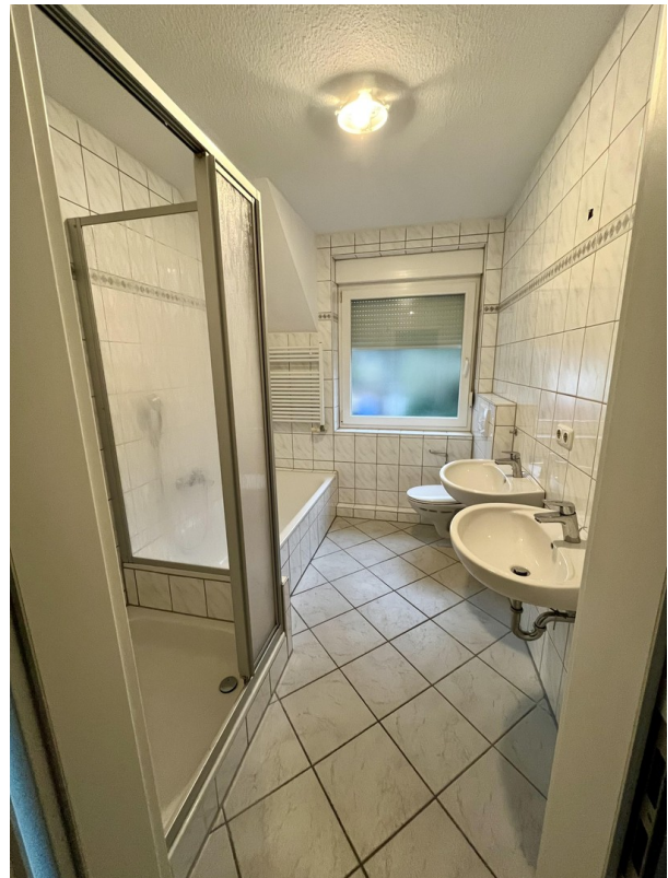
TG-Vollbad im 1.OG