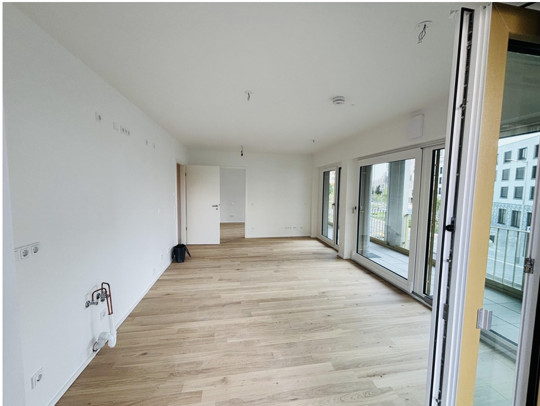
Blick in Wohn-/Essbereich