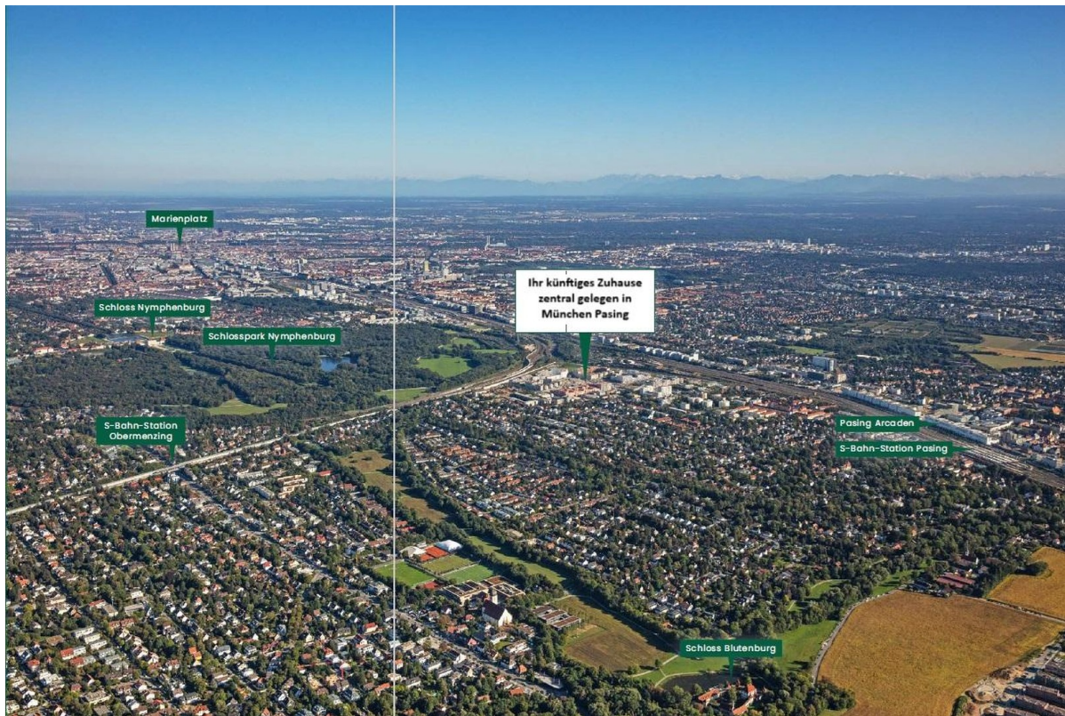
Lage / Umgebung